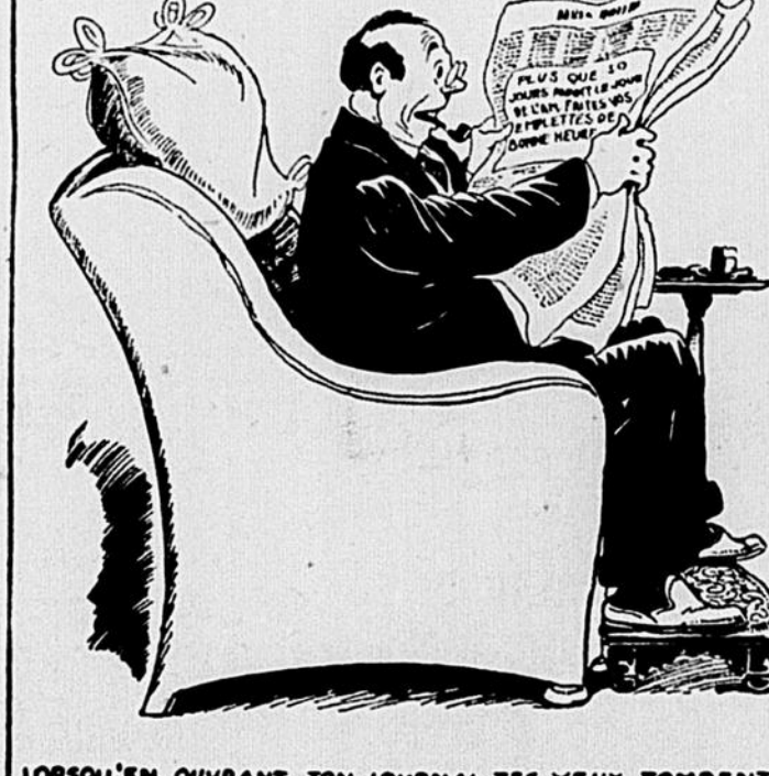
LORSQU'EN OUVRANT TON JOURNAL, TES YEUX TOMBENT SUR CETTE SAGE RECOMMANDATION: "PLUS QU'EN 30 JOURS AVANT LE JOUR DE L'AN - FAITES VOS EMPLETTES DE BONNE HEURE."