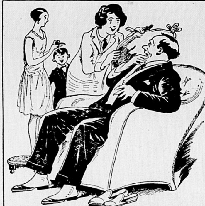
T'AS-PAS DÉJÀ, EN RENTRANT HARASSÉ DU BUREAU, TROUVÉ TOUS LES MEMBRES DE TA FAMILLE SINGULIÈREMENT EMPRESSÉS AUTOUR DE TA PERSONNE ? - TON ÉPOUSE T'APPORTE UN COUSSIN POUR TA TÊTE - TA FILLE, UN TABOURET - ET LE FISTON, TES PANTOUFLÉS