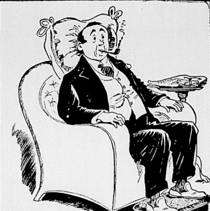
ET TU TE DEMANDES QUELLE EST LA RAISON DE CETTE SOLLECITUDE INACCOUTUMÉE