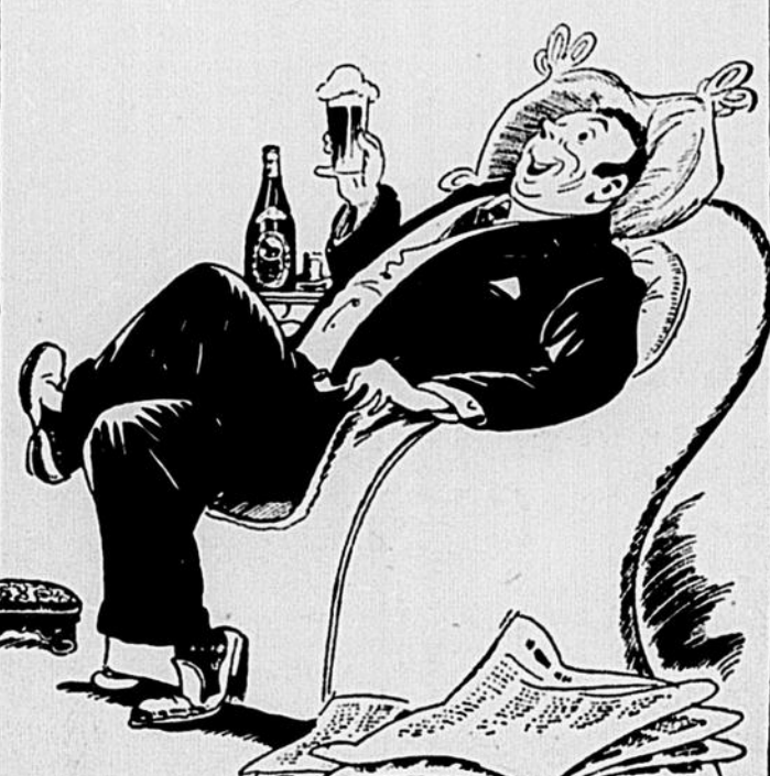
T'AS-PAS IMMÉDIATEMENT DEMANDÉ UNE BLACK HORSE ? ÇA OUVRÉ DE NOUVEAUX HORIZONS SUR LES PLAISIRS DES FÊTES PROCHAINES.

dites simplement - "Bière Black Horse Dawes s.v.p.!"