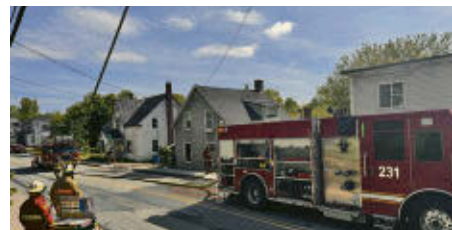
L'incendie a été localisé dans un des trois logements.

Au total, une vingtaine de pompiers ont pris part à l'opération. « Nous avons eu l'entraide de Richmond et de Saint-Claude dans cette affaire », termine M. Leclerc.