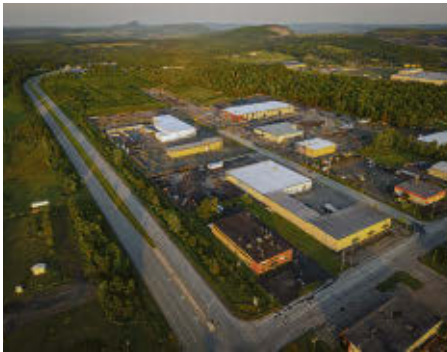
Quartier de la diversification.

Richard Lefebvre rlefebvre.journal@gmail.com