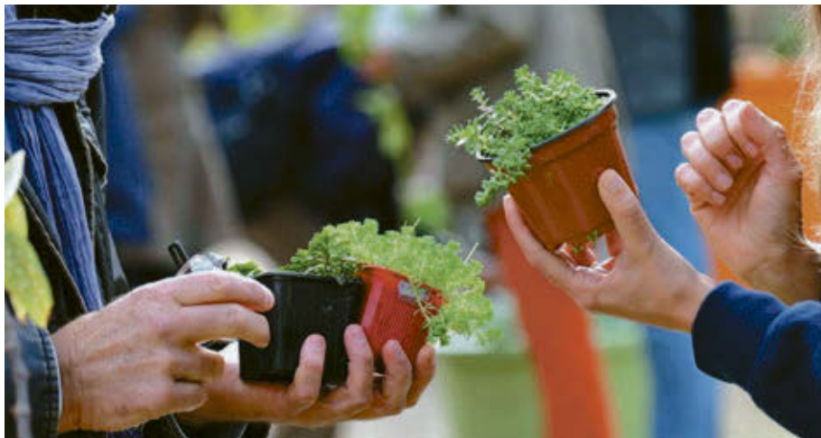
Les Amis de la Terre du Val-Saint-François ont instauré depuis plus de dix ans cette coutume qui gagne en popularité d'année en année.