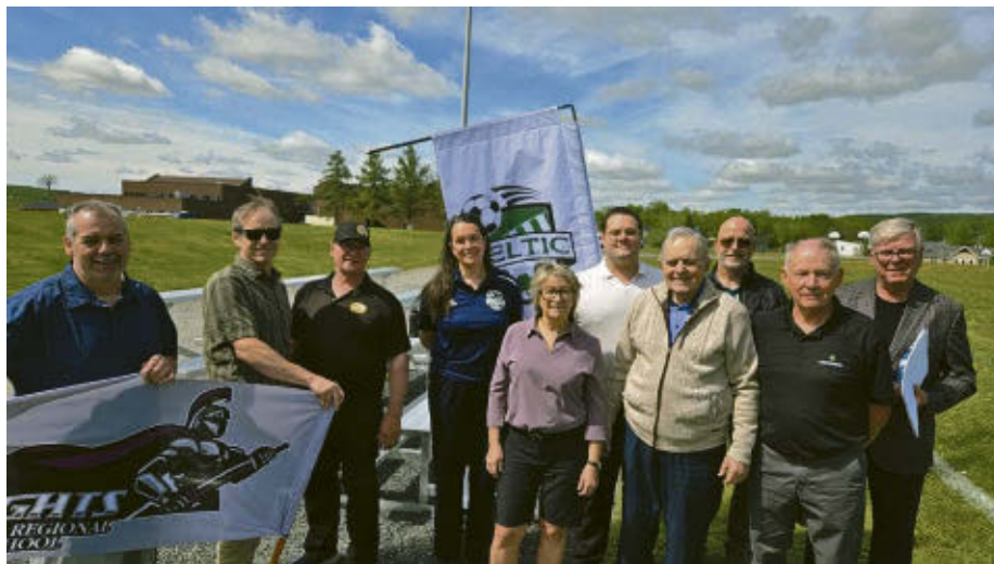
Le terrain de soccer a officiellement été inauguré dernièrement.

Ce dernier, tout comme ses homologues, a voulu mettre l'emphase sur la dévotion et l'engagement du Club de soccer Celtic dans le projet.