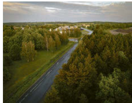
Quartier des écomatériaux.

Prenant la parole devant les convives, le