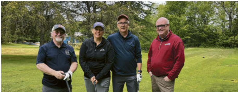
Ils étaient plus de 148 participants à prendre le départ lors du tournoi de golf du maire de Val-des-Sources, présenté sur le terrain du Club de golf Val-des-Sources le vendredi 29 mai dernier.

également les organisateurs de cette journée, de même que l'équipe du Club de Golf Val-des-Sources pour leur chaleureux accueil.