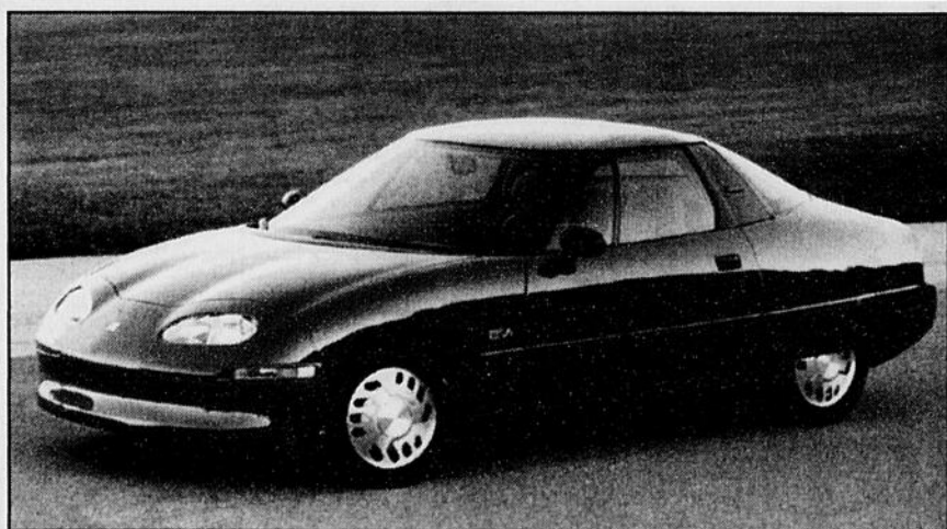
La compagnie General Motors a dévoilé la nouvelle voiture électrique EV1, dotée d'une structure entièrement en aluminium, développée en collaboration avec Alcan.