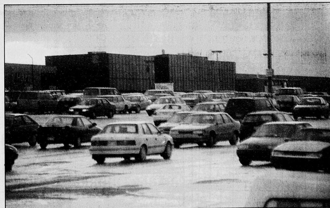
Le Carrefour de l'Estrie, avec ses 190 marchands occupant une superficie de 900 000 pieds carrés, se classe cinquième au Québec pour l'importance de ses ventes. Quelque 130 000 personnes s'y rendent toutes les semaines et le stationnement de 4700 espaces y est souvent occupé à pleine capacité.

Fondée en 1966, la chaîne de franchises des Services aux entreprises Padgett compte plus de 340 bureaux en Amérique du Nord où on offre des services de planification fiscale et de gestion financière à la petite entreprise.