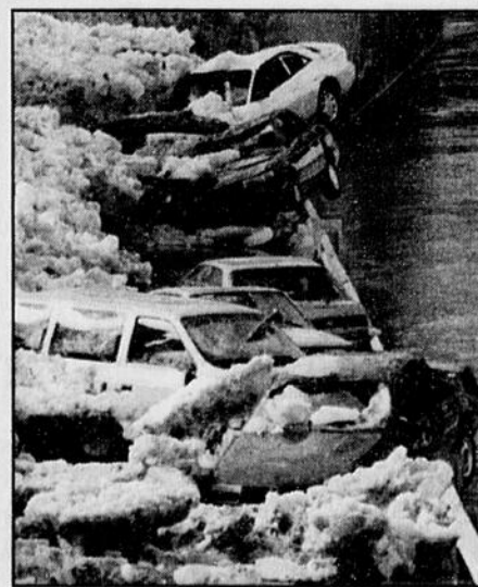
Des automobiles stationnées le long de la rivière Allegheny, à Pittsburgh, ont été «secouées» par la montée des eaux et les blocs de glace.

Au total, huit États américains sont touchés par la montée des eaux.