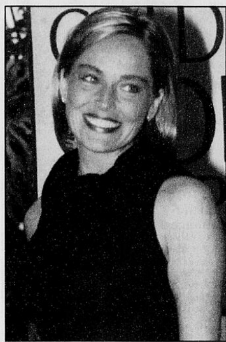
Sharon Stone a remporté le Golden Globe de la meilleure actrice dramatique pour son rôle dans «Casino».

Mira Sorvino, la pétulante prostituée dans le «Mighty Aphrodite» de Woody Allen, et Brad Pitt, dément pensionnaire