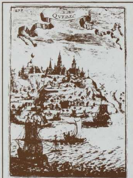
Bibliothèque Nationale du Québec

INT L'in pro par la Pré d'in par Env Réf par Natu par Les Qué par Déba