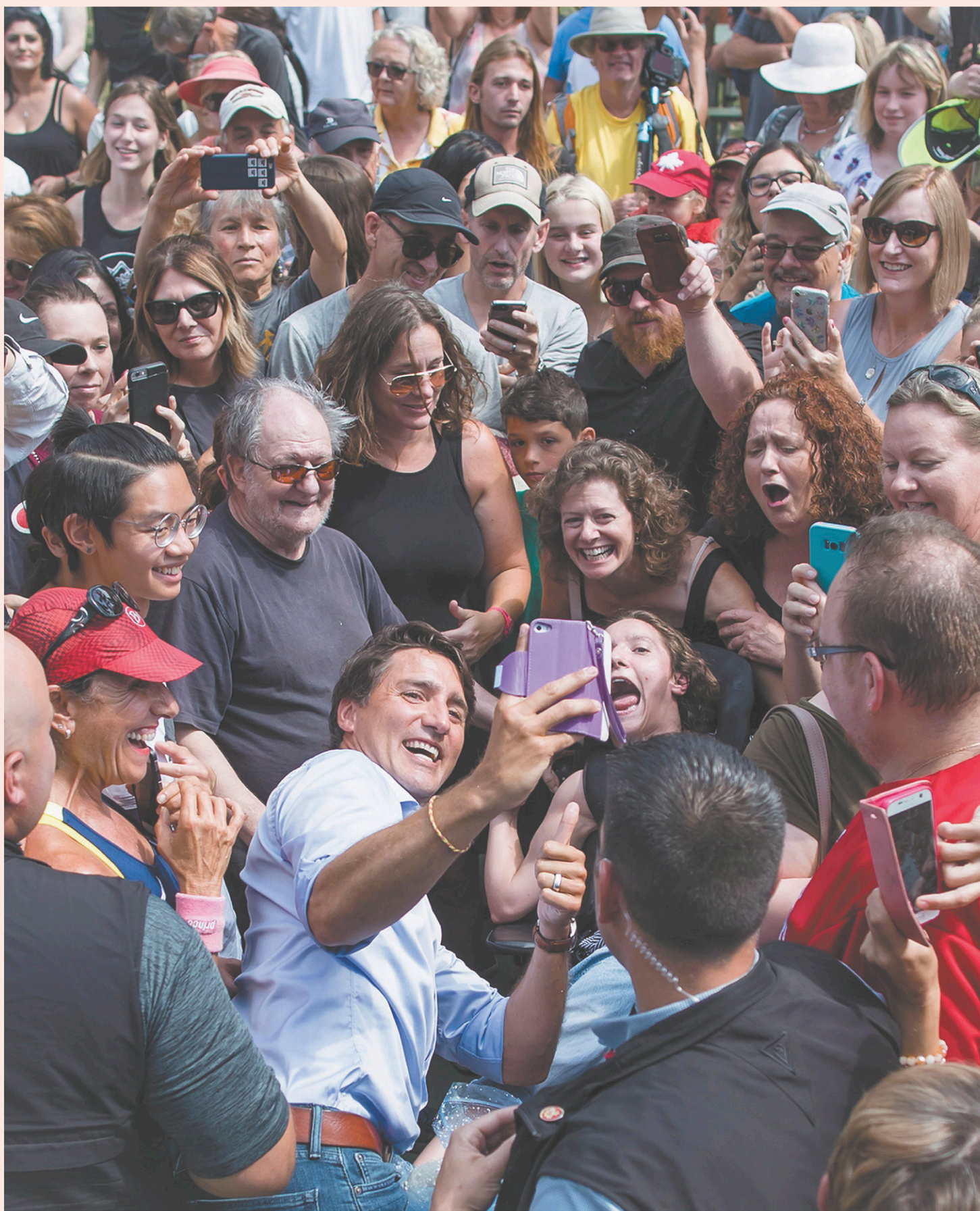
Les partis ne s'adressent pas à tous les électeurs, mais à ceux qu'ils veulent garder dans leur giron et à ceux qu'ils croient pouvoir rallier à leur cause. Et ils savent où les trouver. En photo, le premier ministre, Justin Trudeau.