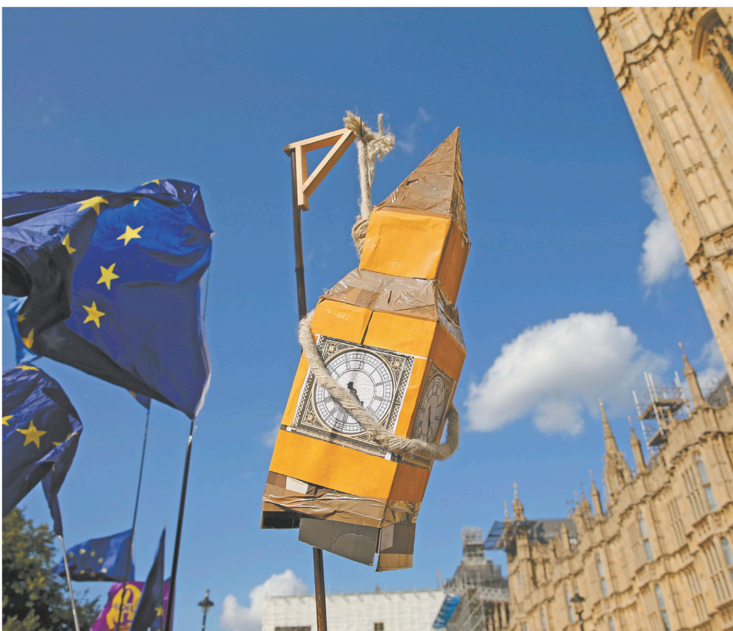
Cela ne fait plus de doute. Il y aura des élections précipitées au Royaume-Uni. Mais toute la question est de savoir quand.

Du côté conservateur, Brian Mulroney a fait un réel effort pour réconcilier le Québec avec le reste du pays, mais l'accord du lac Meech a échoué. Finalement, c'est la période minoritaire du gouvernement Harper (2006-2011) qui a été la plus favorable : reconnaissance de la nation québécoise « au sein d'un Canada uni », présence à l'UNESCO, hausse de la péréquation... Ces largesses ont pris fin quand M. Harper s'est assuré d'une majorité à la Chambre des communes. L'élection d'un gouvernement minoritaire le 21 octobre ne constituerait pas une garantie, mais elle pourrait soudainement améliorer la compréhension de la différence québécoise à Ottawa.