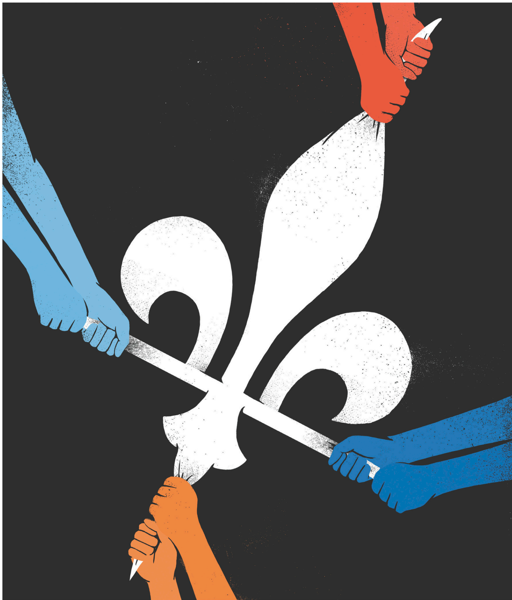
ILLUSTRATION SÉBASTIEN THIBAUT