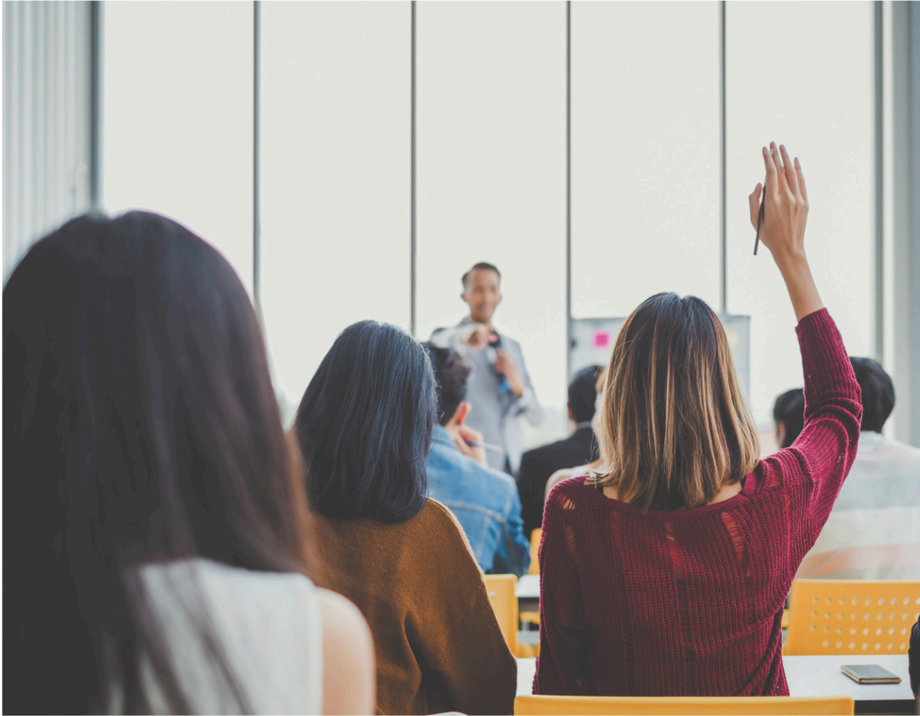
Selon la vice-présidente de la CSQ, les besoins des élèves en alphabétisation sont différents d'un individu à l'autre.