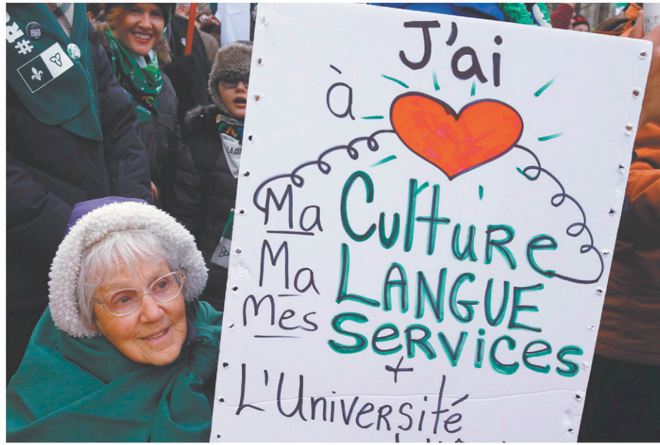
En décembre dernier, des Franco-Ontariens manifestaient contre la suppression de services en français dans la province.

Les plus récents déboires juridiques franco-canadiens ont d'ailleurs révélé la limite apparemment atteinte de l'article 23 de la Charte canadienne des