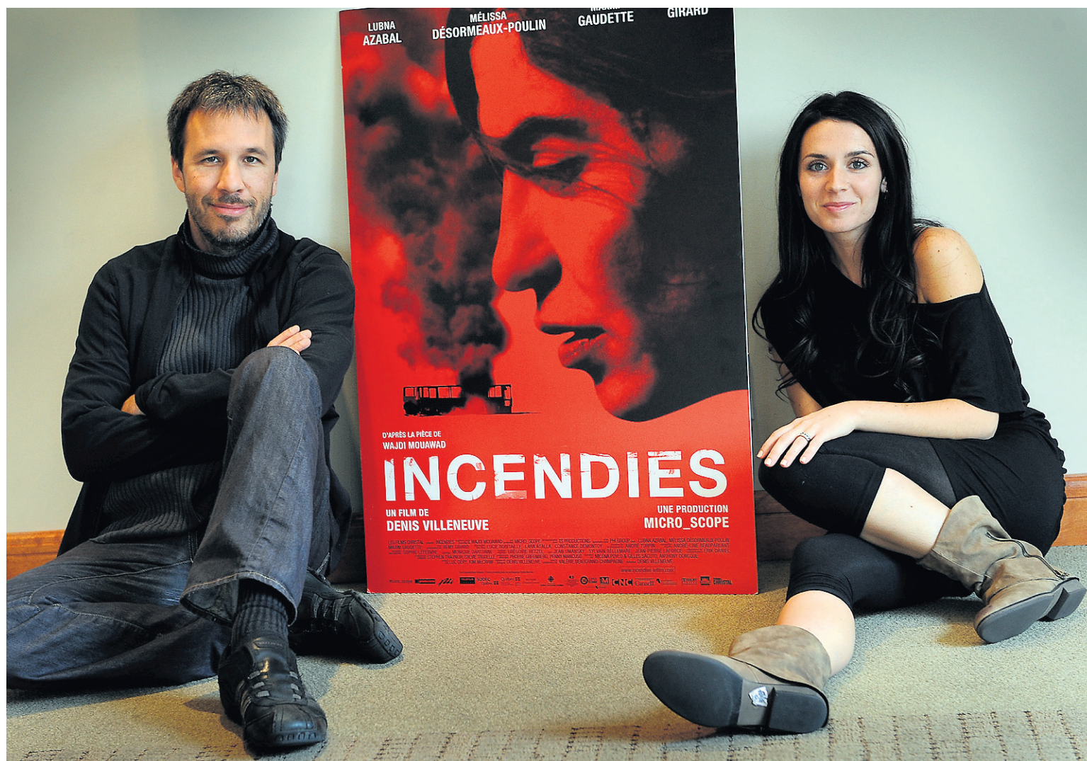
Denis Villeneuve et Mélissa Désormeaux-Poulin