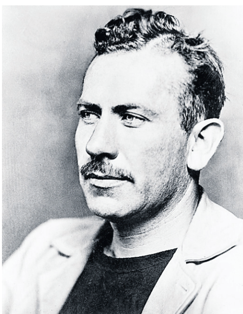
John Steinbeck