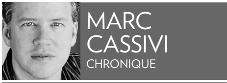
MARC CASSIVI CHRONIQUE

N'appelons pas ça une controverse. Appelons ça une démonstration, parmi tant d'autres, du mur étanche – et insonorisé – qui sépare le Québec du reste du Canada. Un mur de gypROC (s'cusez-la) dont les joints ont été si bien tirés qu'on en oublie leur existence. Sauf quand il y a des dégâts d'eau.