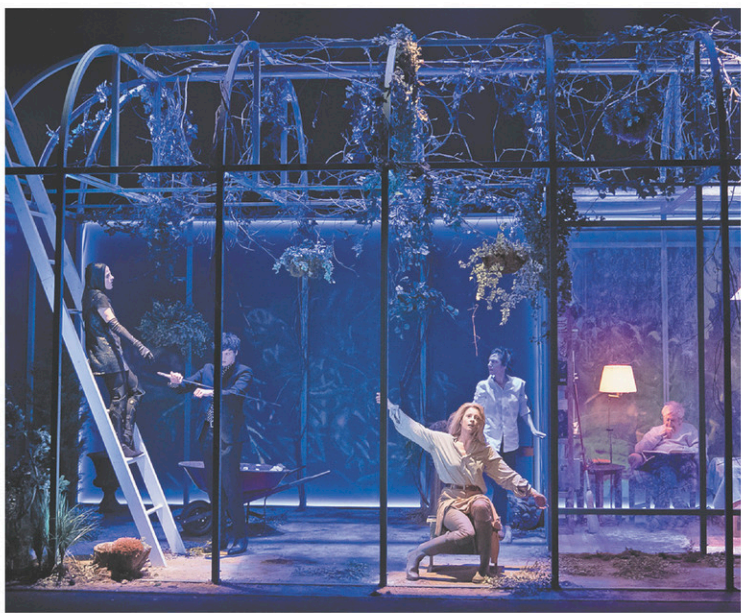
L'action de La vie utile se déroule dans une serre, au milieu d'une forêt, dans laquelle évoluent les personnages de la pièce.