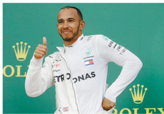
Lewis Hamilton sur le podium après sa victoire au Grand Prix d'Azerbaïdjan

« C'était probablement l'un des meilleurs tra-