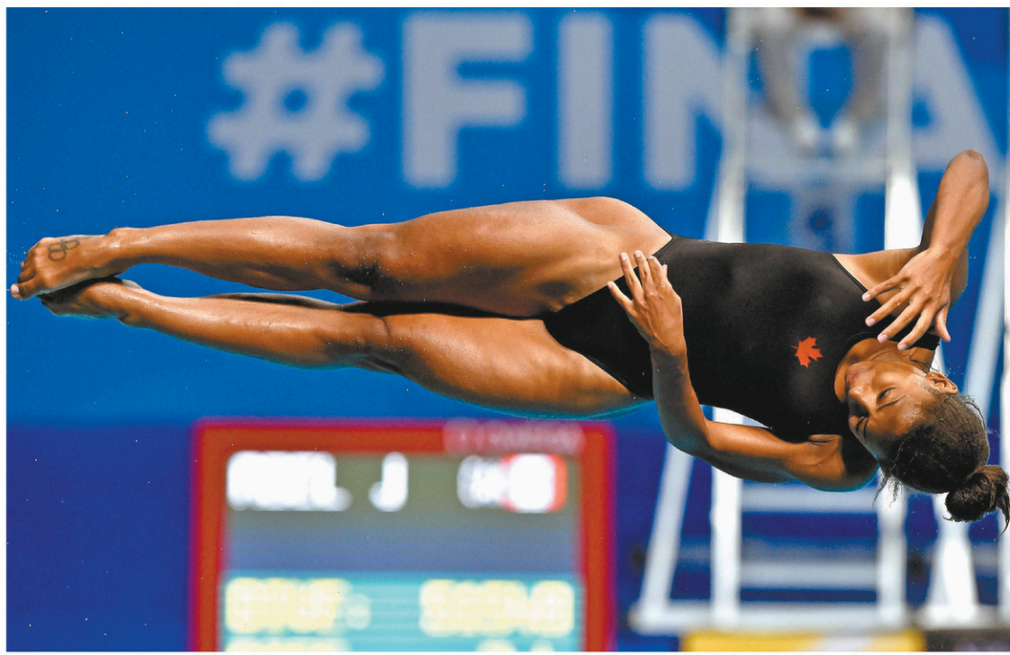
Jennifer Abel lors de la demi-finale au tremplin de 3 mètres individuel du championnat mondial de natation de la FINA, à Budapest en Hongrie, en juillet dernier