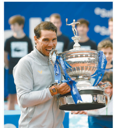
Nadal essaiera de remporter un onzième trophée à Roland-Garros au mois de juin.