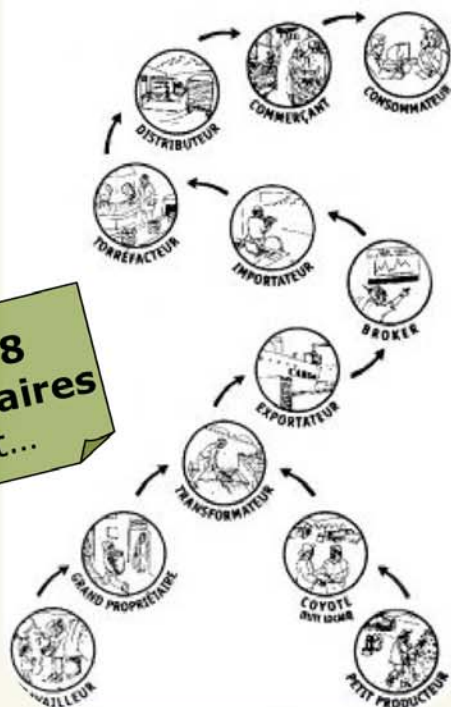
LA ROUTE CONVENTIONNELLE