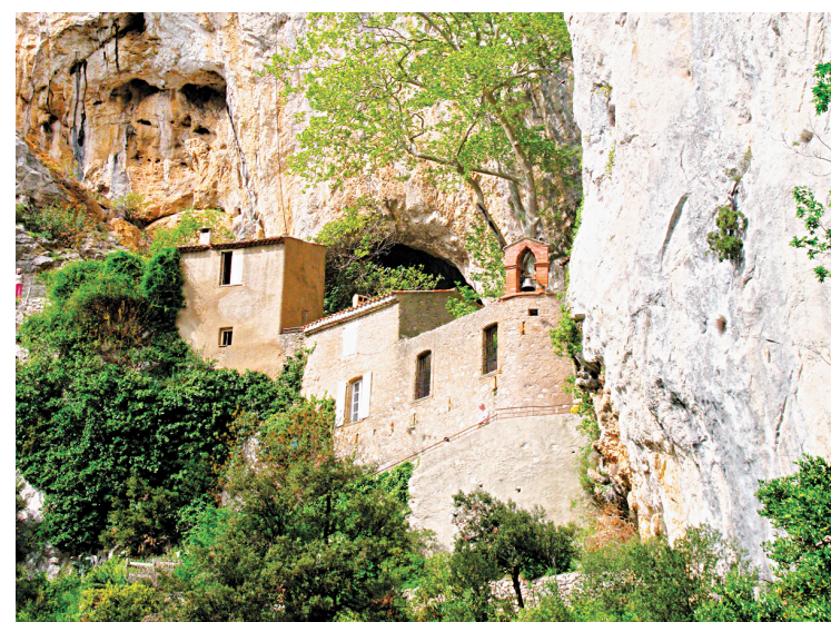
Ermitage Saint-Antoine, gorges de Galamus.