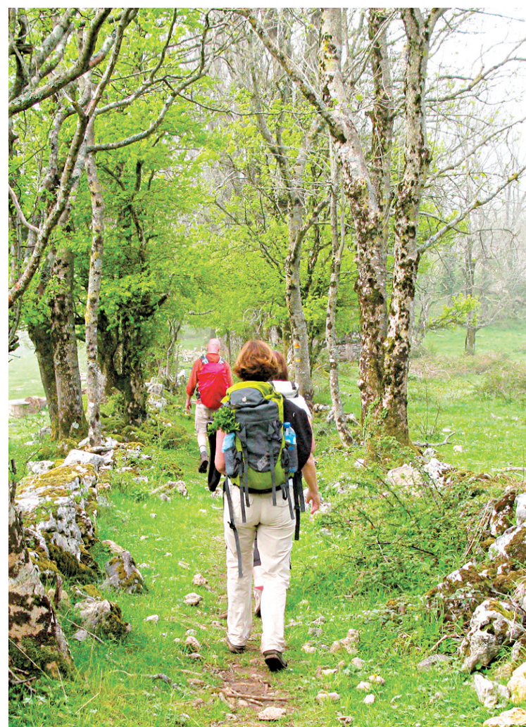
Sur le Sentier cathare, entre Camps-sur-Agely et Bugarach.