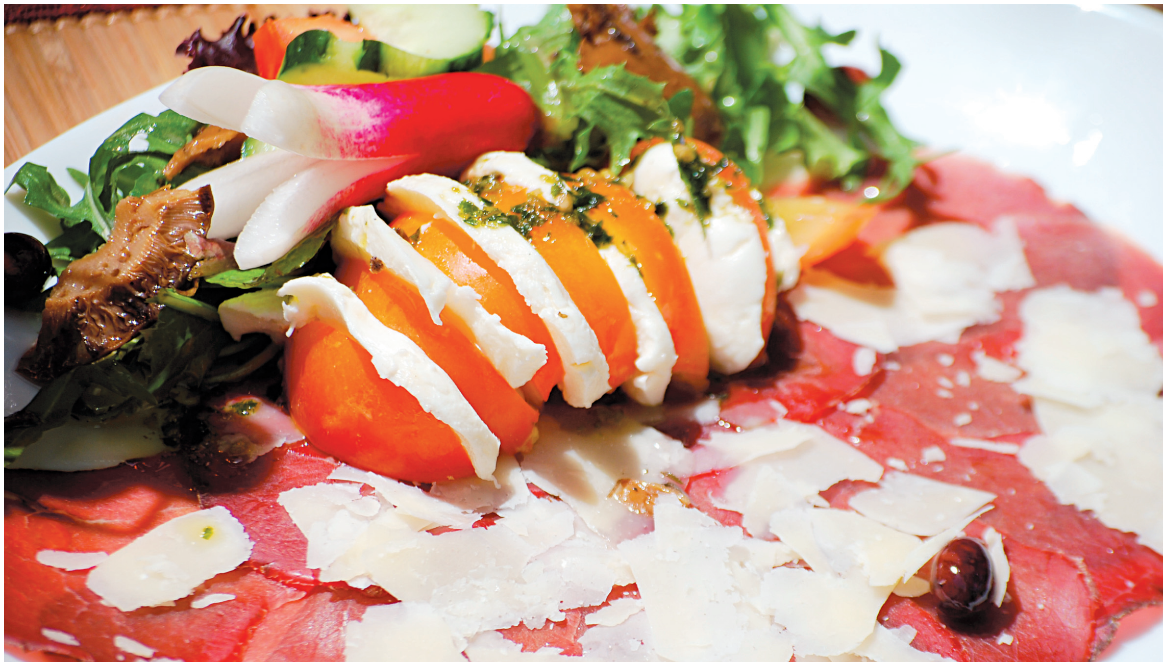
Une salade bien arrosée d'huile d'olive dégustée en Italie. Ce pays est l'un des grands producteurs de cette huile.

Les huiles et les vinaigres sont de plus en plus recherchés des consommateurs d'ici et d'ailleurs. Il s'agit d'un marché intéressant pour les producteurs, mais il comporte aussi de nombreux défis.