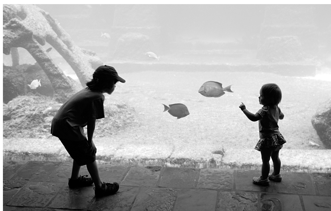
Plusieurs grandes parois de verre permettent d'observer la faune marine de The Dig, depuis un souterrain.

C'est d'ailleurs là que le bât blesse, au Atlantis. Dans le meilleur des cas (sauf en cas de promotions), j'une chambre seule, sans repas et avec avion en sus, se détaille 280$ — donc 2000$ par semaine, pour deux personnes. A ce tarif, on accède gratuitement au parc aquatique, mais pour tout le reste, il faut allonger la monnaie, que ce soit