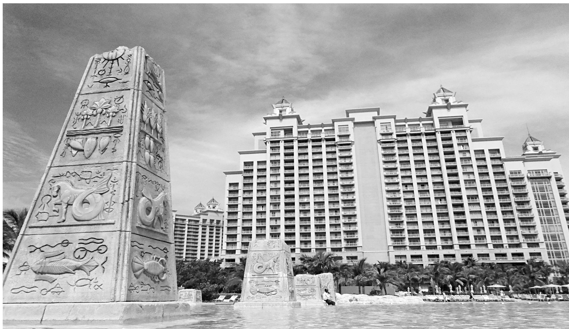
Pas moins de 13 piscines et plans d'eau ponctuent Atlantis, comme ici, devant la tour baptisée The Cove.