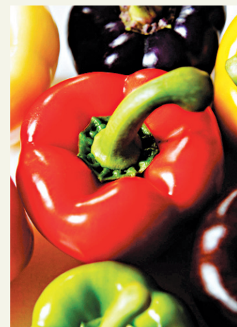
De bons poivrons frais.

Verser l'huile d'olive de la finition et le bouillon, ajouter un peu de sel et cuire au four durant 30 minutes à 350 degrés.