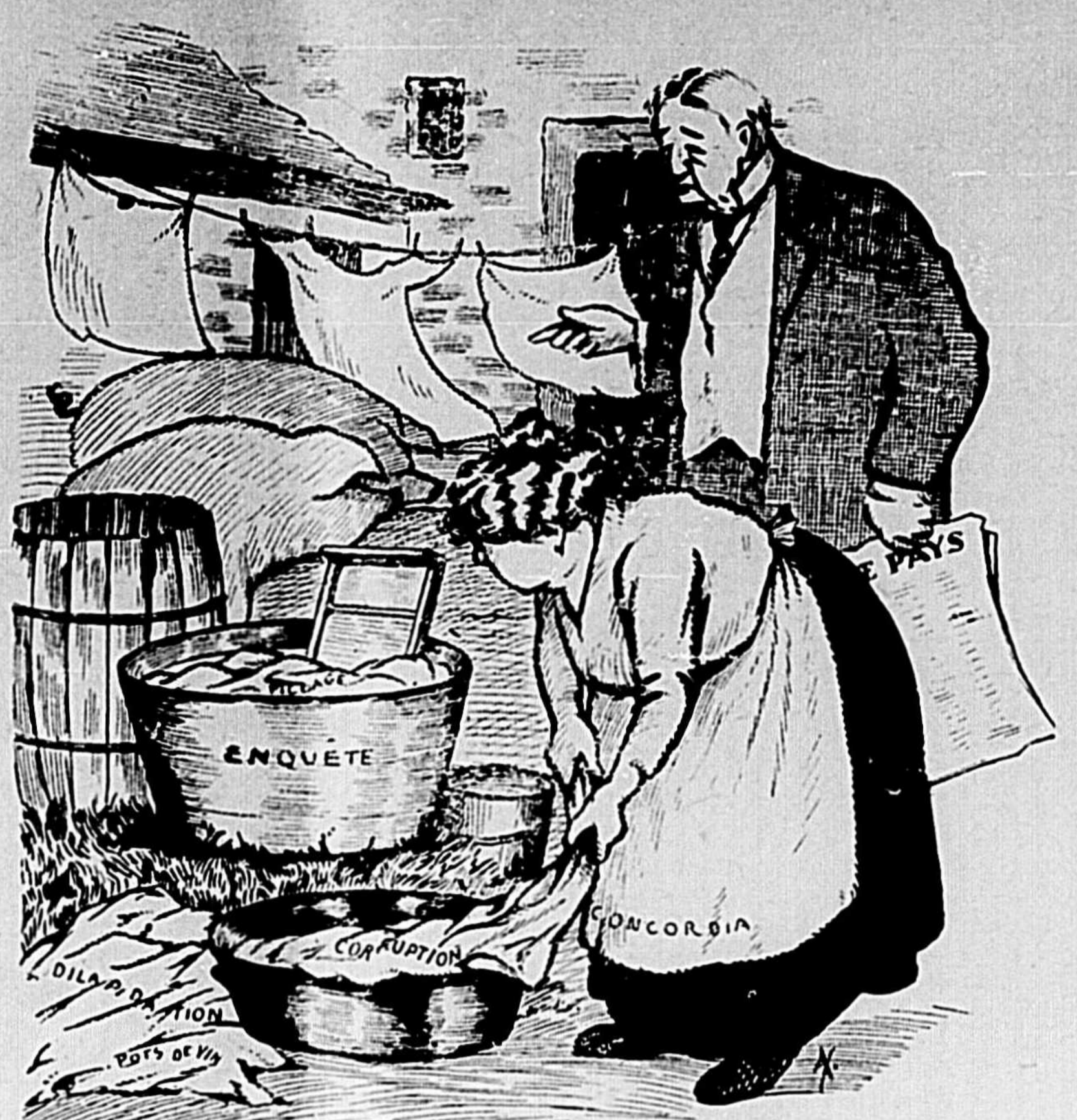
—Dépêche-toi de faire ta lessive Concordia! Tout ce linge sale empesté...

De là à prostituer sa conscience, à vendre son vote pour un verre de whisky, et une promesse de député, il n'y a qu'un pas. Voilà comment un fait insignifiant: un journal qui se vend après s'être donné à qui en a voulu, crée une perturbation dans les esprits et jette du désordre dans les âmes. Scandales perversifs! L'opinion publique et notre corps électoral est bien malade parce que l'action déléguée de la presse a lentement empoisonné son organisme.