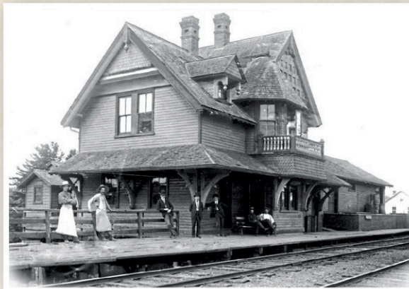
Sans conteste la plus belle gare de Bellechasse, celle de Saint-Anselme, ici captée dans toute sa splendeur.

Le second axe ferroviaire d'une longueur de 32,4 km fut érigé dès 1873 avec des rails importés d'Angleterre par Louis-Napoléon Larochelle, opérant sous le nom de Compagnie du chemin à lisses de Lévis à Kennebec (LRK). Le tronçon entre Lévis et Saint-Anselme est complété en 1874 et compte quatre gares : St-Henri (au croisement de la ligne du GTR), Saint-Henri village, Saint-Gervais et Saint-Anselme. En 1876, un prolongement vers le réseau ferroviaire américain fut construit, reliant Scott-Jonction et Saint-Joseph-de-Beauce. En 1880, le LKR est acculé à la faillite. En 1881, la voie de 91,1 km est vendue à la compagnie Québec Central Railway . Beaucoup de Québécois ont utilisé cette voie ferrée pour