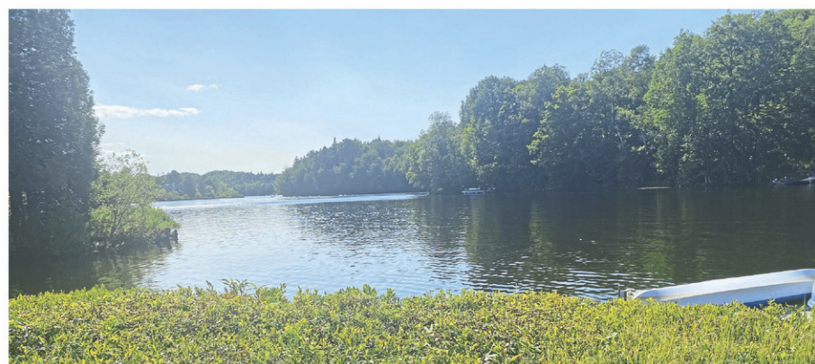
Le lac Crève-Faim, à Buckland, est lui aussi touché par des épisodes de cyanobactéries.