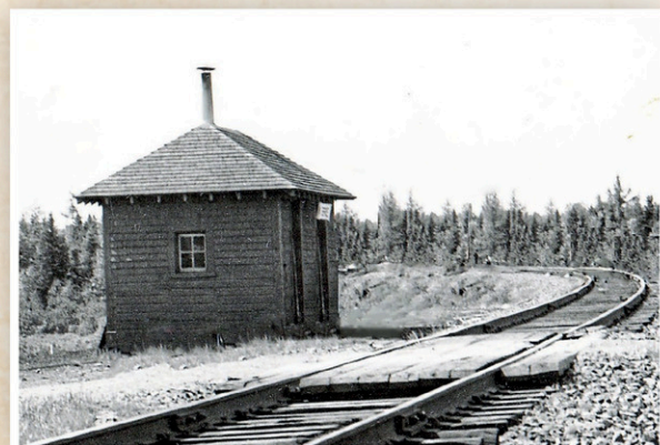
La plus petite gare, située à Saint-Damien-de-Buckland, face au moulin Goulet, photographiée peu avant l'incendie qui la détruisit.

Pour vous abonner, vous pouvez vous inscrire sur le site Internet de la SHB https://shbellechasse.com . Les transactions en ligne sont sécurisées.