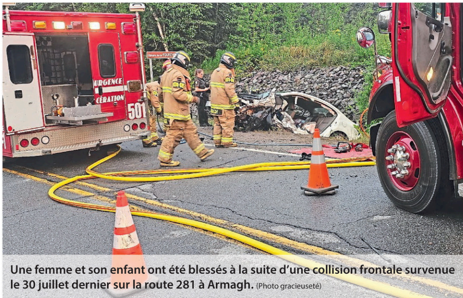
Une femme et son enfant ont été blessés à la suite d'une collision frontale survenue le 30 juillet dernier sur la route 281 à Armagh.

Une douzaine de pompiers de Saint-Raphaël et Armagh ont pris part à l'intervention, les pinces de désincarcération étant nécessaires afin de libérer la dame et son enfant de leur véhicule qui s'est retrouvé dans le fossé.