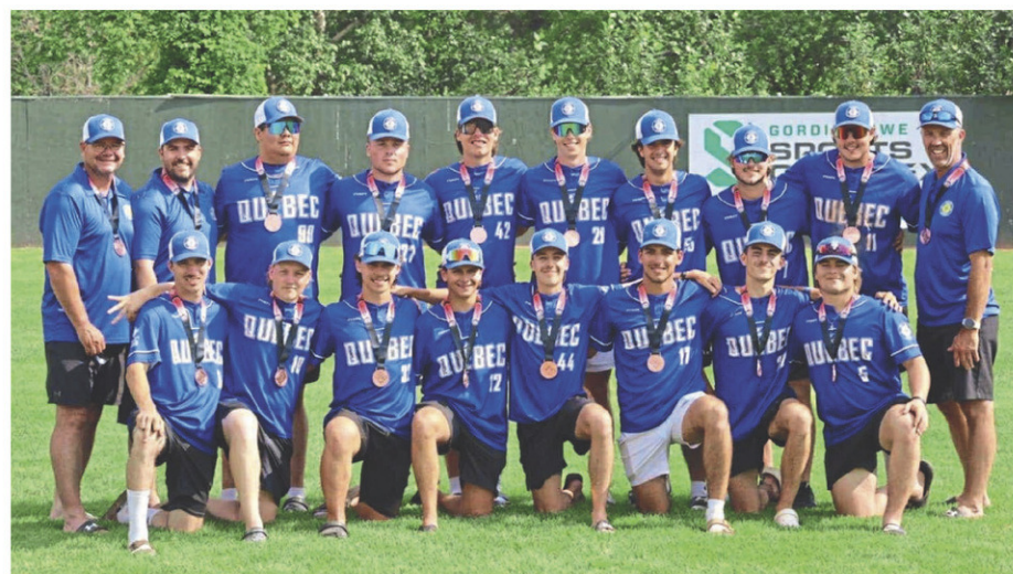
Équipe Québec a remporté la médaille de bronze aux récents championnats nationaux de balle rapide chez les 20 ans et moins.

Après avoir présenté une fiche de 4-2 en ronde préliminaire, les jeunes Québécois ont perdu leurs deux parties de la ronde des médailles, dont une contre au compte