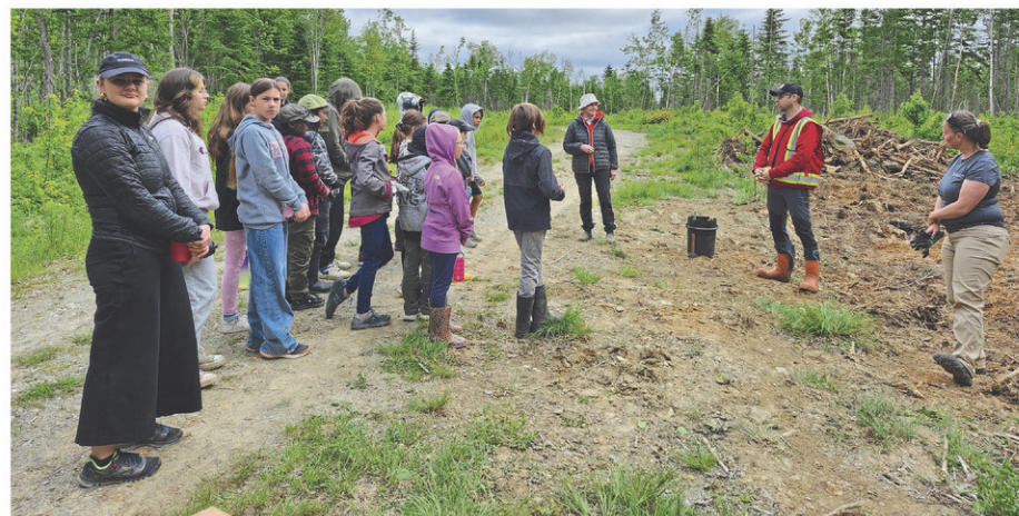
Une activité de reverdissement du camp du Refuge, dans le coupe-feu de Saint-Camille, a permis de mettre à contribution les élèves de 5 e et 6 e années de l'école Arc-en-Ciel de Saint-Camille, en juin dernier.