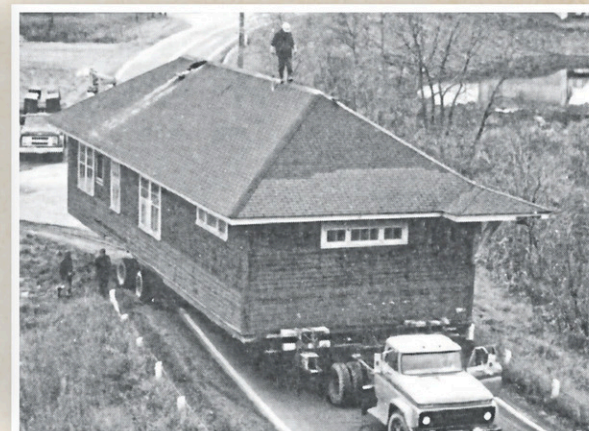
Quatre gares furent déplacées, dont trois transformées en résidences, soit celle de Saint-Malachie (photo), ainsi que celles de Saint-Henri, Saint-Anselme (CN) et Langlois au parc des Chûtes d'Armagh.

Au milieu du XIXe siècle et encore au début du XXe siècle, la construction ferroviaire représentait un immense défi. Il fallait arpenter les terrains, négocier les droits de passage, planifier la logistique, embaucher et loger la main-d'œuvre, puis excaver, niveler l'assise, poser les travées et les rails, et mettre en place les infrastructures connexes : gares, voies d'évitement, signalisation, traverses à niveau, réservoirs d'eau, entrepôts à charbon, systèmes de télégraphie, etc.