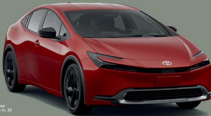
Véhicule présenté 2025 Prius Plug-in, SE