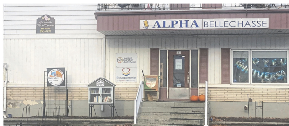
Bureaux d'Alpha Bellechasse à Saint-Anselme.