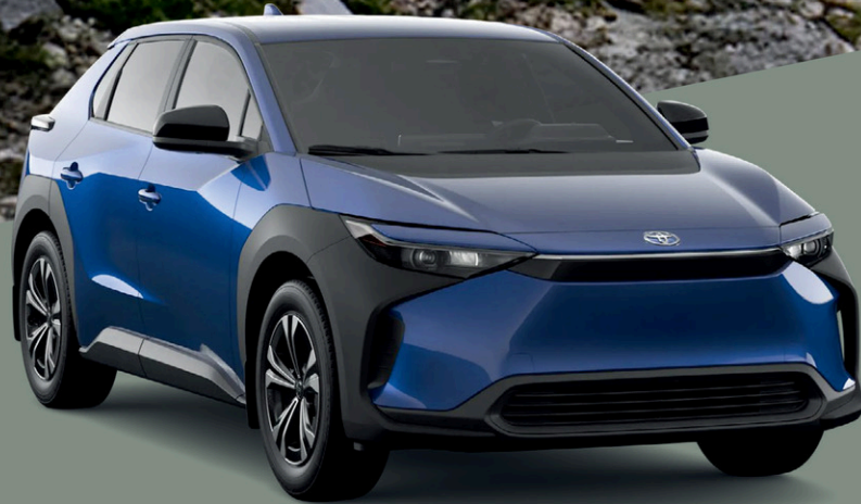
Véhicule présenté 2025 bZ4X, LE FWD