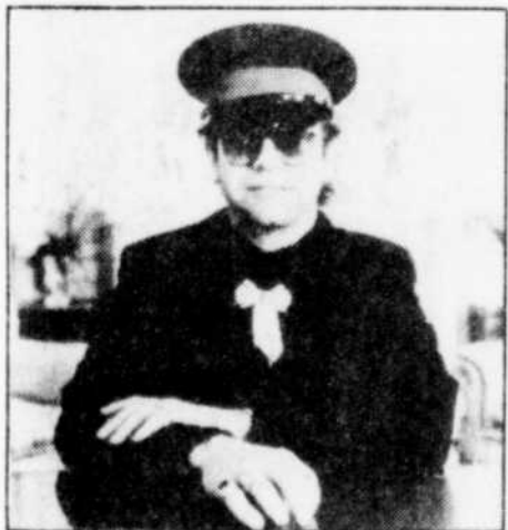
Elton John est interviewé et chante à SACRÉ SOIRÉE : SPECIAL MARRAKECH, samedi 4 août, 20h30 à TV5.