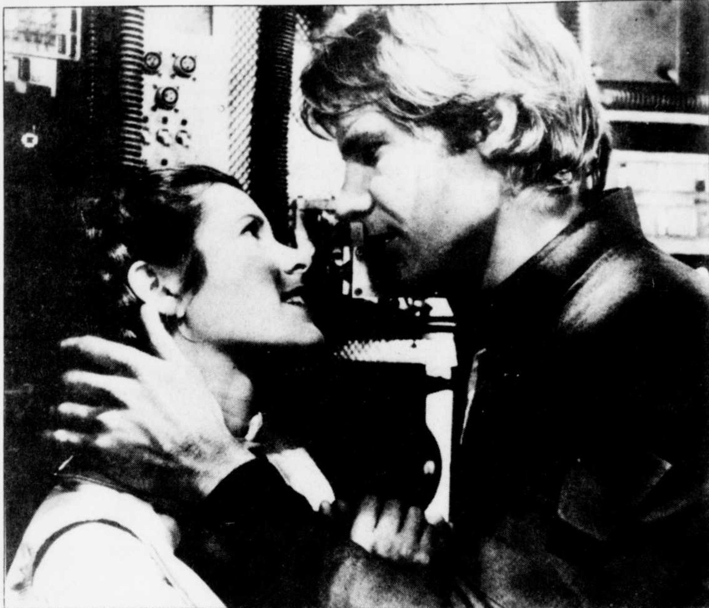
Aux GRANDS FILMS, 19h30 à Radio-Canada, on vous présente « L'empire contre-attaque » avec Carrie Fisher et Harrison Ford.

Comédie avec Dawn Lewis, Kadeem Hardison et Mary Alice. — La vie étudiante sur le campus d'une université afro-américaine aux États-Unis.