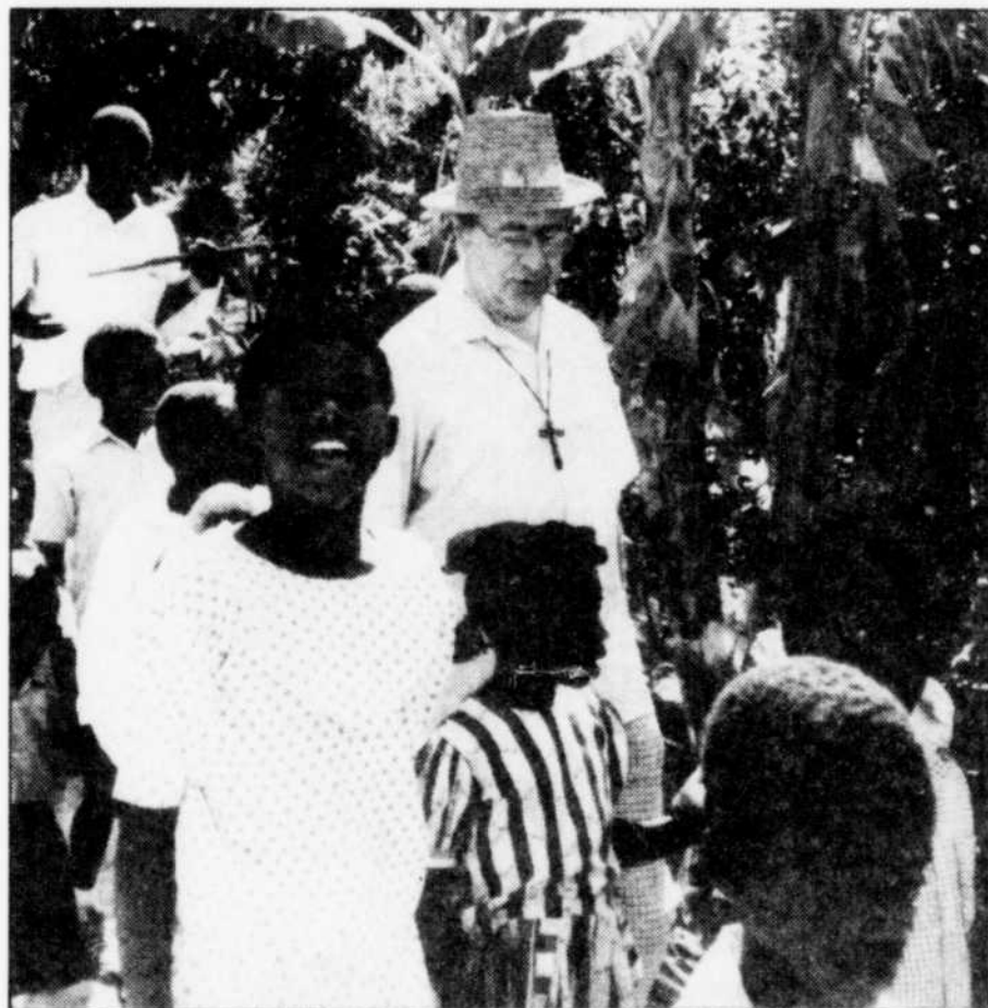
À VISIONS D'ICI, « Gouté-sel: Haïti un soir d'hiver », à Radio-Canada, dimanche 18h02.