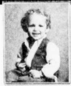
(cadre non compris)

SEARS MC studio de photographie DES MILLIONS DE MAMANS FONT CONFIANCE A SEARS POUR LEURS PHOTOS!