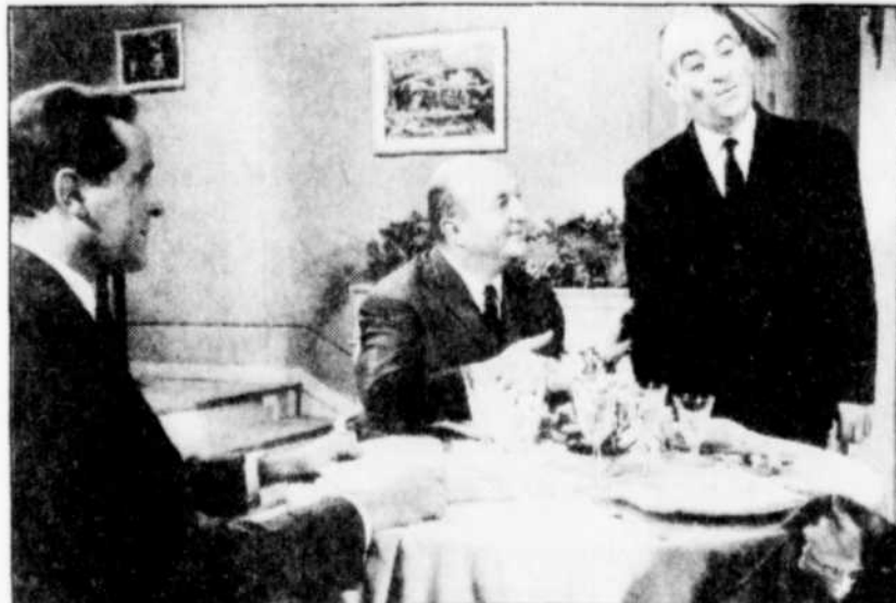
LE FUNESTIVAL présente « Le Grand Restaurant » avec Bernard Blier et Louis de Funes, 20h, à Radio-Canada.