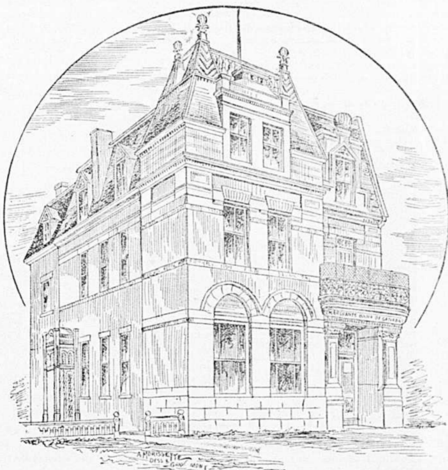
SUCCESSALE DE LA BANQUE DES MARCHANDS, A SAINT-JEROME

années au milieu de la population de Saint-Jérôme.