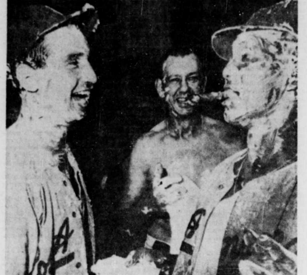
LES ORIOLLES DE BALTIMORE ont peut-être célébré au champagne, mais les Dodgers, avec Wes Covington en tête, ont célébré à la crème à barbe. A gauche, un Sandy Koufax tout heureux et souriant; et à droite, le bouffon Covington.

Mardi, 11 octobre, voyage. Mercredi, 12 octobre, à Los Angeles, si nécessaire. Jeudi, 13 octobre, à Los Angeles, si nécessaire.