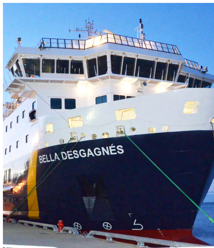
Le Bella Desgagnés de la compagnie Relais Nordik est dans l'obligation d'annuler deux escales qui étaient prévues à Sept-Îles. Les gens qui avaient réservé seront contactés.

aux-Basques. Les travaux de réfection du quai, au coût de 20 M$, devraient s'amorcer cet automne et prendre un peu moins d'un an avant d'être complétés. Le Bella Desgagnés retrouvera alors ses installations.