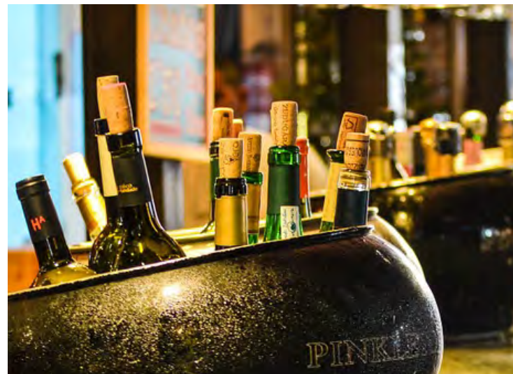
Les Nord-Côtiers consommeraient moins d'alcool dans les bars que la moyenne provinciale.

Puisque la cueillette d'informations se produit pour une première fois, il est impossible d'y apporter des comparatifs et de voir si la légalisation a eu un impact sur la consommation des Nord-Côtiers.