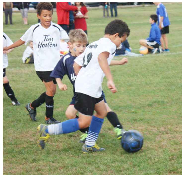
Le Mini Mondial est un festival qui sert de récompense aux jeunes qui ont travaillé très fort durant la saison.

«Ce sont plus de 450 jeunes qui étaient inscrits cette saison, sans