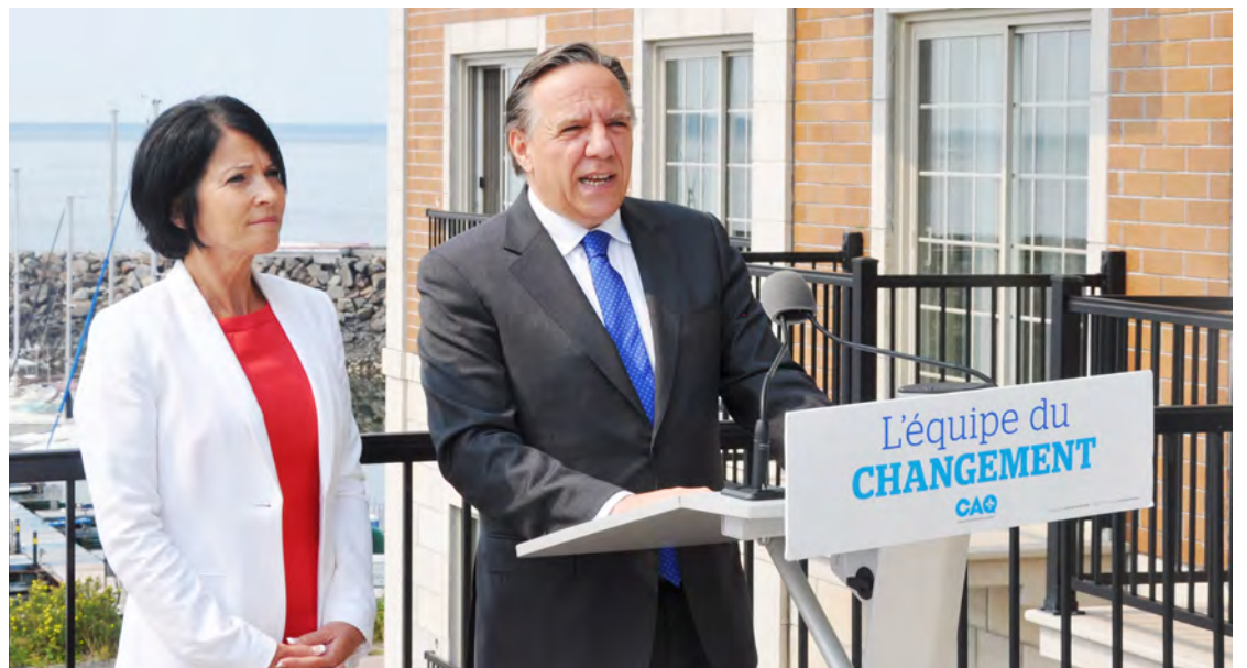
François Legault lors de sa visite à Sept-Îles le 13 août 2018 pour présenter sa candidate Line Cloutier et faire face à la musique concernant son opposition au projet éolien Apuiat.

Line Cloutier, candidate de la CAQ défaite par seulement 127 voix dans Duplessis en 2018, a bien l'intention d'être de retour dans trois ans.