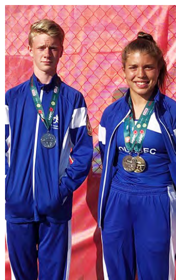
Les athlètes du club d'athlétisme de Sept-Îles ont fait bonne figure au Championnat de la jeunesse de Légion royale du Canada.

«Je me suis préparée physiquement pour cette compétition depuis cet hiver. Nous visions, moi et mon coach, de faire partie de l'équipe du Québec