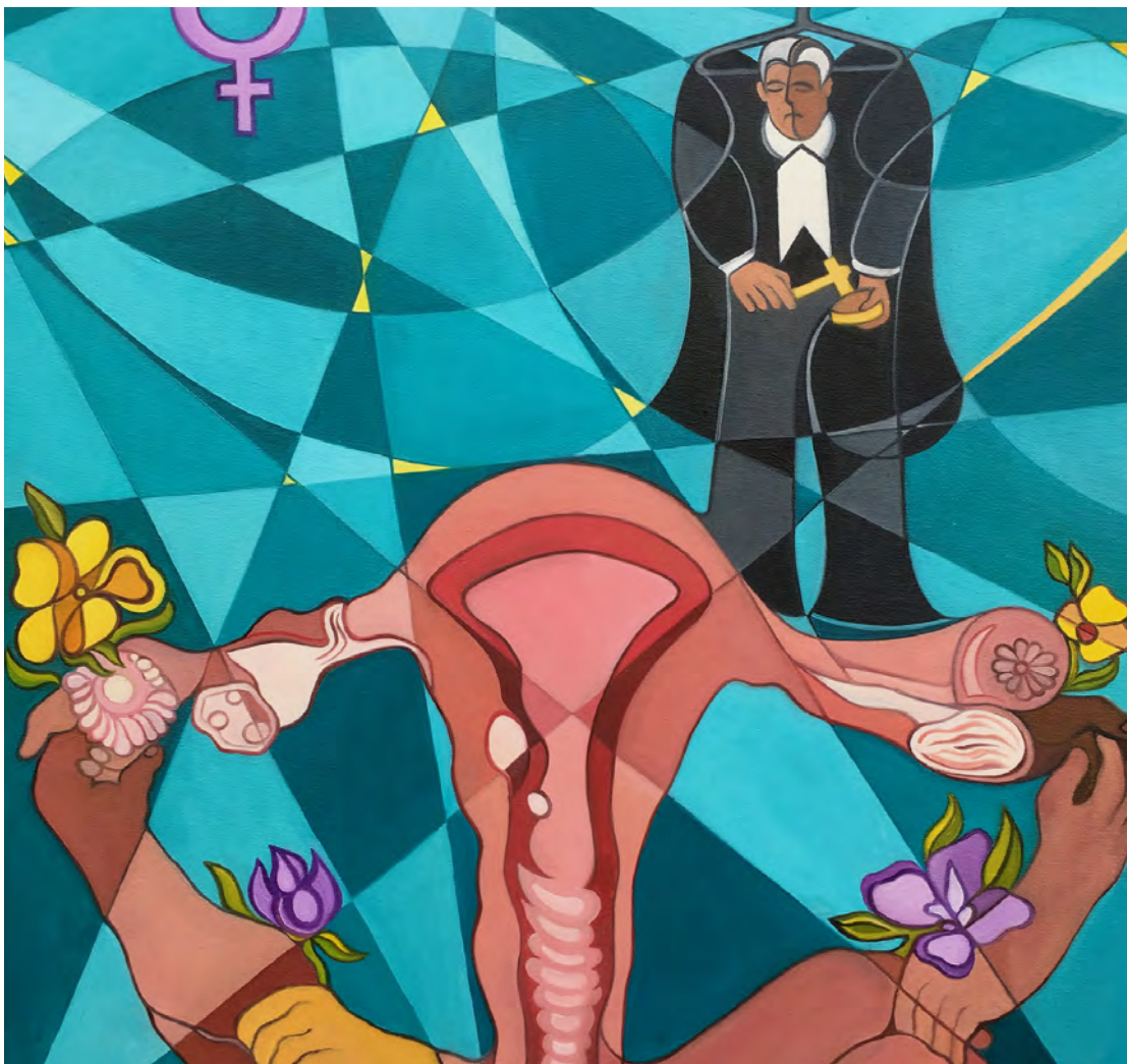
Jugement suspendu , huile sur toile réalisée par le peintre Gabriel Landry afin de revendiquer le droit de la femme à disposer de son corps.

«Mon œuvre est un kaléidoscope dirigé vers un monde sans frontière, un monde de rêve, réfléchissant à l'infini ma passion pour la peinture et la mise en symbole de la pensée et des valeurs humaines», se décrit M. Landry.