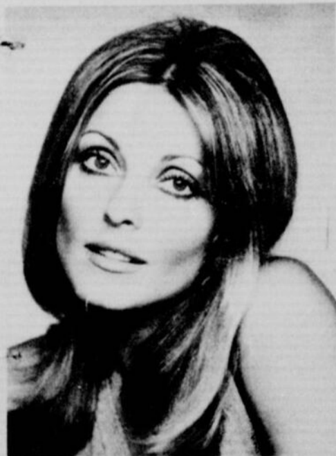
SHARON TATE ...Polansky l'a faite