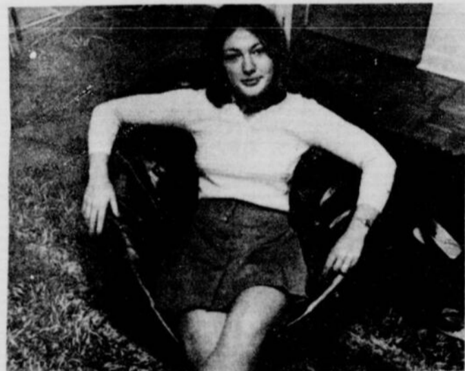
C'est son fauteuil favori. Il lui permet de relaxer tout à son aise. Ce coussin épouse les formes du corps.