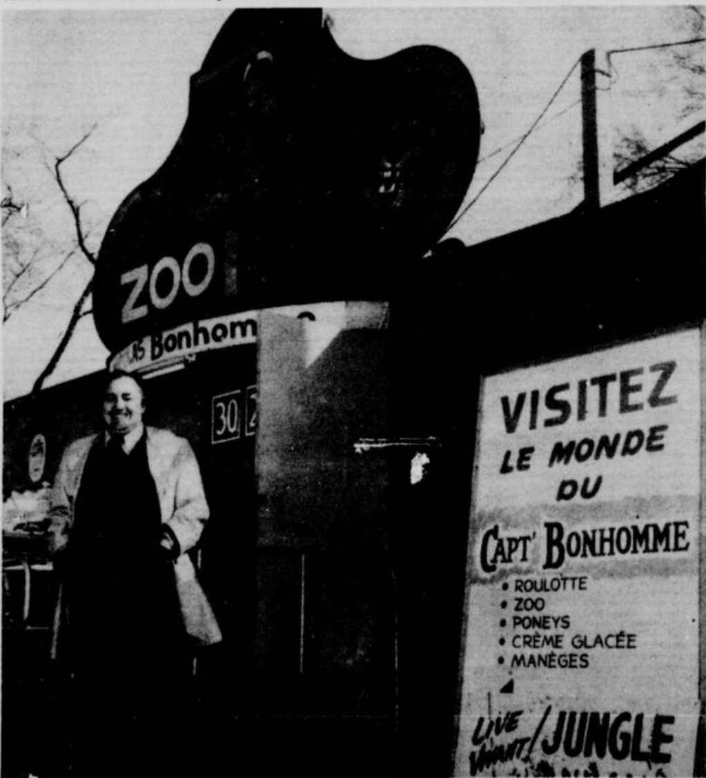
LE ZOO DU CAPITAINE BONHOMME obtient au Parc Belmont un succès extraordinaire: il faut dire que sa ménagerie héberge maintenant une cinquantaine d'animaux.

Nous avons passé un merveilleux samedi au plus vieux parc d'attraction canadien et nous y retournerons parce que "Youpi! le Parc Belmont est ouvert... pour toute la saison!