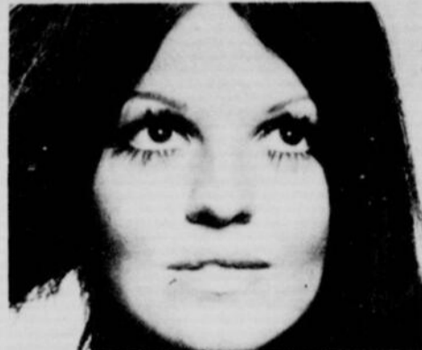
MICHELE RICHARD tue son image pour se donner la vie.

Michèle Richard, pour se défendre contre ce double artificiel mais si vivace, a mérité le Prix Citron dont elle veut être digne toute l'année pour se défendre aussi contre cette ennemie que les journalistes lui ont créée, contre cette vedette de journaux "jaunes". Elle montrera les dents encore. Aussi longtemps que l'on n'aura pas accepté la voie qu'elle a choisie pour continuer la route entreprise il y a 15 ans. Car malgré son jeune âge, Michèle Richard a 15 ans de métier. Et si l'expérience est un atout précieux, une