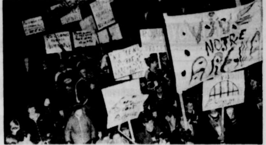
MARCHE ETUDIANTE A ACTON VALE — Groupe d'étudiants et d'étudiantes qui s'est déroulé lors de la marche étudiante organisée en faveur de l'aréna et qui s'est déroulée dans l'ordre le plus parfait. Outre les étudiants et étudiantes d'Acton Vale, on remarquait des représentants des municipalités avoisinantes. Les jeunes brandissaient des pancartes sur lesquelles ils ont inscrit leurs idées.