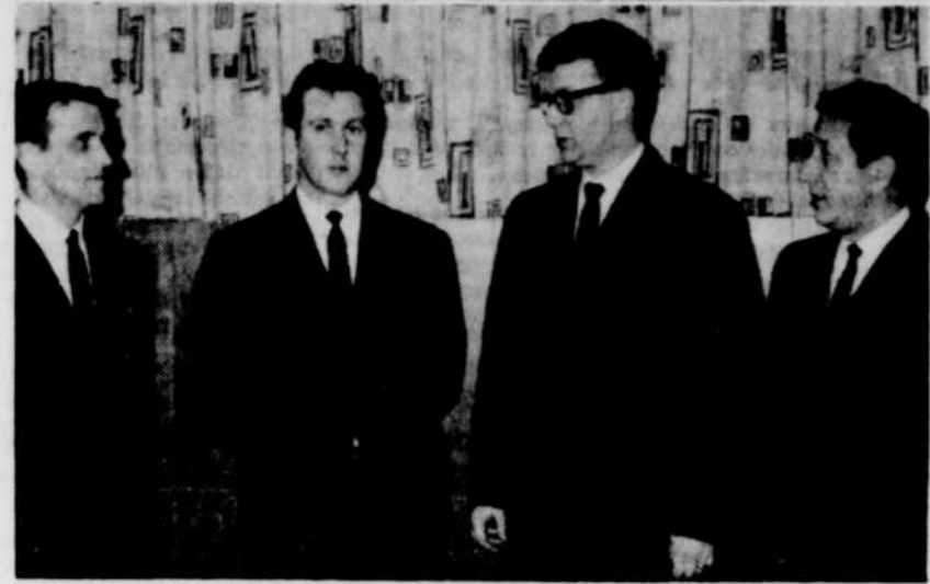
CLOTURE DE LA SEMAINE DE L'EDUCATION — A l'occasion de la clôture de la semaine provinciale de l'éducation, le syndicat des professeurs de l'amiante recevait au banquet donné à la loge des Elans de Thetford de nombreuses personnalités de la Fédération des enseignants du Québec.