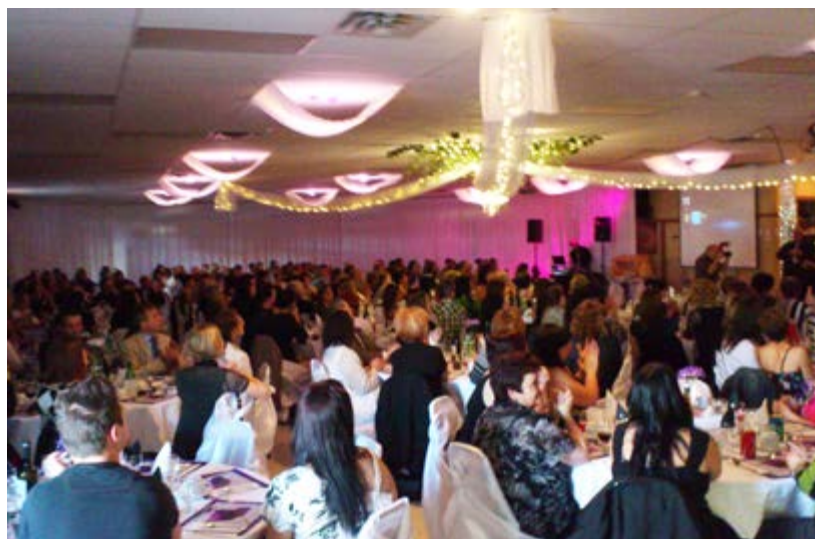
L'enthousiasme des participants était au rendez-vous lors de la 11 e édition du Gala Reconnaissance du CSSS de la Vallée-de-la-Batiscan!

250 personnes sur un potentiel de 450 ont assisté à l'événement haut en couleurs qui se tenait à la salle des aînés de Saint-Tite. Il s'agissait d'une participation record qui a réjoui les organisateurs. Les membres du conseil d'administration agissaient à titre d'hôtes de la soirée pour remercier le personnel de son implication au quotidien dans son travail. Tout avait été pensé afin d'assurer la soirée d'un vif succès.