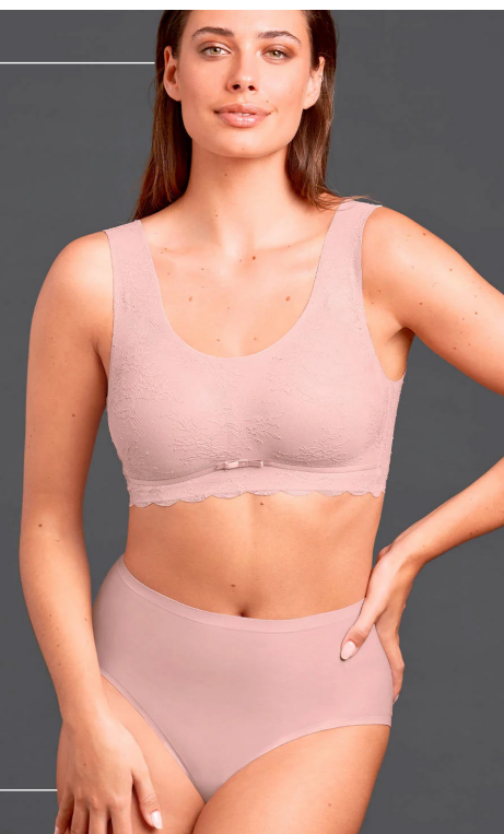
L'Action D'Autray - Mercredi 15 avril 2026 | 3

315, avenue St-Laurent, Louiseville 819 228-9888