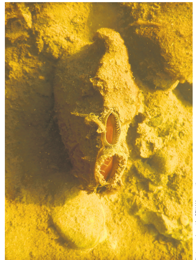
L'obovarie olivâtre passe souvent inaperçue.

de nouvelles pratiques. « Parfois, ça peut leur faire peur! », concède M me Dubois-Gagnon. « Ils se demandent s'ils doivent changer toutes leurs cultures ou leur mode de production, mais ce n'est pas le cas puisque nous proposons des actions graduelles. Nous voulons vraiment que ce soit durable sur le long terme pour eux. »