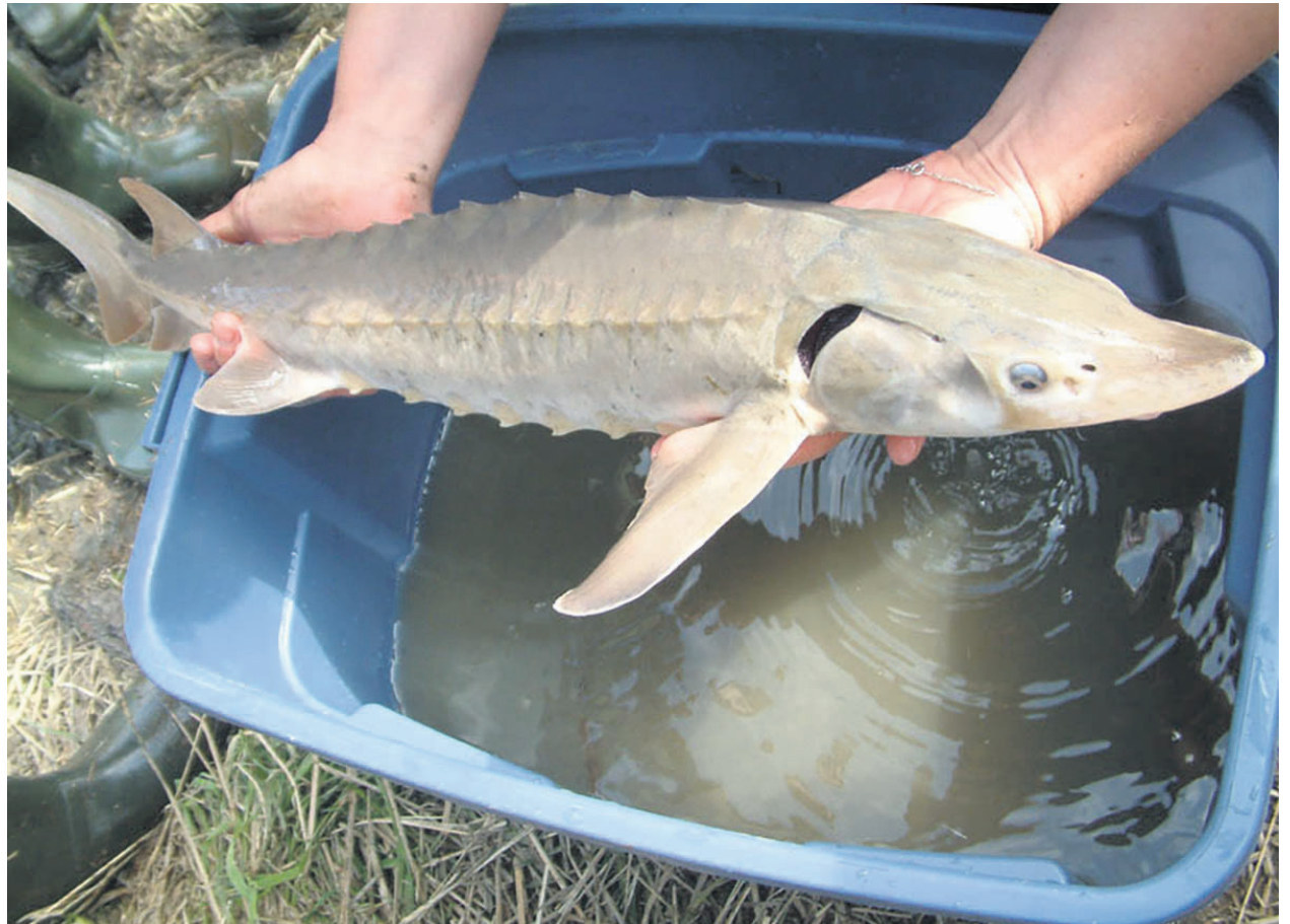
L'esturgeon jaune fait partie des espèces vulnérables.

L'organisme n'a pas perdu de temps afin d'agir pour venir en aide à ces espèces. Il a déjà procédé à la restauration de bandes riveraines au courant de l'année dernière, près de la ville de L'Assomption. Les autres actions consisteront à la réalisation d'inventaires et de suivis écologiques, ainsi qu'à la stabilisation de berges sensibles à l'érosion. Pour cette dernière mesure, l'équipe de l'OBV L'Assomption s'affaire à reprofiler la rive et à rendre la pente plus douce.