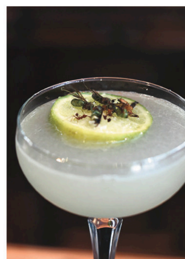
Le restaurant sert aussi des cocktails agrémentés de fourmis.

Mais l'engouement des chefs en Occident pour les in-