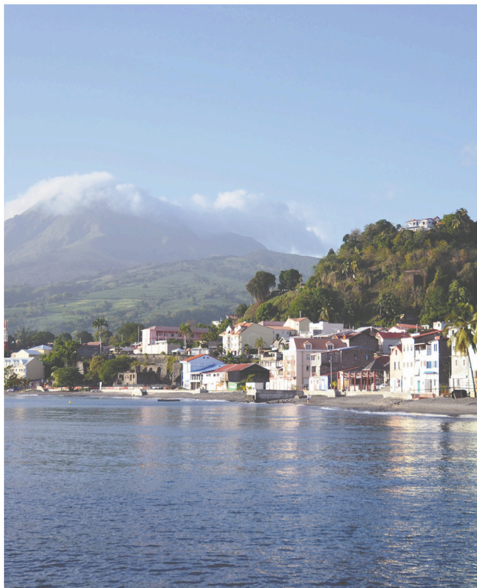
Le tour du cratère de la montagne Pelée, une randonnée que l'on entame dans la commune de Morne-Rouge, à 1397 mètres d'altitude, réserve des panoramas grandioses.

Explorer une page d'histoire peu connue de la Caraïbe, sur les contreforts de la montagne Pelée