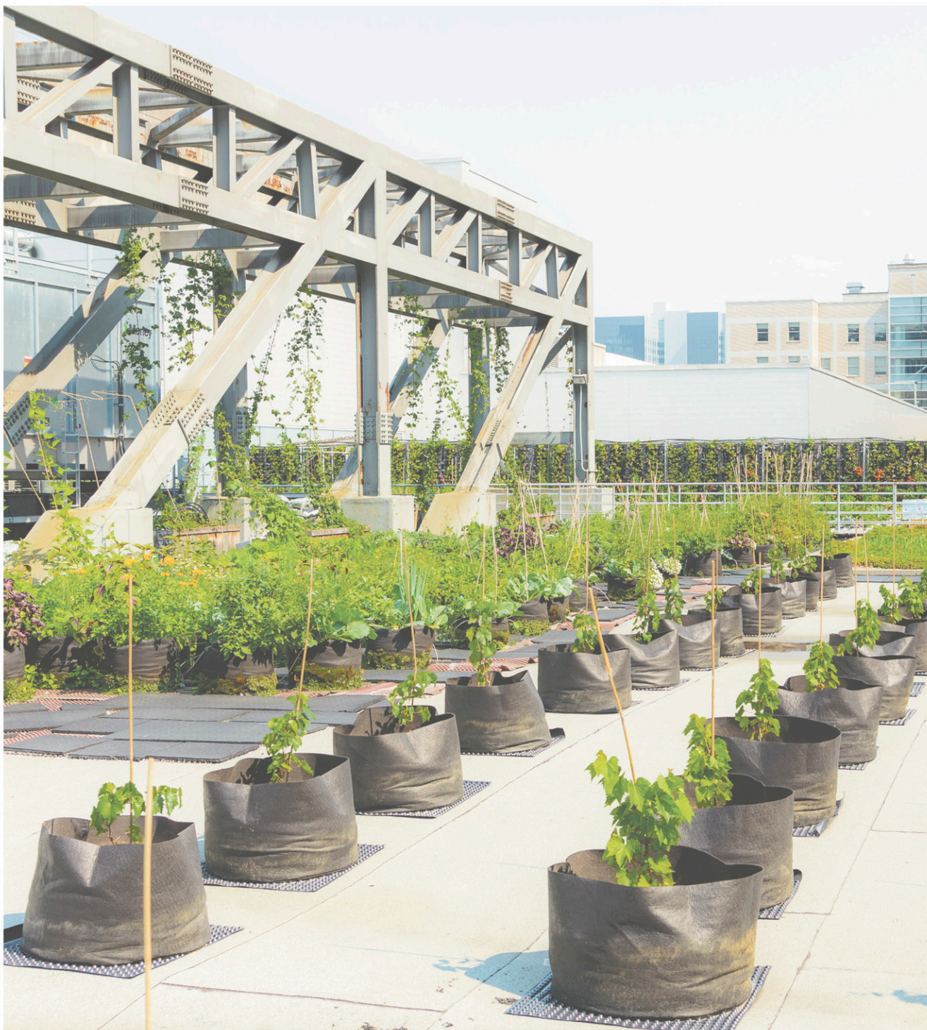
PALAIS DES CONGRÈS

Le Palais des congrès a inauguré en août la quatrième phase du Laboratoire d'agriculture urbaine sur son toit, les vignes urbaines.