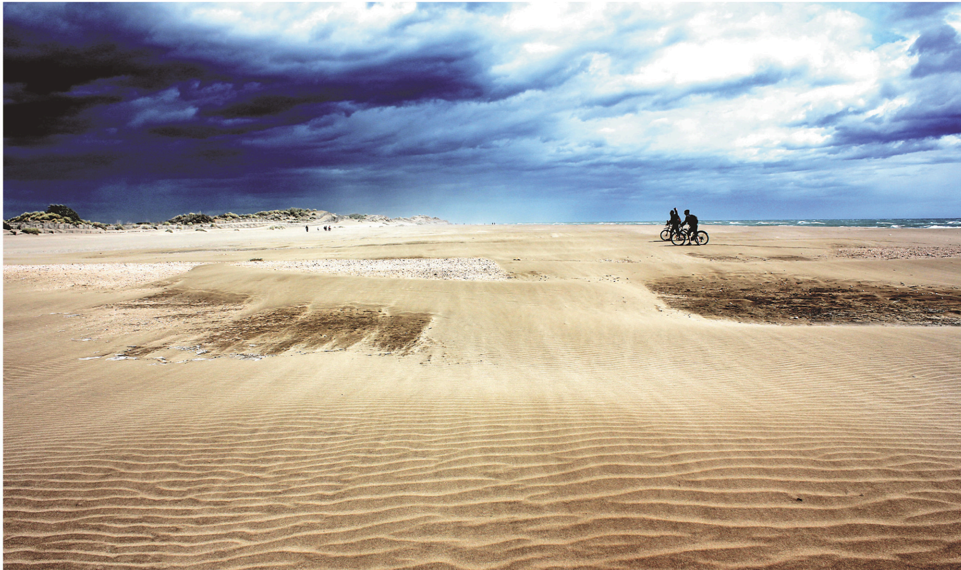
Un temps automnal plus que tonique à l'Espiguette, une plage du Gard, dans le sud de la France, qui est tellement plus invitante en... juillet!