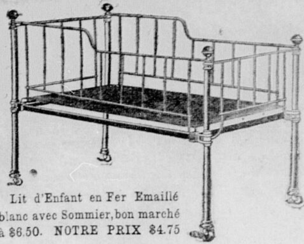
Lit d'Enfant en Fer Emailé blanc avec Sommier, bon marché à $6.50. NOTRE PRIX $4.75

CROWN FURNITURE CO. 68, rue de la Couronne, QUEBEC.