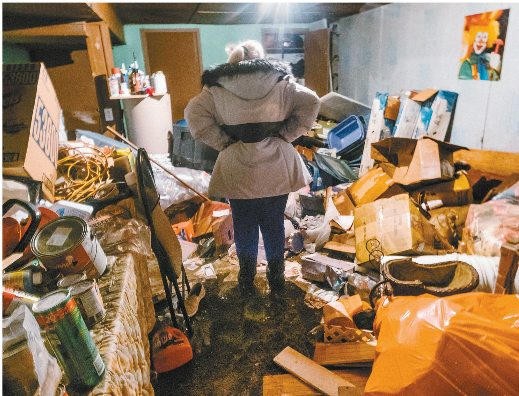
Une amie de Jocelyn Vandal, l'un des sinistrés de Québec, constate les dégâts au sous-sol de la demeure inondée.