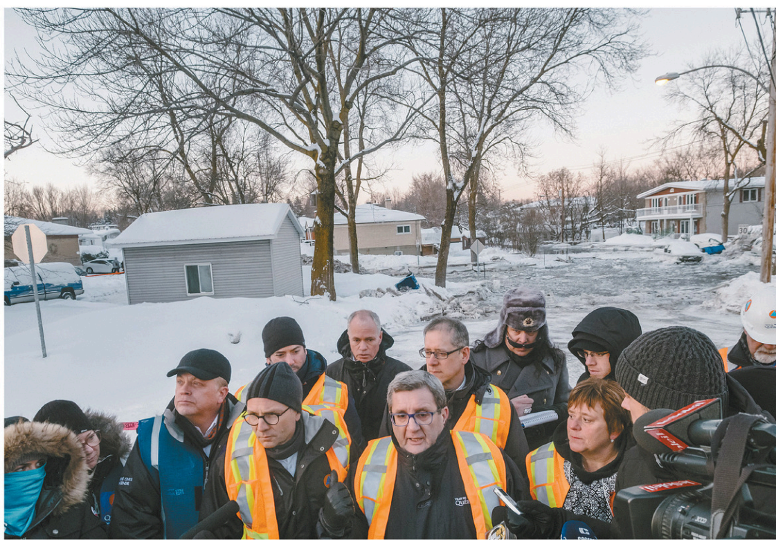
RENAUD PHILIPPE LE DEVOIR

Le risque d'une nouvelle inondation en aval dans le secteur de la rue Masson n'était d'ailleurs pas écarté lundi. Or, personne n'avait été évacué parce que, si ça s'avérait, cela ne serait pas subit, a-t-il précisé.