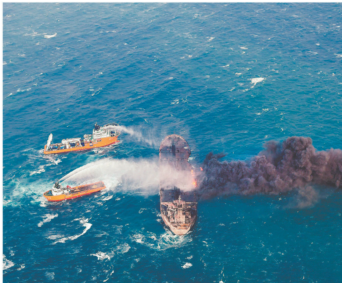
Des navires chinois essayant d'endiguer l'incendie sur le Sanchi le 11 janvier dernier. Le pétrolier a finalement sombré dans la mer dimanche, ne laissant aucun survivant.

« Vu le mauvais état de la coque après une semaine d'explosions et d'incendie, il est probable que tous les réservoirs aient été endommagés et que tous les condensats ainsi que le carburant se soient déversés », explique-t-il à l'AFP. Même si seul un cinquième de la cargaison