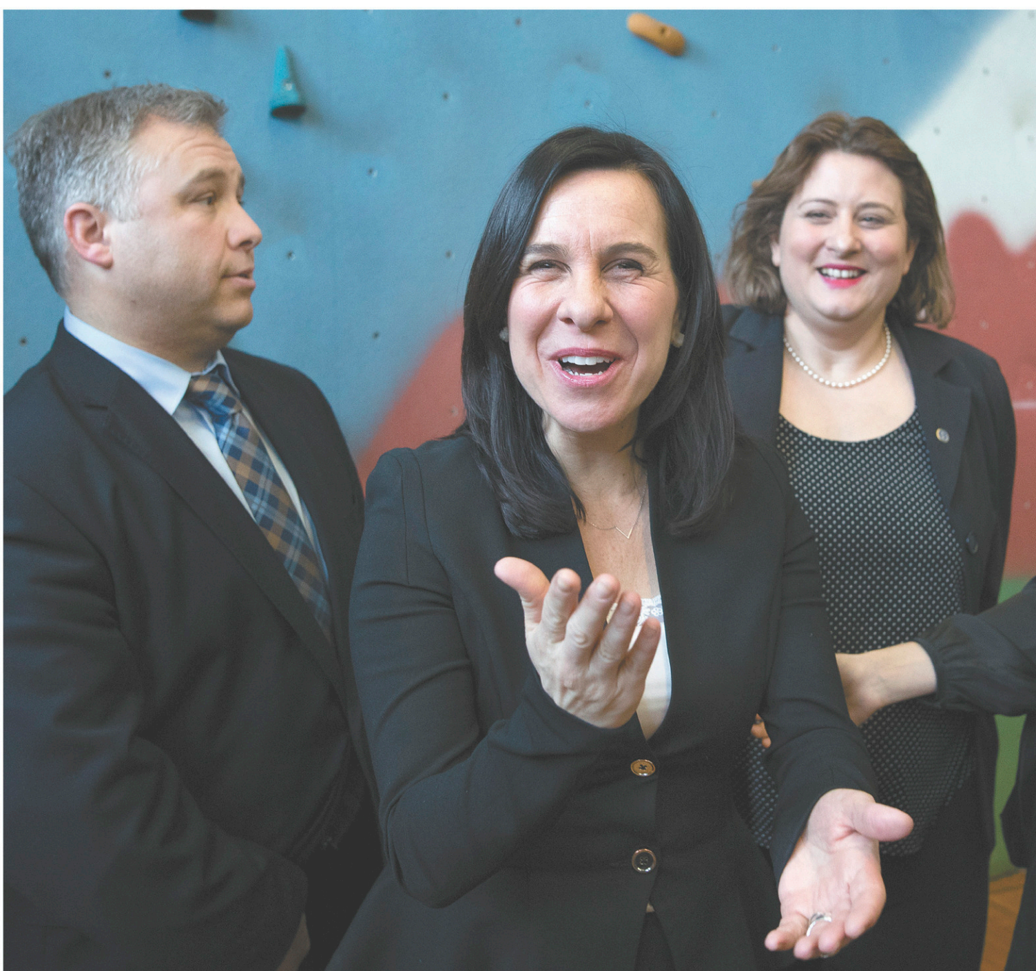
La nouvelle mairesse de Montréal, Valérie Plante, reconnaît que « les besoins des écoles montréalaises sont grands » et entend collaborer avec Québec et la CSDM pour trouver des solutions au problème de rareté des terrains pour la construction des nouvelles écoles.