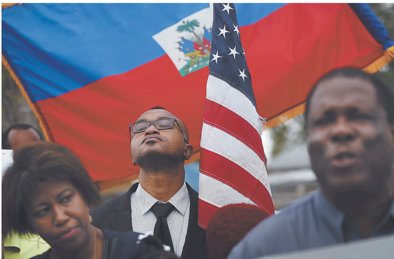
Au-delà de sa majesté, l'histoire d'Haïti est surtout belle.