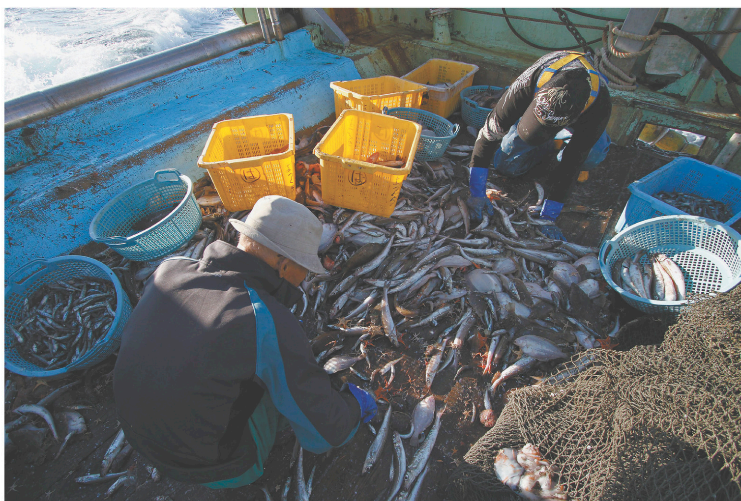
La pêche électrique est interdite en Europe depuis 1998, mais elle bénéficie cependant de dérogations depuis 2007, à titre expérimental.

Pour ses partisans, cette technique permet surtout de