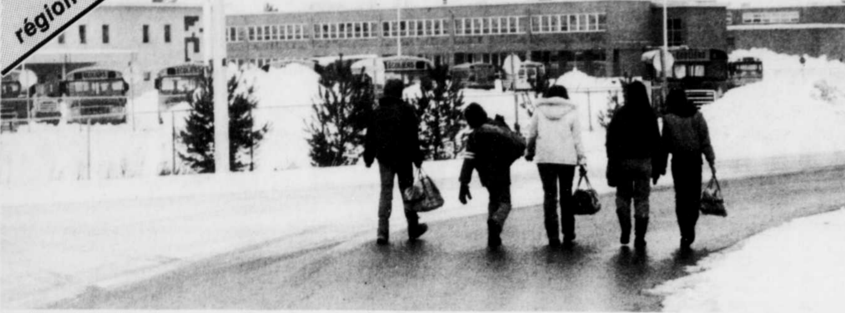
Les élèves du Triolet qui sont retournés en classe ce matin, pour la première fois depuis trois semaines, se sont retrouvés sans professeur pour leur dispenser des cours.