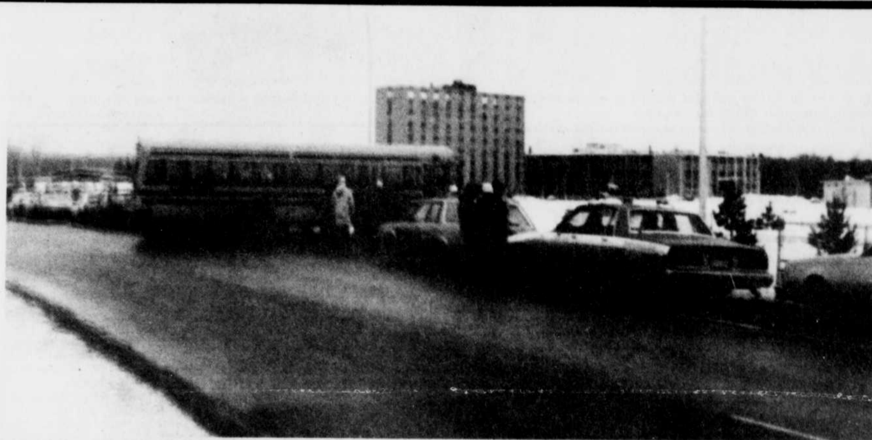
Les "haies d'honneur" formées par les enseignants n'ont pas empêché les autobus scolaires de passer.