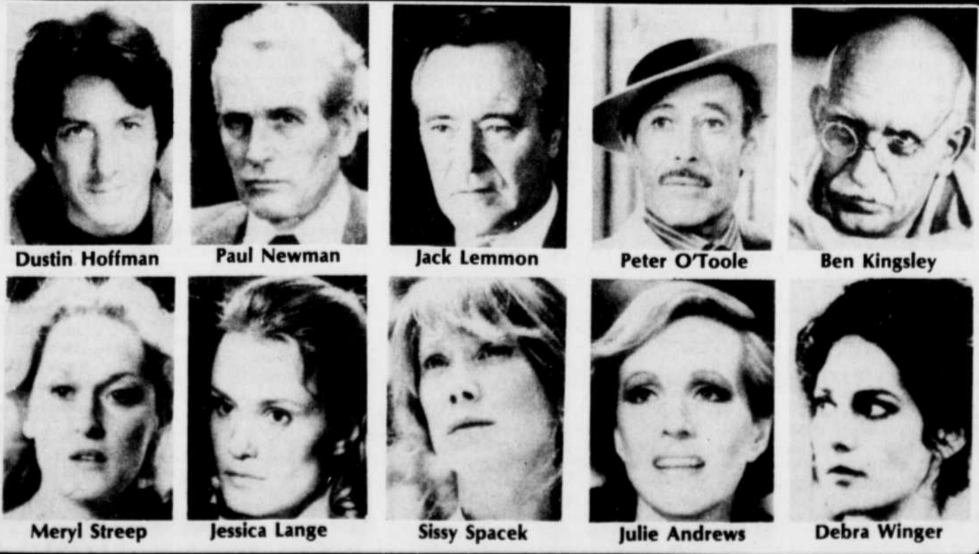
Dustin Hoffman Paul Newman Jack Lemmon Peter O'Toole Ben Kingsley Meryl Streep Jessica Lange Sissy Spacek Julie Andrews Debra Winger