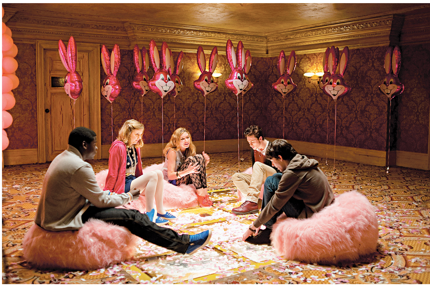
Chatroom, du Japonais Hideo Nakata