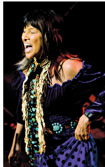
Buffie Sainte-Marie

À Rouyn-Noranda, Ville-Marie, Val-d'Or, La Sarre et Amos, du 22 au 30 mai. Renseignements: 819 797-8288, 1 877 997-8288