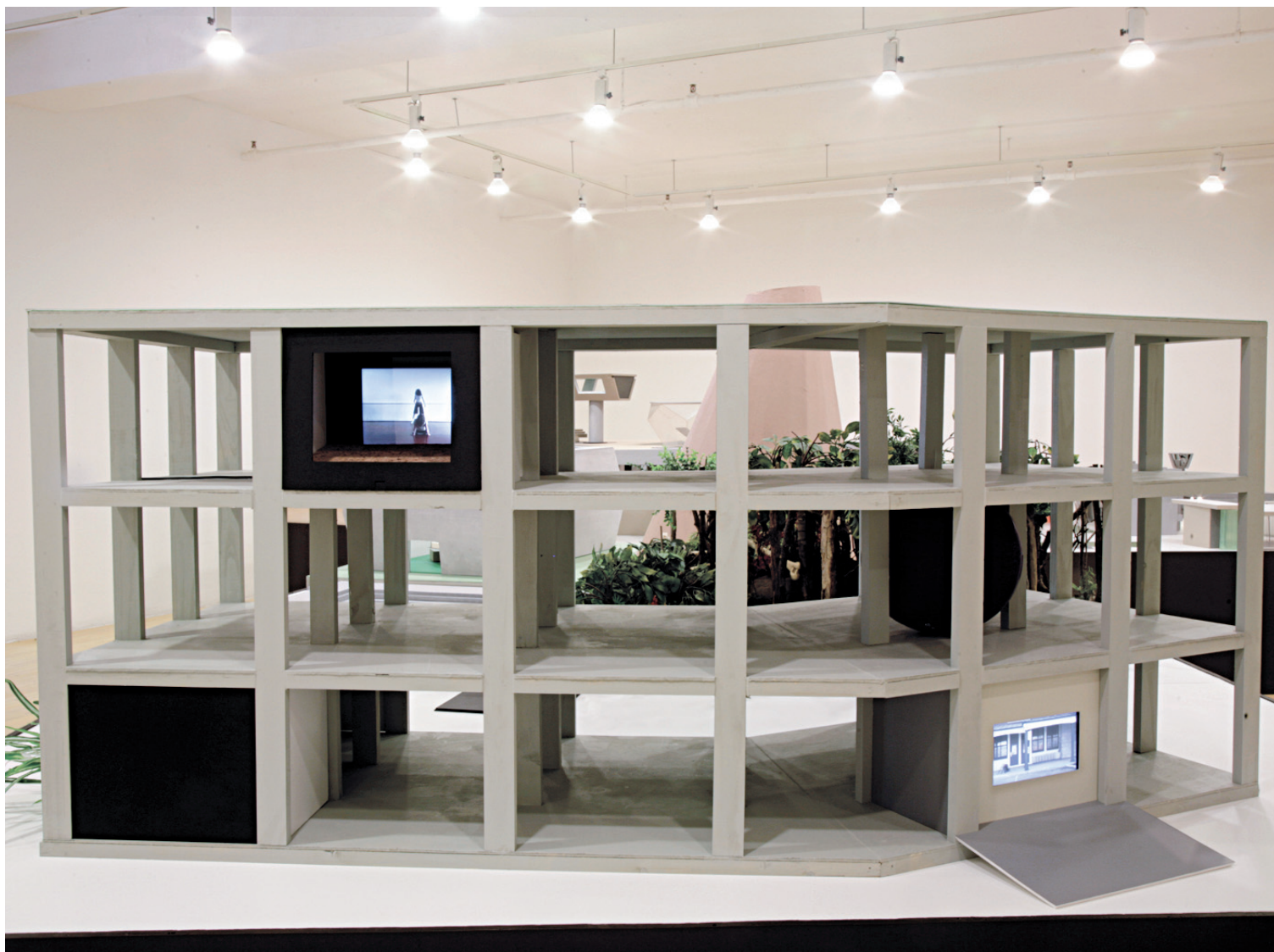
Une des maquettes de Stéphane Gilot

En fait, Gilot, en cette seule œuvre, s'offre une sorte de rétrospective, de bilan. La cité