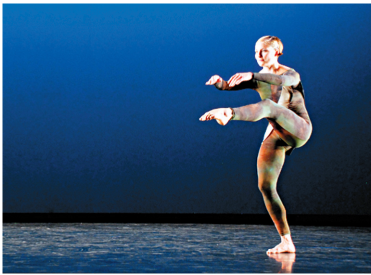
Scène de Nearly 90 2