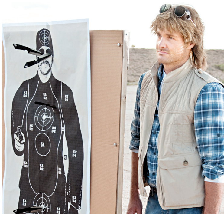
Will Forte dans le rôle de MacGruber