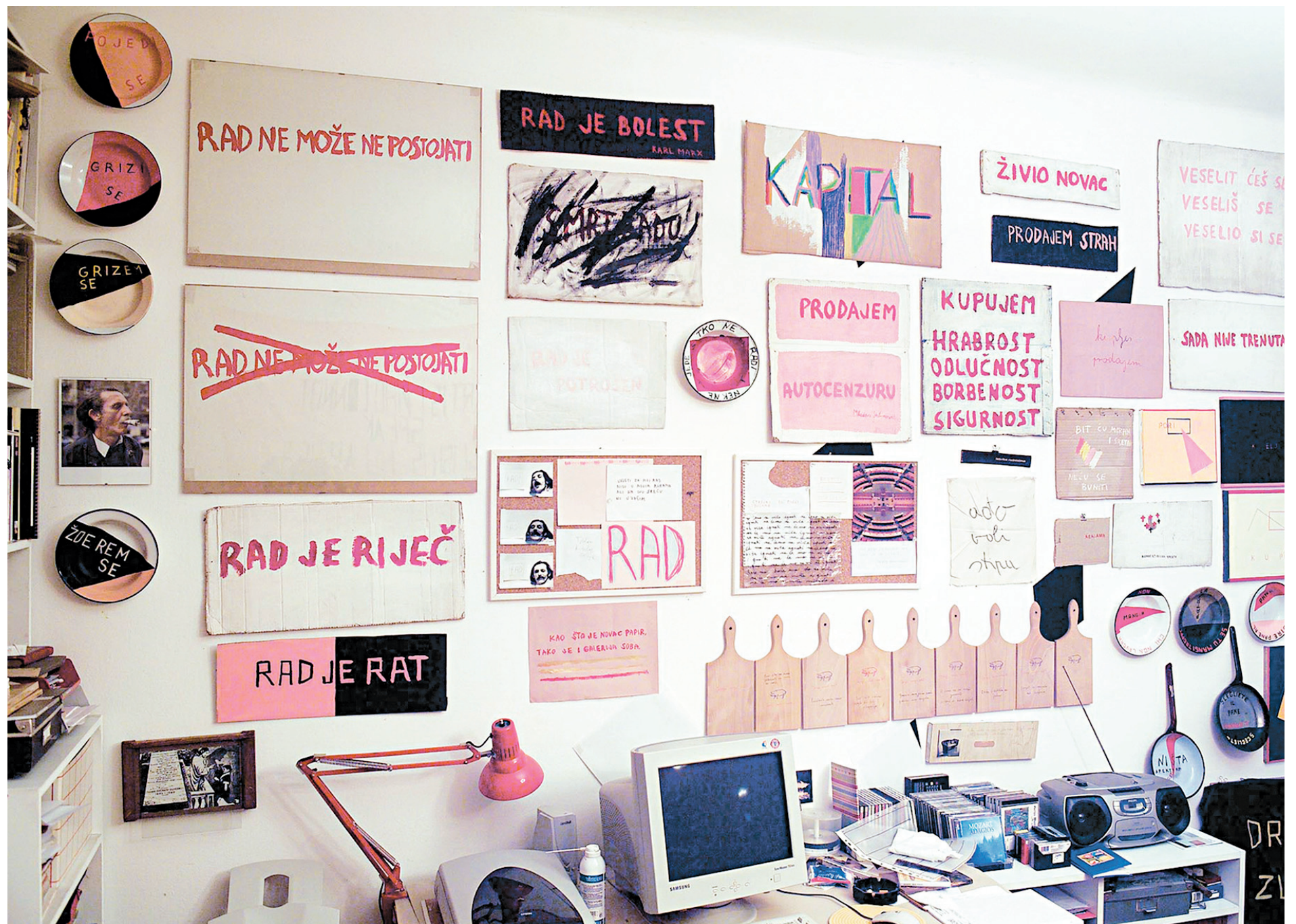
Vue d'installation, atelier de l'artiste, Ljudevita Ppsavskog 9, Zagreb, 2004, de Mladen Stilinovic

Né à Belgrade en 1947, Mladen Stilinovic vit à Zagreb depuis les années 1960. C'est là qu'il a amorcé sa pratique dans les années 1970, participant notamment au Group of Six Artists dont les «expositions-actions» prenaient l'espace urbain comme théâtre d'interventions. Dans sa pratique personnelle, l'artiste a aussi mené un travail conceptuel privilégiant les processus au détriment de l'objet fini. De là la modestie des matériaux mobilisés par l'artiste dans ses travaux, les images trouvées et le caractère rafistolé des œuvres bidimensionnelles. En 2007, signe d'une reconnaissance toujours vive et d'une pertinence renouvelée de son travail, il exposait à la Documenta de Kassel. Dans les conteneurs à la base de son