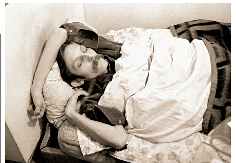
Artist at Work (détail), 1978, épreuve à la gélatine argentique, de Mladen Stilinovic

En collaboration avec Club Voyages Rosemont