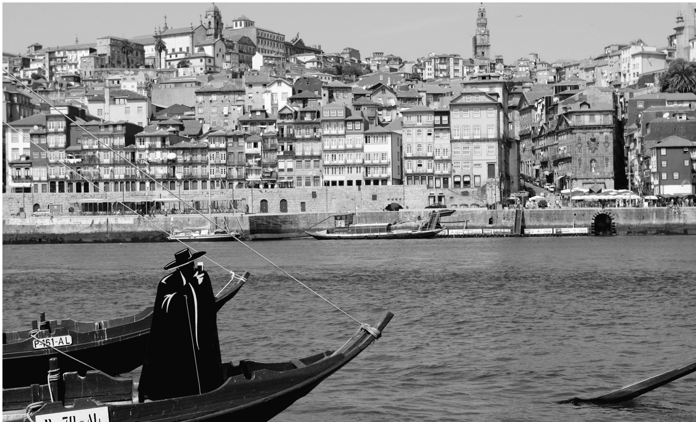
Une vue générale de la ville de Porto, au Portugal.

Il y a tant de touristes à Venise qu'il est impossible de trouver un resto sans visiteurs étrangers. Et nombre d'Italiens sont aussi des touristes, car étrangers à la Sérénissime. Les mois à éviter pour échapper à la cohue sont juillet et août, ainsi que la période du carnaval.