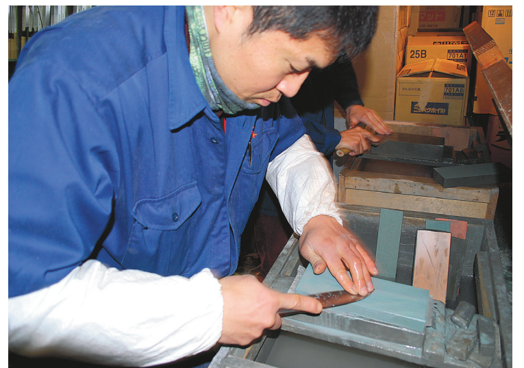
Les fameux couteaux japonais sont reconnus dans le monde, tant pour la qualité de l'acier que pour l'art d'affûter les lames.

par les différents ordres de gouvernement ont porté leurs fruits. Québec investit depuis plusieurs années dans le produit, tout comme Agriculture