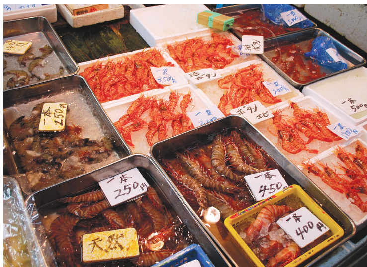
Le marché Tsukiji à Tokyo est le plus grand marché de poisson au monde, et aussi le plus visité.