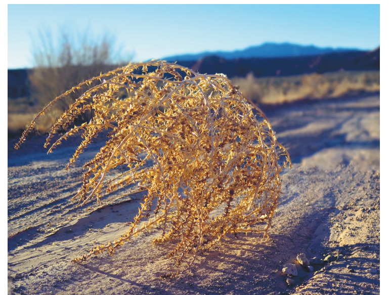
Le virevoltant, cette boule errante typique des paysages arides et bien prisée pour les westerns, est omniprésente sur les routes désertiques du Nevada.

Le voyage en voiture sur les grandes routes solitaires du Great Basin, au cœur d'un désert rustique parsemé d'armoises, d'arbres rabougris, de cactus, de genévriers, et dominé par des montagnes aux sommets enneigés, vaut vraiment le coup