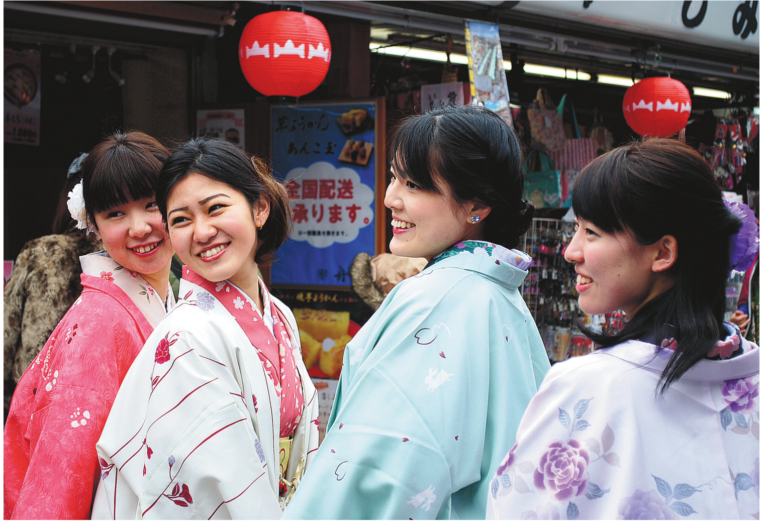
Les Japonais sont un peuple très raffiné et portent une grande attention à leur tenue vestimentaire.

Terroir Québec en ligne promet depuis 10 ans les produits agroalimentaires québécois et favorise leur commerce en ligne. La société propose un choix incroyable des meilleurs produits issus du Québec. terroirsquebec.com .