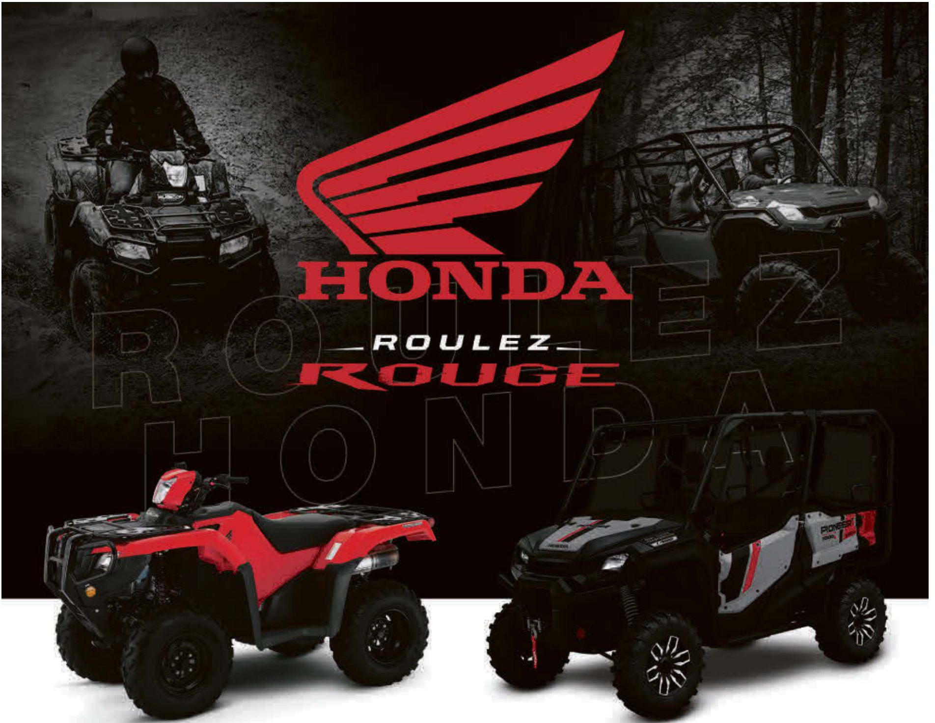
RUBICON DCT IRS EPS 2023