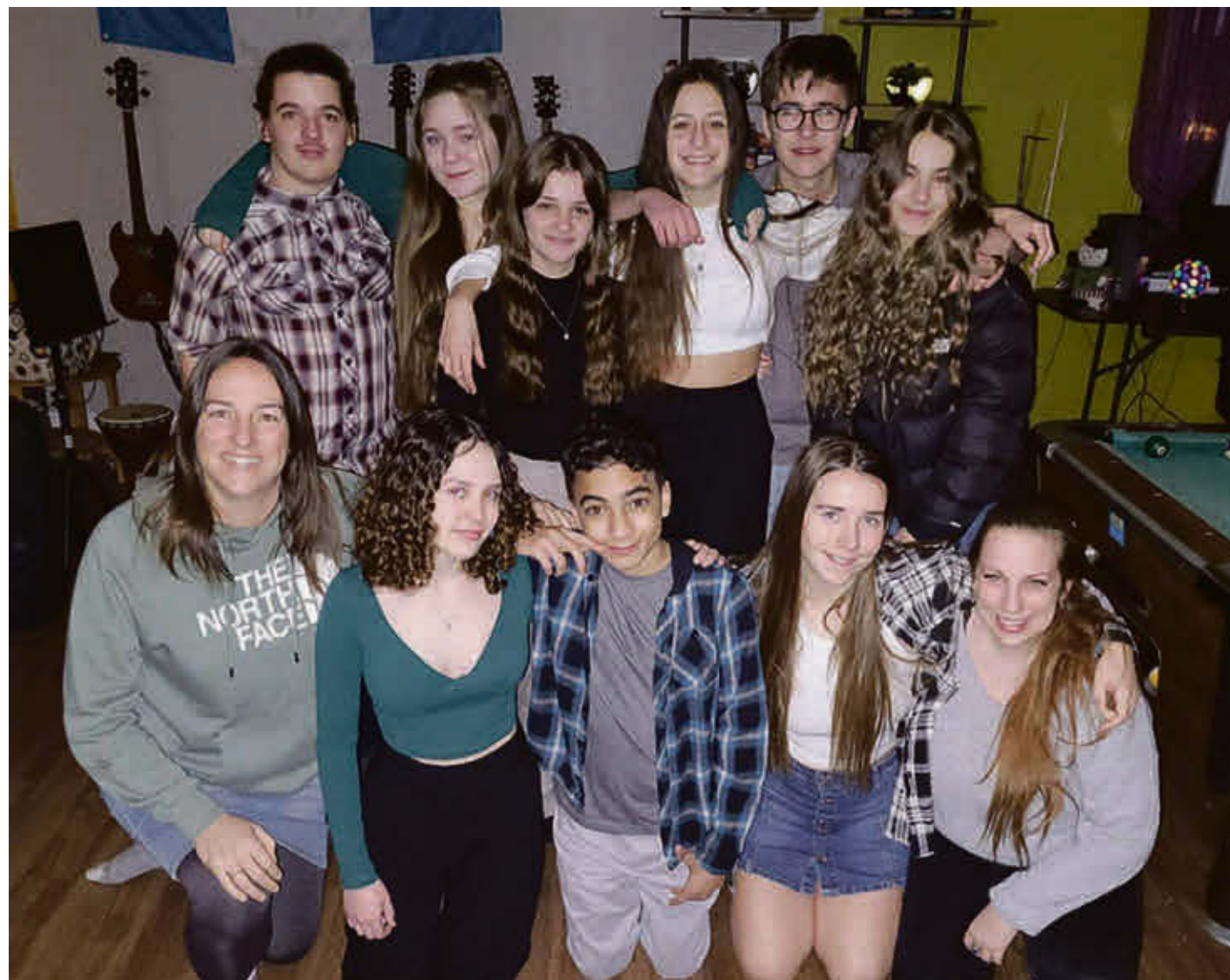
Neuf jeunes et 2 intervenantes de la Maison des jeunes de Wickham s'envoleront pour l'Équateur de 29 juin au 12 juillet.

Pour suivre les jeunes dans leur préparation et en savoir plus sur les activités de financement, vous pouvez consulter la page Facebook Medje Wickham.