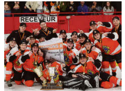
Les Lions d'Acton Vale ont remporté les grands honneurs de la 52 e édition du Tournoi M18 d'Acton Vale.