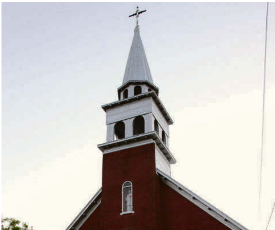
L'église de Lawrenceville.

Les entrepreneurs devront aussi faire de la finition, procéder à des travaux d'électricité et de plomberie ainsi que rénover l'escalier extérieur. Les entreprises intéressées ont jusqu'au 28 février à 15 h pour adresser leur soumission. Les travaux devront être réalisés entre le début du mois de mars et la fin du mois d'avril.