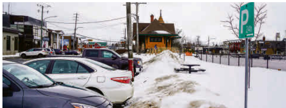
Près d'une cinquantaine de places de stationnement sont disponibles un peu partout dans la Ville d'Acton Vale.

Rappelons que l'interdiction de stationner son véhicule en période hivernale prendra fin le 1 er avril.