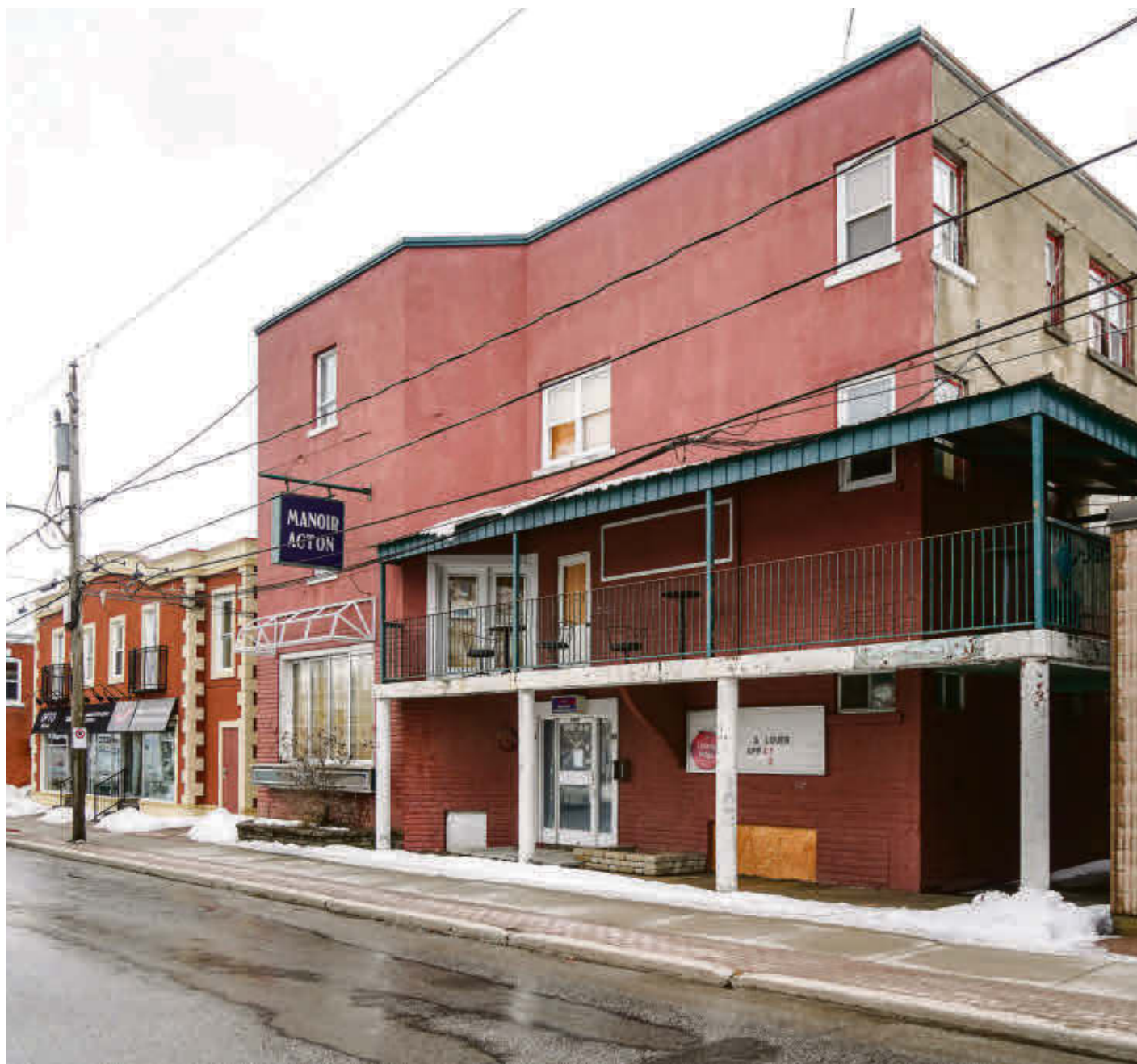
Délabré, le Manoir Acton situé sur la rue Dubois n'est plus en activité depuis quelques années.

Le tout a été racheté pour une bouchée de pain par une société à numéro dont l'une des actionnaires principales est Roxanna Carcamo, propriétaire de la bou-