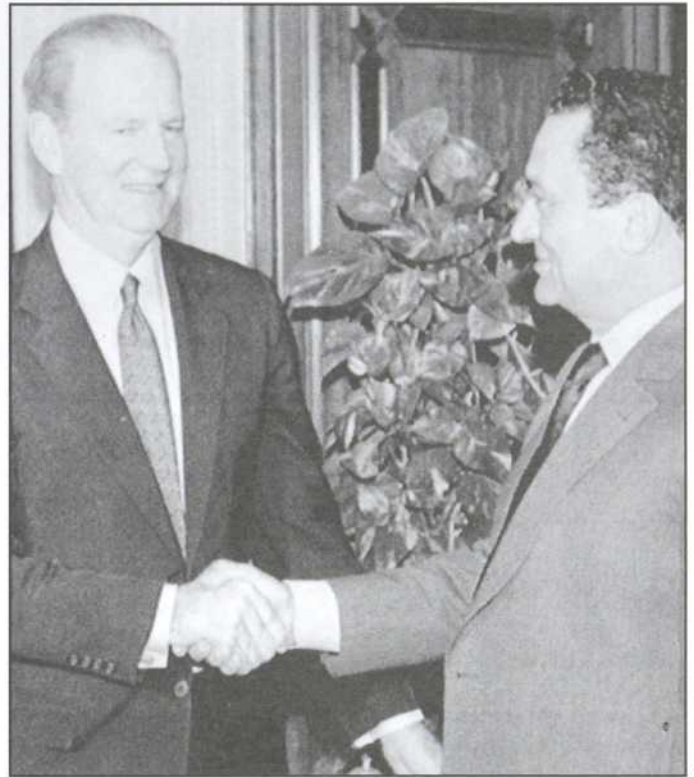
Dans toutes les capitales arabes, ce sont les intérêts politiques américains que va défendre le secrétaire d'État, M. James Baker.

Entre temps, Israël peut faire venir des Juifs soviétiques, qui sont maintenant efficacement empêchés de venir aux États-Unis par une législation conçue pour les priver du libre choix. À l'heure actuelle, l'immigration se tarit à mesure que les immigrants potentiels apprennent les sérieux problèmes de logement et d'emploi qui les attendent. Mais si les États-Unis en fournissent les moyens, l'afflux des immigrants pourrait bien reprendre de plus belle, rendant les enjeux diplomatiques assez