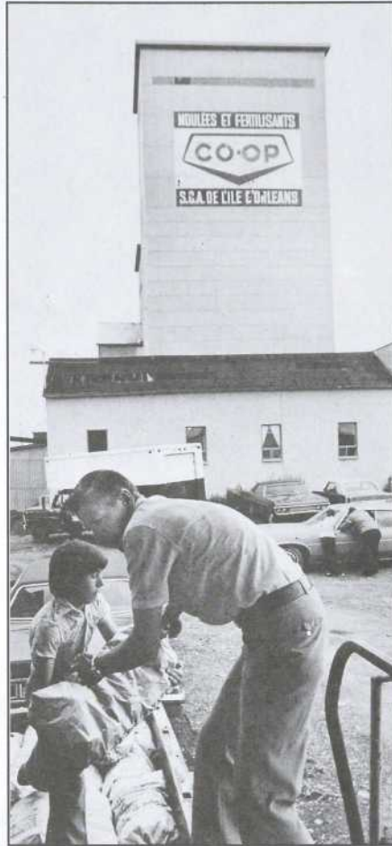
Alain Vézina/Mouvement Desjardins

L'expérience des coopératives agricoles illustre malheureusement trop bien les conséquences économiques et sociales du conflit syndicat-coop qui se livre à l'intérieur de chaque coopérateur 2 . En