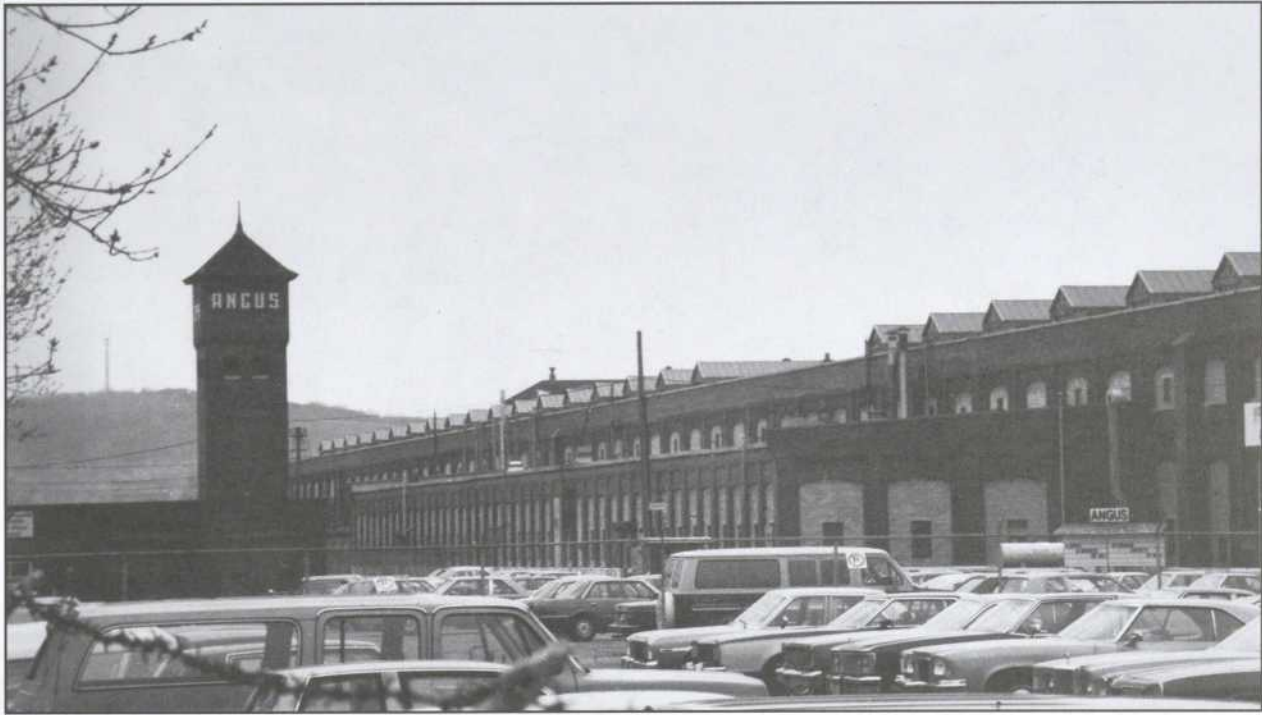
La réduction du déficit budgétaire et le libre-échange ont été les deux grandes priorités économiques du gouvernement fédéral : dans les deux cas, les résultats se font attendre. En attendant, les usines, comme celles d'Angus, ferment leurs portes.

moins d'impôts payés) et la progression des dépenses de soutien à l'économie ont immédiatement creusé le déficit. Cette hausse du chômage peut à son tour être liée à plusieurs facteurs : les récessions successives de 1975, 1980 et 1982, la poursuite de politiques économiques restrictives, faisant de la lutte à l'inflation la priorité, mais aussi le déclin de certains secteurs économiques traditionnels.