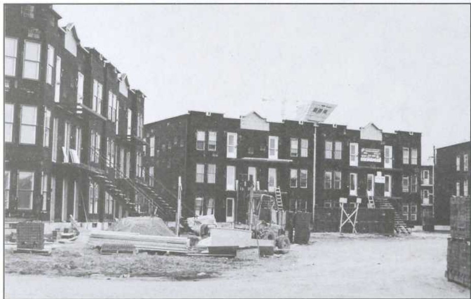
Fédération des coopératives d'habitation de l'île de Montréal

La formule vise des clientèles hétérogènes, composées de ménages de faible et de moyen revenus 2 , évitant ainsi la formation de ghettos. Au Québec, 86 % des ménages habitant des coopératives d'habitation disposaient, en 1987, de revenus inférieurs à 28 000$ 3 . Les coopératives ont aussi un rôle social important. Selon Statistique Canada (recensement de 1986), les chefs de familles monoparentales, les femmes de plus de 55 ans, les immigrants récents et les personnes ayant besoin d'un logement adapté sont des groupes sur-représentés dans les coopératives d'habitation 4 . Ces organisations permettent ainsi à des individus