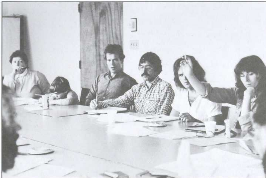
Fédération des coopératives d'habitation de l'île de Montréal

...mais des personnes, des individus, des familles, des enfants ! Vivre dans une coopérative, c'est vouloir se donner une meilleure qualité de vie en participant directement à toute une gamme de décisions : des aménagements communs à l'appui à d'autres groupes.