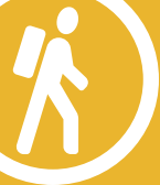
TABLEAU DES SENTIERS