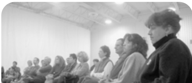
Vers le Pacifique : tolérance et compréhension.

Le programme a été adapté aux besoins de notre système scolaire par le Centre Mariebourg, un organisme communautaire de Montréal-Nord spécialisé dans l'émergence des problèmes psychosociaux chez les jeunes. Lancé en 1998, le programme Vers le Pacifique a connu un tel succès que, dès l'année suivante, le Centre Mariebourg a mis sur pied un nouvel organisme qui en sera responsable : le Centre international de résolution de conflits et de médiation de Montréal. Aujourd'hui, le CIRCM se consacre uniquement à la cause de la médiation; il tente de rendre ses outils et ses méthodes d'intervention accessibles à toutes les communautés du monde scolaire et à la société en général.