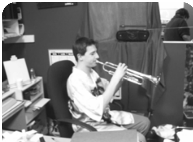
Le Café encourage la création artistique.

Le Café Graffiti a pour mission d'aider les jeunes qui ont décroché de la société à tous les niveaux et qui sont dans le besoin. L'organisme encourage la création de projets d'expression artistique pour amener les jeunes à réintégrer la société, à retourner aux études, à envisager une carrière artistique ou à se trouver un autre type d'emploi. De plus, il offre un soutien personnel aux jeunes qui sont aux prises avec des problèmes de drogue, de santé, de logement, de budget ou autres.