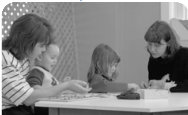
Le « répit-gardiennage » est un service offert par la Maison de la famille de la Petite-Nation.

Même si l'objectif principal est de réduire l'isolement social, les intervenants de la Petite-Nation savent qu'en abaissant le niveau d'anxiété et de stress des parents, ils préviennent par le fait même la négligence et les abus