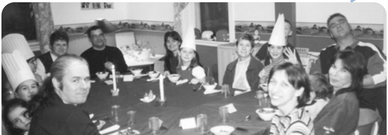
Une maison pour se parler, s'épauler et se changer les idées.