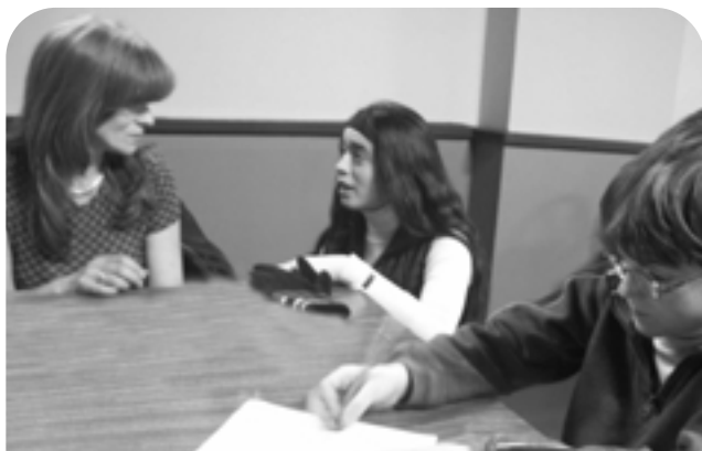
Au Café Graffiti, la conciliation famille-travail est une réalité quotidienne.

à réaliser plusieurs contrats qui peuvent aller de l'animation lors de festivals ou autres manifestations à la construction des décors pour le spectacle de Bruno Pelletier à la Place des Arts. Les jeunes acquièrent ainsi une expérience de travail et ils doivent apprendre à gérer un budget, puisqu'ils sont payés pour le travail qu'ils font.