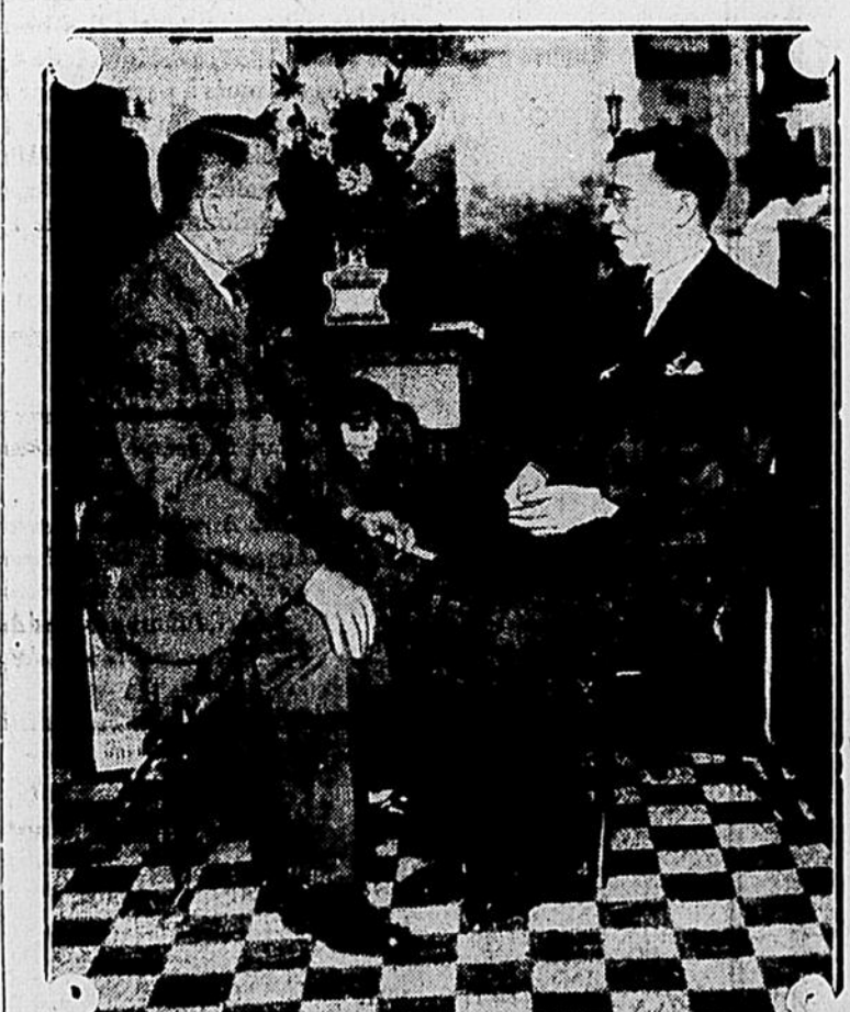
Ses yeux voient après 22 ans d'infirmité. Un médecin de l'Université de Pennsylvanie vient de greffer avec succès sur un œil aveugle une pupille nouvelle. Le patient voit maintenant.

L'on apprend qu'une importante compagnie anglaise est prête à dépenser $100,000,000 pour l'utilisation des gaz de la Valcké Turner. Elle construira une immense usine où elle tirera parti des millions de pieds cubes de gaz qui sont aujourd'hui perdus.