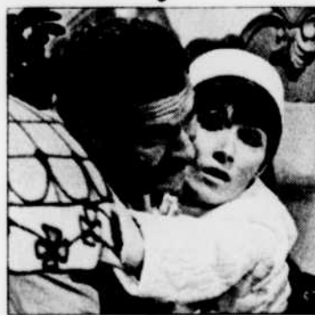
«Les Martin» de Richard Pérusse, JEUDI à 22 h 15.