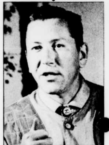
Serge DEYGLUN, à «Pas si bêtes, les bêtes» à 14 h 40.