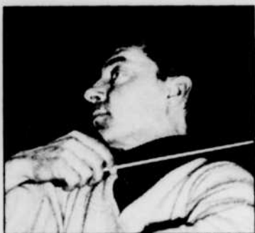
Herbert VON KARAJAN

Opéra, music-hall, concert symphonique et soirée de ballet: tel se présente le programme de l'après-midi et de la soirée du dimanche 5 janvier 1969.