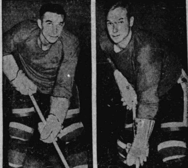
Doug Bentley et Roy Conacher, deux porte-couleurs des Eperviers de Chicago qui se font une lutte serrée pour la première place chez les compteurs de la ligue Nationale. Ces deux joueurs ont actuellement sur un pied d'égalité avec un total de 55 points chacun, soit 13 de plus que Sid Abel, qui détient la troisième place.