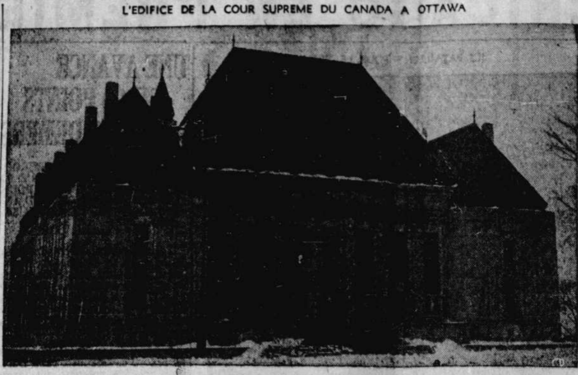
L'EDIFICE DE LA COUR SUPREME DU CANADA A OTTAWA