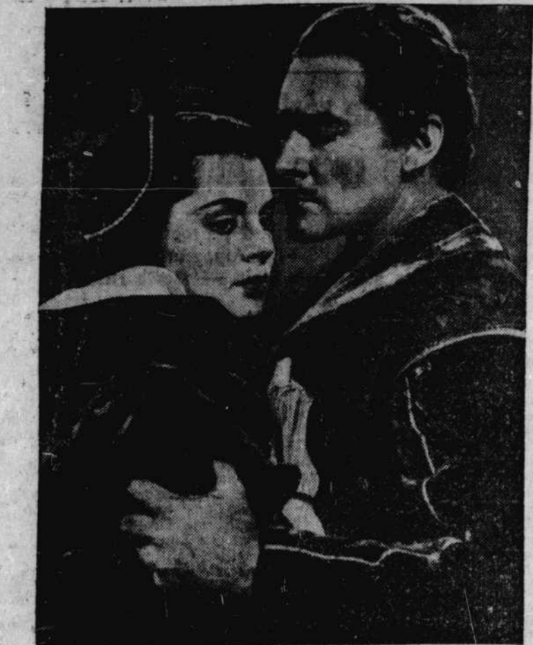
Voici une photo extraite du film "Adventures of Don Juan" que présente prochainement les écrans montréalais. Ce film, de la Warner Bros., est dit-on le plus important et le plus fastueux qu'ait jamais produit la compagnie. On reconnaît Errol Flynn et Viveca Lindfors, qui tiennent les rôles principaux.