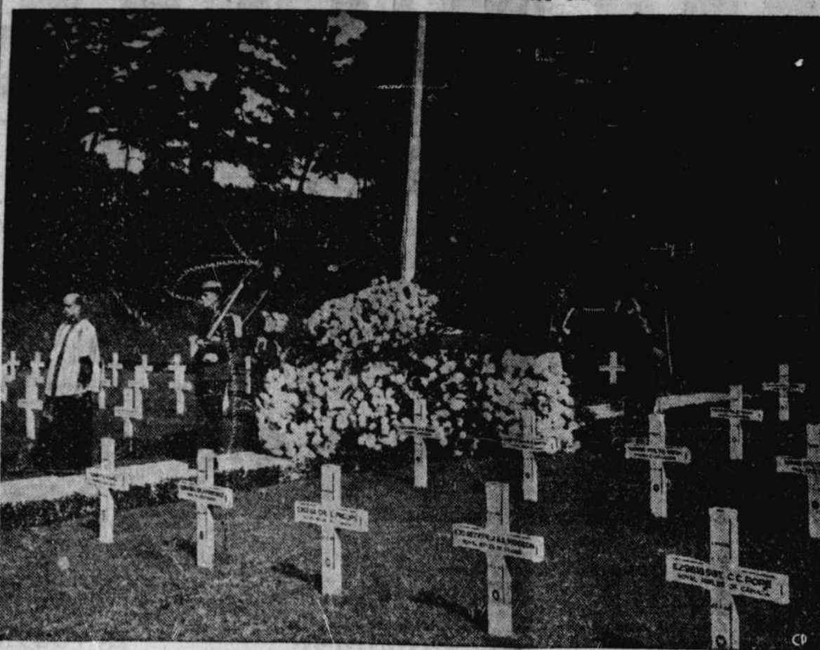
Cette photo de la cérémonie en hommage aux morts canadiens de la guerre qui a eu lieu au Japon le Jour du Souvenir, pour nous arriver avec un retard considérable, n'en présente pas moins un grand intérêt. C'est en effet au cimetière de l'ouest, celui d'Hodogaya, que sont enterrés les morts des régiments Royal Rifles et Winnipeg Grenadiers qui ont été faits prisonniers de guerre à Hong-Kong. Une quarantaine de Canadiens se trouvant au Japon à titre officiel ou privé ont assisté à cette cérémonie où la garde d'honneur était fournie par un bataillon australien.