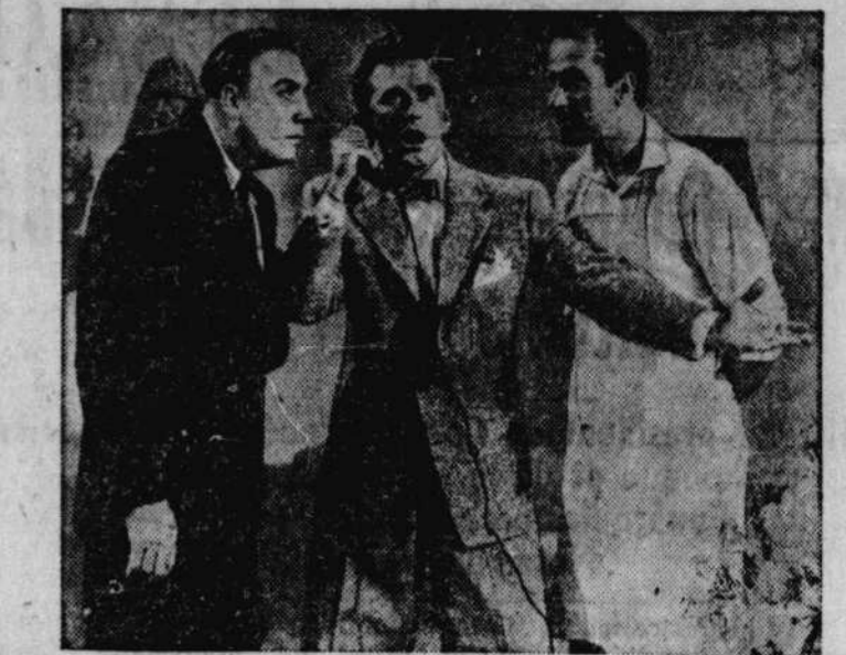
Kirk Douglas tient le rôle d'un romancier célèbre dans le film "My Dear Secretary" que présente cette semaine le cinéma Orpheum. Alan Moubrey et Keenan Wynn font partie de la distribution.