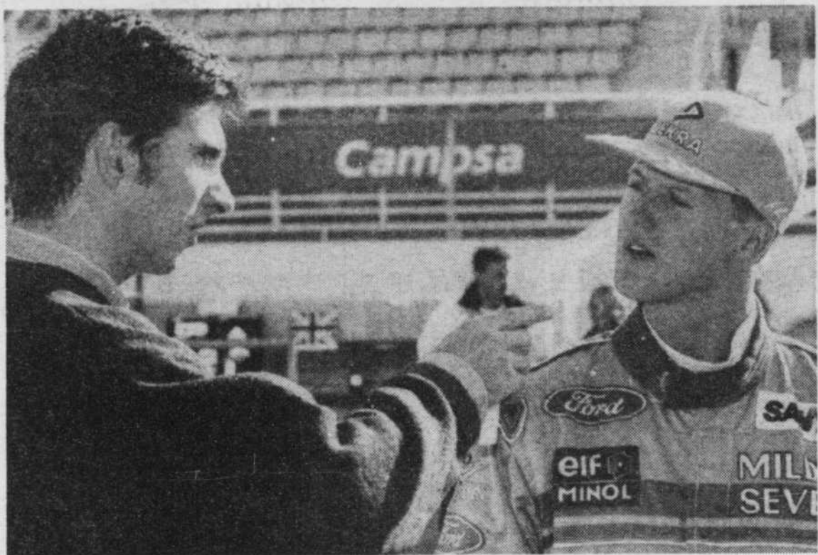
Damon Hill (à gauche) et Michael Schumacher ont souvent eu maille à partir au cours de la dernière saison, mais pour eux le GP d'Australie est maintenant chose du passé.