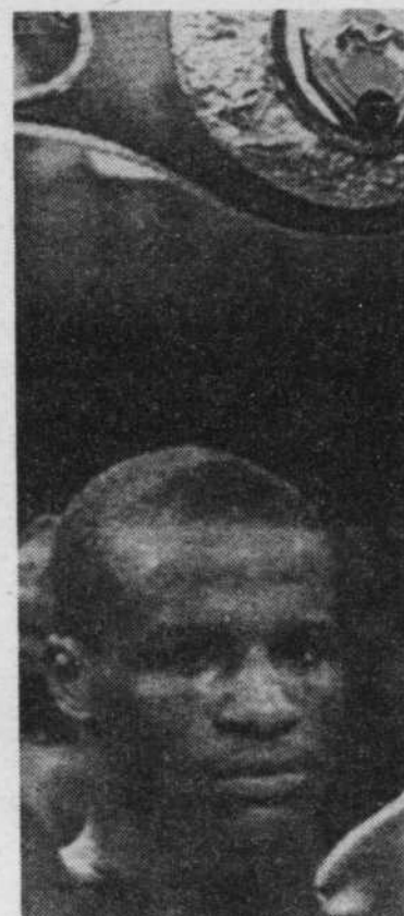
Michael Moorer est revenu sur sa décision d'abandonner la boxe et veut maintenant affronter de nouveau George Foreman.

le des jeux Olympiques de Séoul par un Sud-Coréen, sur une décision jugée scandaleuse par de nombreux observateurs.