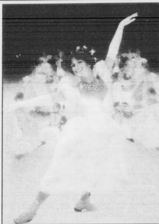
Dorothy Hamill, championne du monde de patinage artistique et médaillée d'or aux JO d'Innsbruck en 1976, incarne CENDRILLON, à 19h, à R.-C.