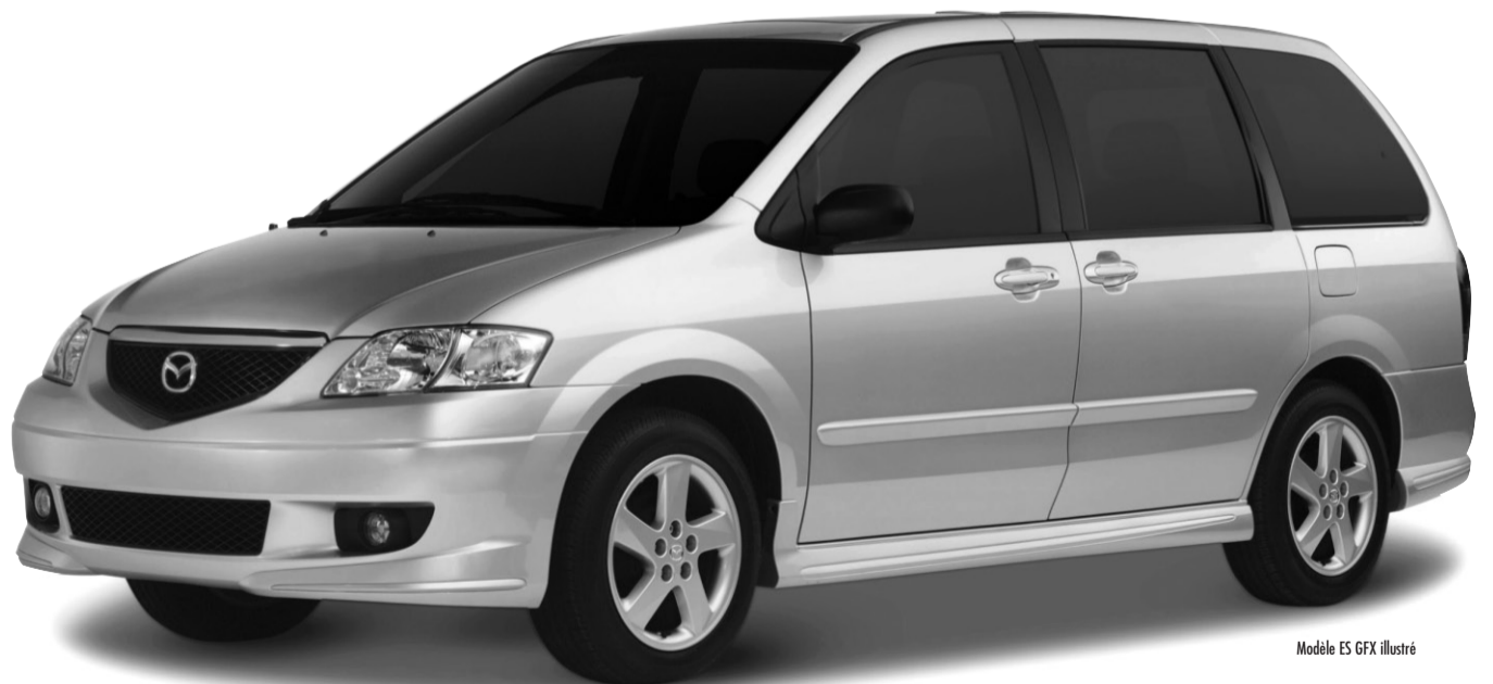
Modèle ES GFX illustré

DE FINANCEMENT À L'ACHAT JUSQU'À 60 MOIS*