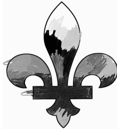
Le nouveau logo du Conseil de la souveraineté, dévoilé hier.

Selon le président, le 14 avril dernier a marqué la fin d'un cycle politique au Québec. « Et, contrairement à ce que disent certaines analyses à courte vue, loin d'être une solution dépassée, la souveraineté apparaît aujourd'hui comme la seule susceptible d'assurer à la société québécoise un développement harmonieux. Notre objectif, c'est de devenir l'instrument du mouvement social tourné vers le pro-