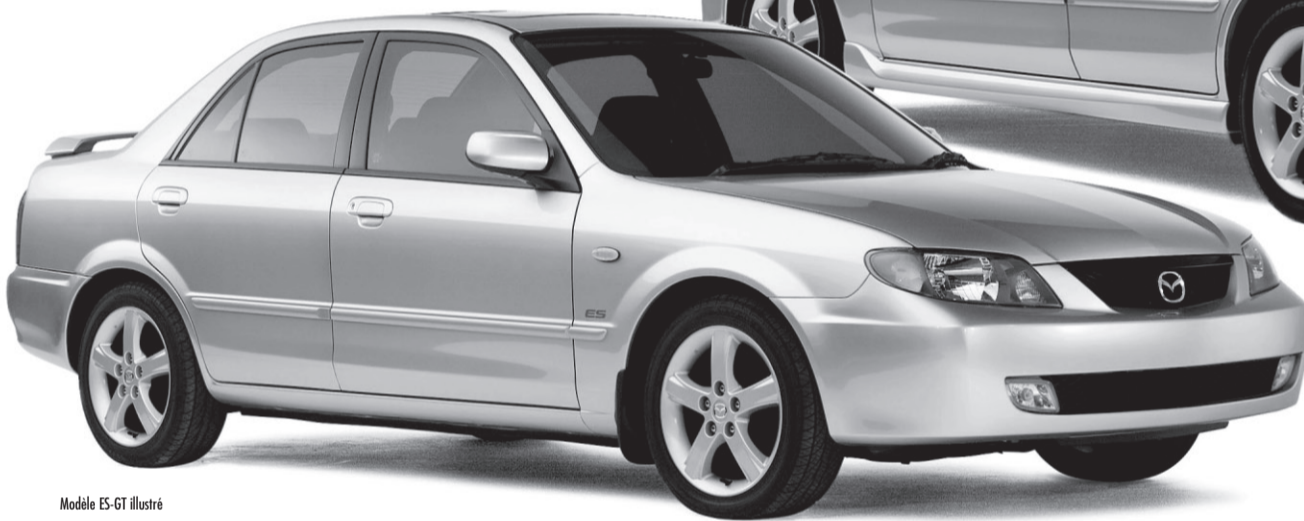
Modèle ES-GT illustré

Les Protégé et Protégé5, les plus vendues au Québec depuis 2 ans.†