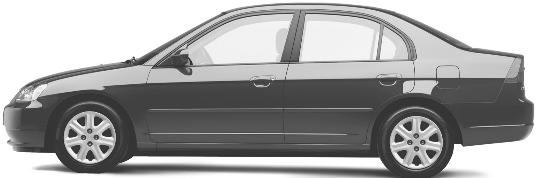
Berline Civic LX 2003 Illustrée