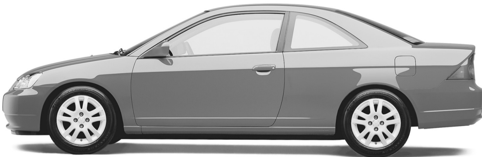
Coupé Civic Si 2003 Illustré