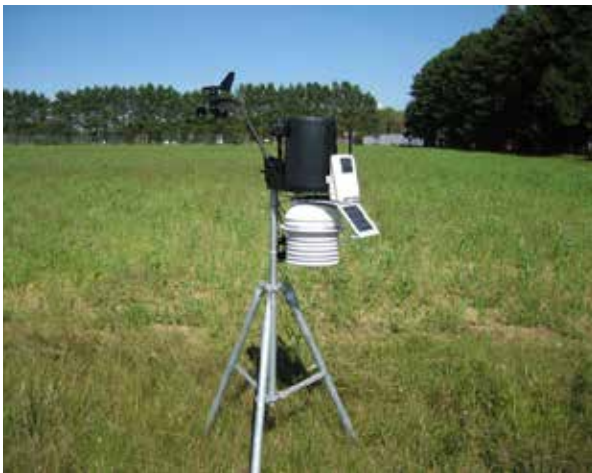
Station météo pour fournir les données servant aux outils d'aide à la décision

Différentes solutions peuvent être envisagées pour réduire l'utilisation des pesticides ou les risques de contamination (Tableau 2). Chaque solution présente toutefois des contraintes et peut ne pas être applicable dans toutes les situations. Par conséquent, la mise en place de nouvelles pratiques devrait faire l'objet d'une bonne planification entre les producteurs agricoles et leurs conseillers afin de s'assurer qu'elles sont applicables sur la ferme, et ce, de façon durable.