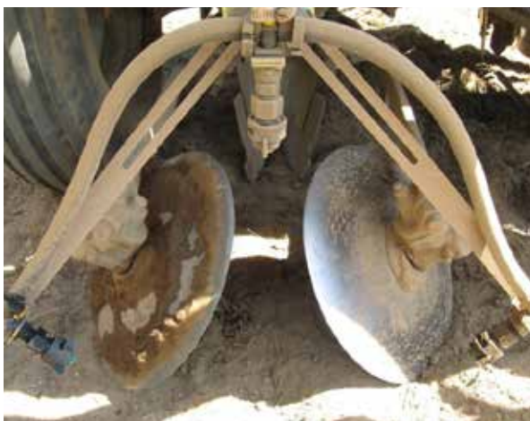
Équipement pour l'application d'herbicide en bandes