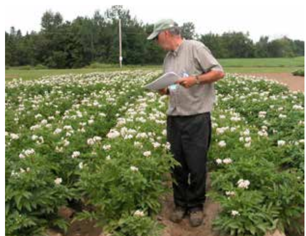
Dépistage dans les champs