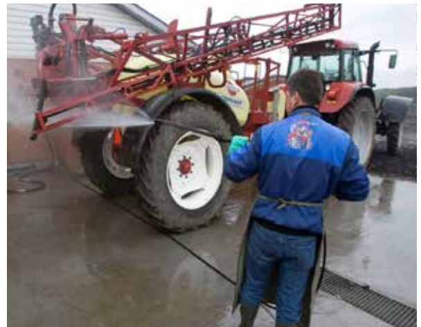
Aire de nettoyage du pulvérisateur