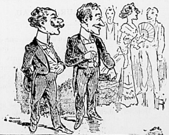
— Tiens ! la Baronne porte donc lorgnon maintenant ? — Vous savez bien que la vieille peinture se met sous verre !