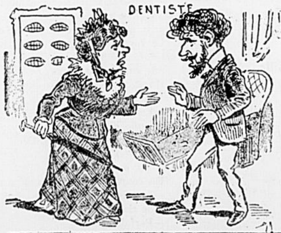
Il avait été convenu que vous me mettriez pour deux cents francs de dents, et, en somme, vous m'avez mis dedans pour deux cents francs !