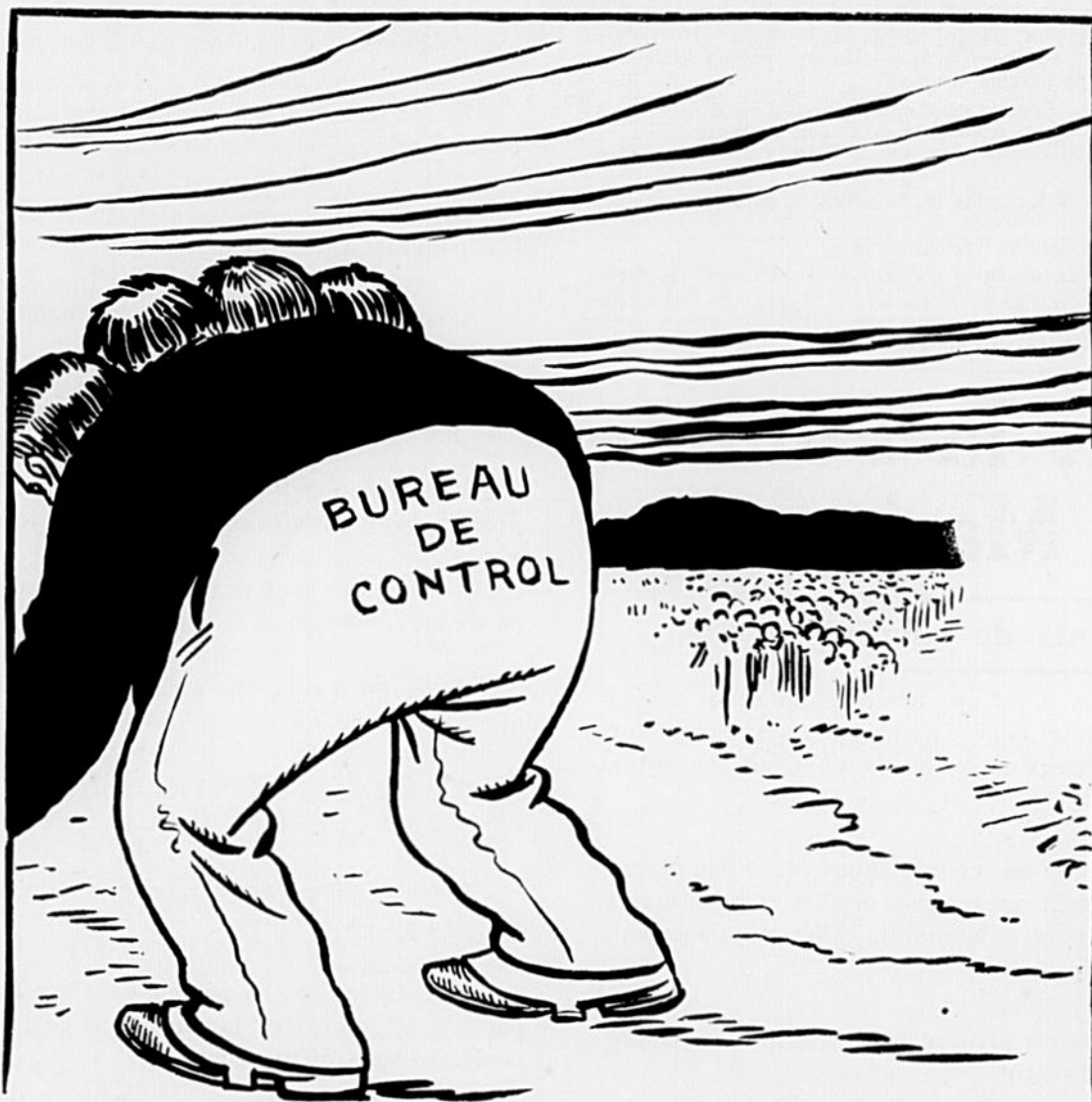
Le Bureau de Contrôle est maintenant au grand complet.