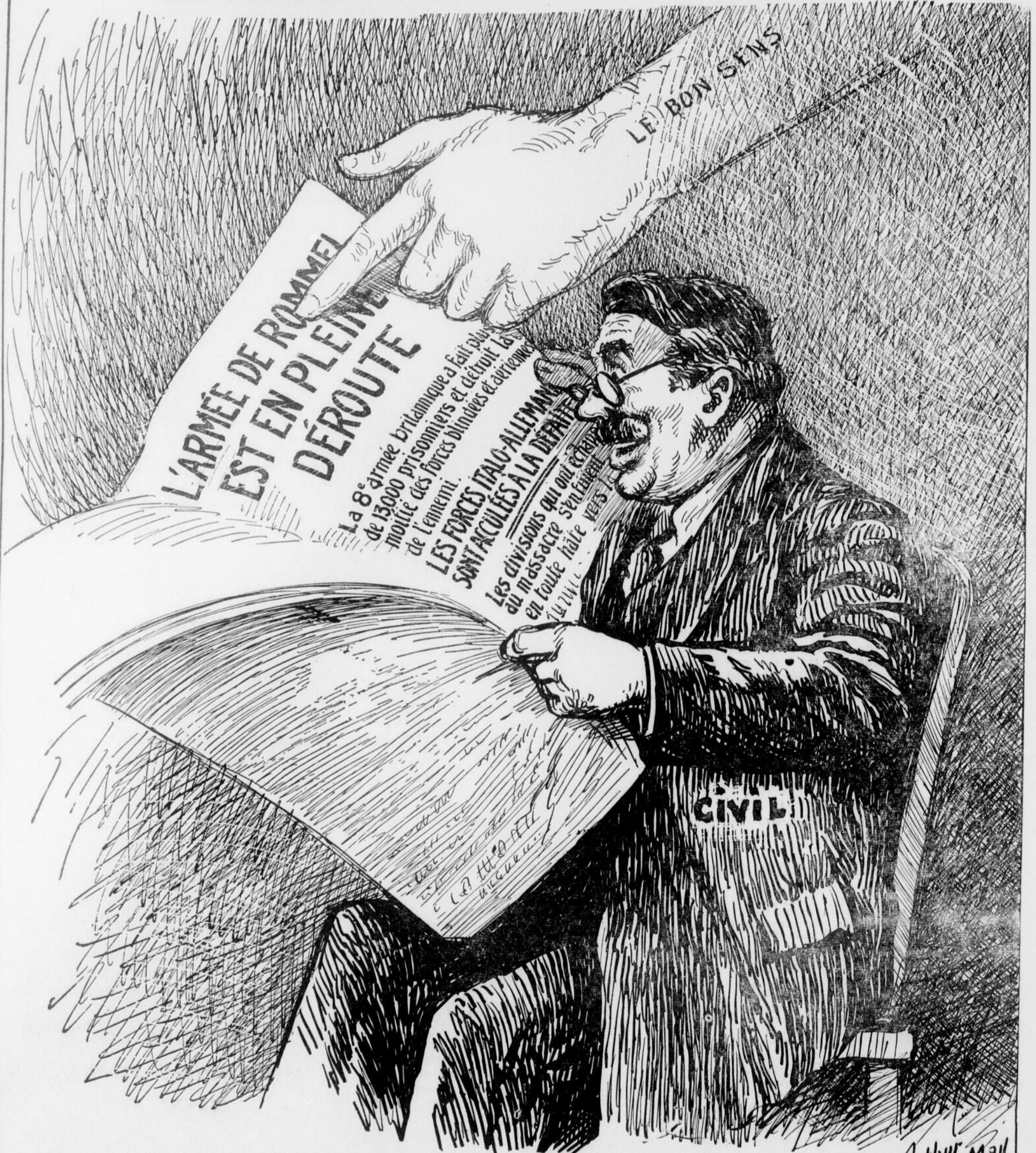
LA VOIX DU BON SENS: VOÏLÀ CE QUE PEUVENT FAIRE NOS GARS QUAND TU LEUR FOURNIS TOUT CE QU'IL LEUR FAUT!