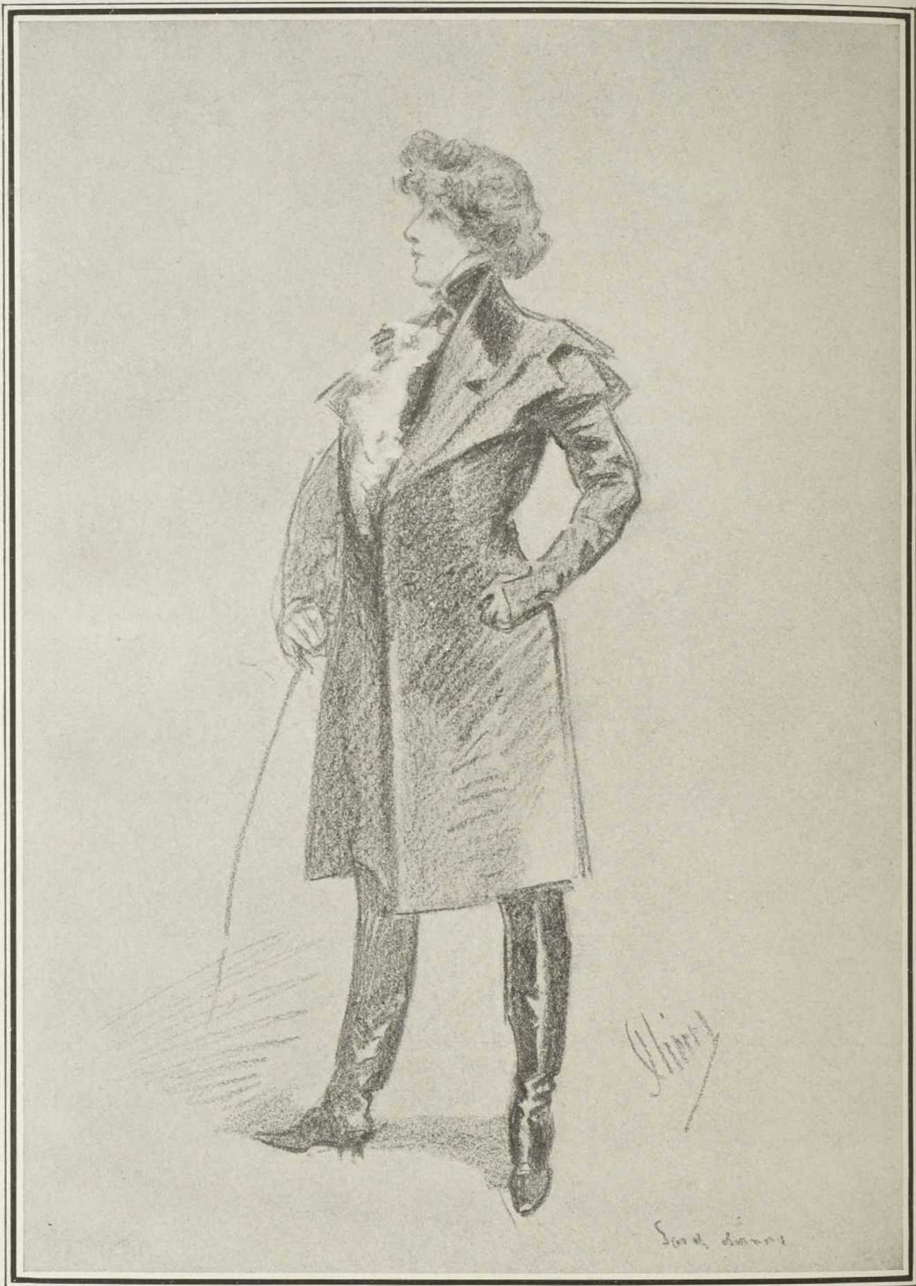
Mme. BERNHARDT AS L'AIGLON Drawn by Cheret