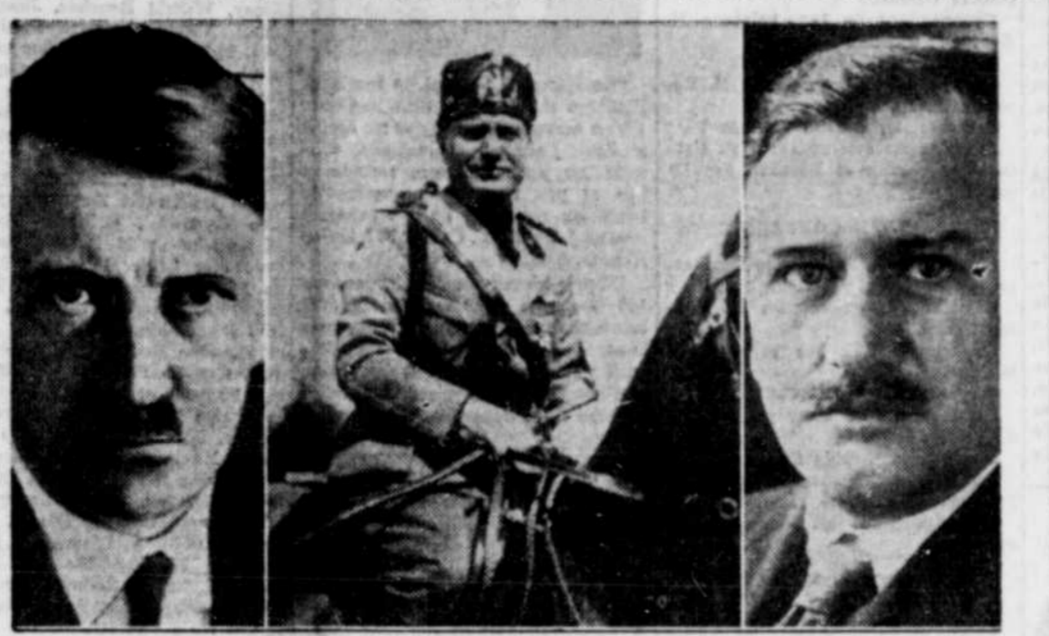
Une nouvelle qui arrive de Paris dit que Daladier doit s'entendre prochainement avec Mussolini et Hitler. Le premier ministre de France verrait d'abord Mussolini avec l'intention de trouver un moyen de réduire la friction entre la France et l'Italie, puis il aurait un entretien avec le chancelier Hitler. De gauche à droite : le chancelier Hitler, le premier ministre Mussolini et le premier ministre Daladier.