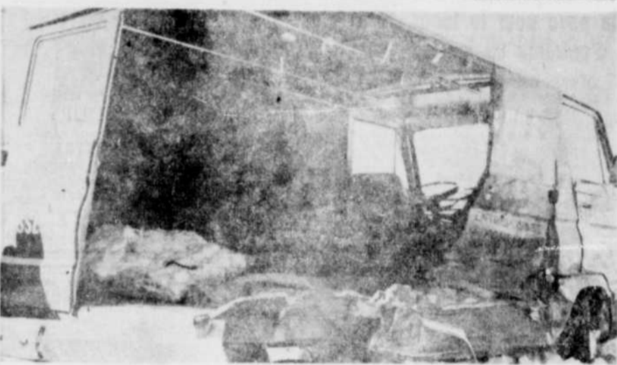
CINQ BLESSES. — Cinq jeunes personnes ont été blessées samedi après-midi dans la collision d'une automobile et d'une camionnette, sur la route 13, près de Wickham, dans le comté de Drummond. Les photos du dessus illustrent la violence du choc.