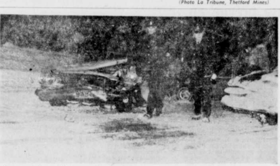
Spectaculaire collision — Une collision est survenue au début de la nuit de samedi, au pont de la Fonderie de Thetford Mines. Trois automobiles ont été impliquées dans cet accident. La photo ci-haut fait voir l'état d'un des trois véhicules. On remarquera également deux agents de la police municipale procédant aux constatations d'usage. Les dégâts s'élevaient à $2,000.