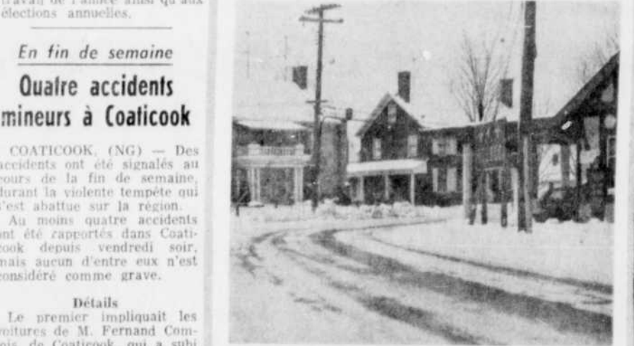
CINQ ACCIDENTS EN UN MOIS. — Voici, sur cette photo, l'endroit qui fut la scène de plusieurs accidents au coin des rues Canusa et Main, à Beebe. Aspect: une glissade. A qui la responsabilité? Voirie ou municipalité? Manque de collaboration? Manque de logique?

Dans les autres municipalités que Beebe, soit Rock Island et Stanstead, les employés de ces municipalités étendent du sable dans les rues de la ville et sur les rues comprises dans le contrat de la Voirie provinciale. Il semble plus logique de mettre du sable, une dépense très minime, comparativement aux accidents qui peuvent survenir à cause d'une économie de quelques dollars pour la municipalité.