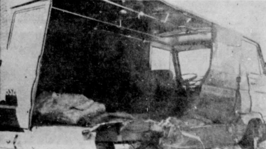
CINQ BLESSÉS. — Cinq jeunes personnes ont été blessées samedi après-midi dans la collision d'une automobile et d'une camionnette, sur la route 13, près de Wickham, dans le comté de Drummond. Les photos du dessus illustrent la violence du choc.