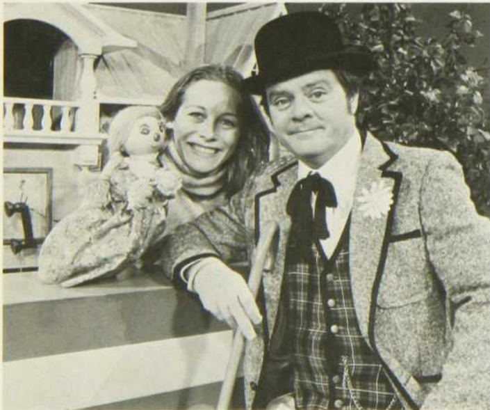
La Fourmi atomique