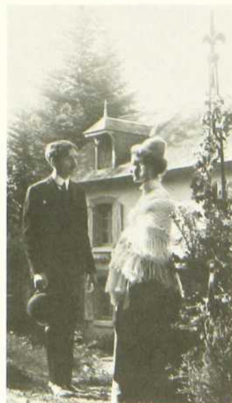
Le Grand Meaulnes

Jean-Gabriel Albicocco a été fidèle à la trame et à l'esprit du roman d'Alain-Fournier en adaptant l'oeuvre pour le petit écran. Mais on peut se demander s'il est parvenu à en traduire le caractère quasi mystique.