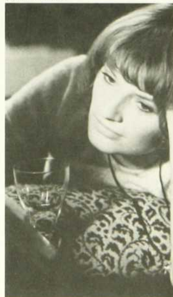
Ça va, salut!

Ce film noir et blanc constitue une bonne étude psychologique et les amateurs apprécieront les jeux de caméra.