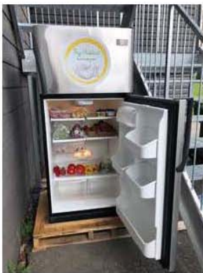
Saint-Damien : Espace Multiservice 154, rue Commerciale