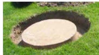
Exemple d'un couvercle bien dégagé

1° Dégager le couvercle de votre fosse ou de votre puisard en prévoyant un dégagement d'environ 4 pouces autour du couvercle de manière à ce que l'employé puisse le soulever facilement, tel que démontré sur l'image suivante . Laisser le couvercle sur la fosse.