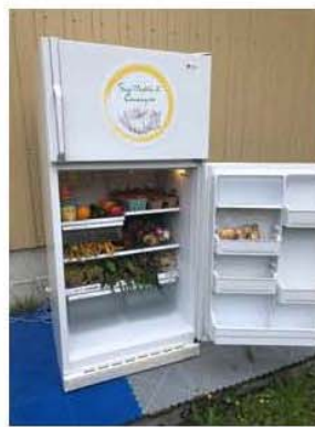
Saint-Léon: Ressourcerie Bellechasse 491, route 277