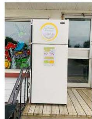
Saint-Philémon : 1425, rue Principale