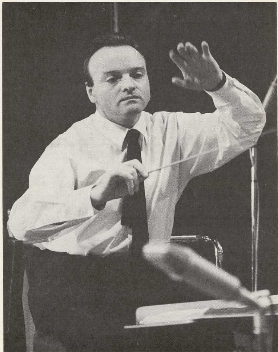
Karl Richter, Chef d'orchestre / Conductor