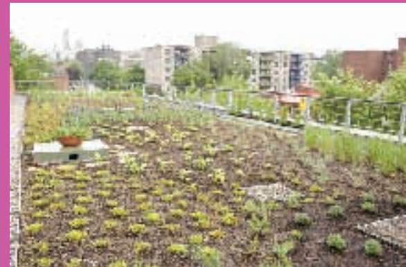
Maison de la culture Côte-des-Neiges – Toit vert