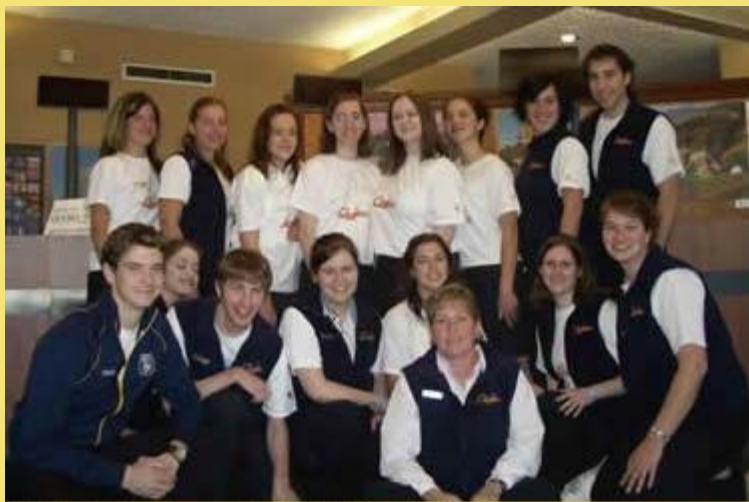
L'équipe des employés du centre Infoturiste de Rigaud.