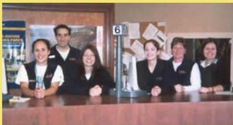
L'équipe des employés du centre infoturiste de Rivière-Beaudette.

Là où l'autoroute du Souvenir, au Québec, prend la relève de la 401 ontarienne, le personnel du centre Infoturiste de Rivière-Beaudette répond aux demandes d'information et offre la réservation d'hébergement à une clientèle provenant de l'Ontario ou des États-Unis.