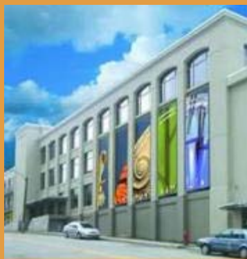
Le Musée de la nature et des sciences, à Sherbrooke.

Voici les histoires à succès de quatre entreprises certifiées Qualité Tourisme , comme quoi « La certification, ça change pas le monde, sauf que... »