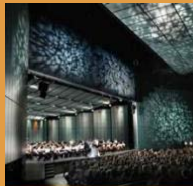
Le festival de Lanaudière

Le 27 janvier dernier, dans le cadre des prix Opus, le Conseil québécois de la musique consacrait le Festival de Lanaudière diffuseur de l'année 2007 pour sa 30 e édition. La très grande notoriété des artistes sur scène et la programmation variée et accessible ont permis d'atteindre un nouveau record d'achalandage de 66 000 mélomanes.