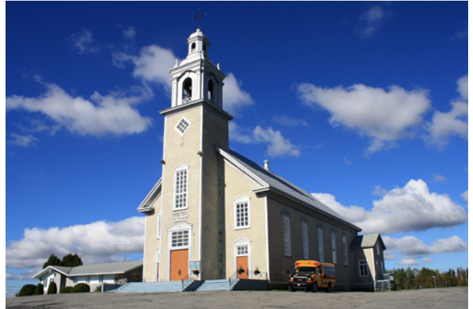
Église de Sainte-Rose, sise au 515, rue Principale

L'église est une digne représentante du style néoclassique. Au milieu et à la fin du 19 e siècle, ce style est particulièrement estimé par les constructeurs d'églises et le clergé catholique pour la construction des temples religieux des paroisses nouvellement constituées qui émergent un peu partout à l'intérieur des terres au Québec. Sobriété, rigueur, symétrie sont les caractéristiques de ce style qui tire ses origines dans l'architecture grecque et romaine. L'église de Sainte-Rose possède un revêtement de tuiles d'amiante-ciment en losanges, de belles fenêtres anciennes à petits carreaux, des chambranles et un revêtement de tôle à la canadienne sur la toiture.