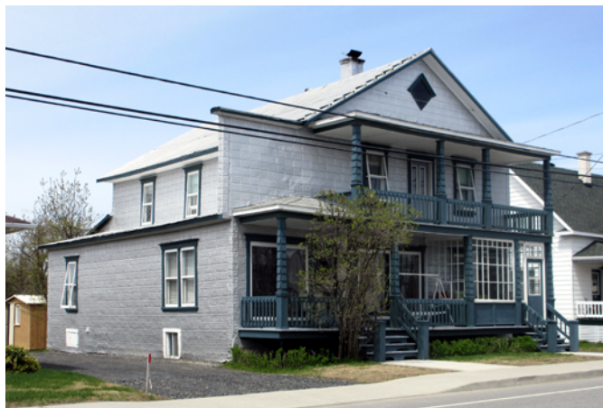
631, rue Principale

L'une des caractéristiques du paysage bâti de Saint-Camille-de-Lellis est la conservation des parements de tôle embossée sur quelques résidences anciennes. Ce type de revêtement connaît une grande popularité au début du 20 e siècle. Produit en série par des compagnies dans une grande variété de motifs, il peut revêtir autant les murs intérieurs qu'extérieurs. Dans le cas de cette maison construite vers 1920, le revêtement imite l'apparence de la pierre de taille à bossage. La résidence sise au centre du village représente bien le style vernaculaire américain en raison de son toit à deux versants droits, de sa façade pignon disposée face à la rue, de son plan au sol rectangulaire et de la symétrie de ses ouvertures. La préservation des fenêtres en bois anciennes, de l'ouverture en losange du pignon et des chambranles lui confère une bonne authenticité.