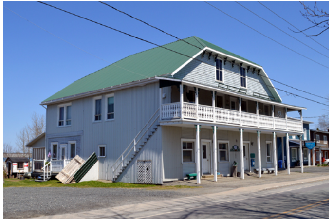
Ancien magasin général de Jean-Giguère, sis au 152, chemin des Bois-Francis

Avant la construction de ce grand bâtiment en 1903, Jean Giguère, meunier et fils d'Isidore Giguère, habite à l'étage supérieur du moulin de son père pendant quatre ans et vend de l'épicerie pour accommoder les villageois. Cette maison dotée d'une toiture en demi-croupe et d'une grande galerie en façade accueille à l'étage la première chapelle de Sainte-Aurélie en 1907 et 1908. En plus du magasin général, le bâtiment abrite également la centrale téléphonique en 1915, le bureau de poste en 1917 ainsi qu'une auberge pendant plusieurs années. Le magasin ferme ses portes en 1941, faute de relève, et Jean Giguère s'occupe alors entièrement du moulin à bardeaux situé juste derrière. Plusieurs commerces se succèdent ensuite en ces lieux : deux salons funéraires, un magasin de vêtements, une salle de billard avec un comptoir-lunch, la caisse populaire et un salon de coiffure.