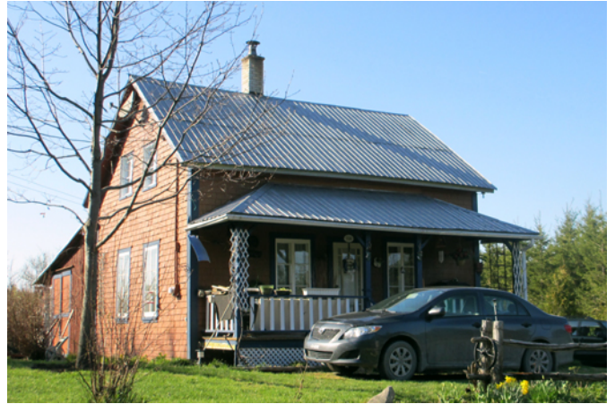
156, rang A

Le patrimoine bâti du rang A de Saint-Cyprien est représentatif de la période de colonisation de ce rang entre la fin du 19 e siècle et les années 1930. Bien que modestes et de petites dimensions, les maisons qui le parsèment sont souvent vouées à accueillir des familles nombreuses vivant de l'agriculture. La maison typique de ce rang est de type colonisation comme celle-ci érigée vers 1930. Influencée par l'architecture vernaculaire américaine, cette maison bien préservée se caractérise par un carré de bois surélevé du sol, une toiture à deux versants droits, une ornementation sobre et une composition symétrique. Le revêtement en bardeau de cèdre, les fenêtres et les portes en bois ainsi que les chambranles et les planches cornières, tous des éléments typiques de ce modèle, sont encore en place. Aujourd'hui, la forêt reprend tranquillement le dessus sur les terres jadis défrichées par les hommes qui ont bâti ces demeures.