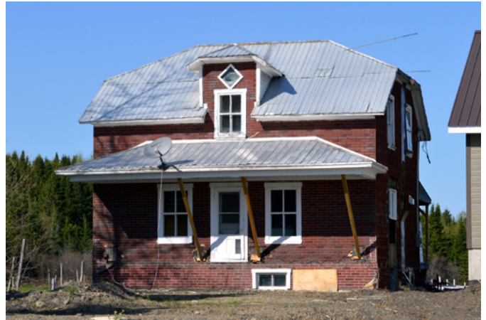
260, route de la Grande-Ligne Nord

À partir de la deuxième moitié du 19 e siècle, l'industrialisation des pays occidentaux influence les façons de construire autant en milieu urbain que rural. Les plans des résidences peuvent alors se commander par catalogue et les matériaux (revêtement, portes, fenêtres) souvent produits en usine, sont standardisés. Le style architectural associé à cette nouvelle ère est le vernaculaire américain qui se décline en plusieurs variantes. Ici, nous pouvons admirer le modèle à demi-croupe. La demeure, construite entre 1900 et 1940, est revêtue de papier-brique, un revêtement peu coûteux populaire au Québec entre les années 1930 et 1960. Les gens étaient alors d'avis qu'il contribuait à donner un certain prestige aux maisons les plus modestes. Cette maison possède une authenticité certaine. Les fenêtres à charnières avec de grands carreaux, la porte et les chambranles sont anciens et probablement d'origine.