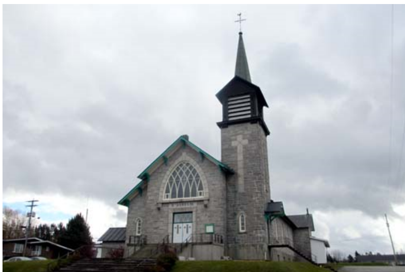
Église de Sainte-Aurélie, sise au 155, chemin des Bois-Francis, Sainte-Aurélie