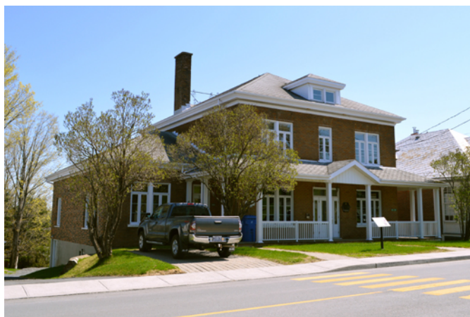
Maison des notaires, sise au 2825–2837, 20 e Avenue

Celle-ci est une digne représentante de la maison dite « Four square house », ainsi nommée aux États-Unis où elle fut développée à la fin du 19 e siècle. Les catalogues de plans contribuent alors pour beaucoup à faire connaître ce style au Québec. Le volume cubique, les deux étages complets, la toiture à quatre versants et la facilité de sa construction contribuent à la popularité de ce style de résidence dans la première tranche du 20 e siècle. Son revêtement en brique, ses vastes dimensions, la hauteur de ses ouvertures et son imposante galerie ombragée d'un auvent couvrant les trois façades traduisent le statut social de ses premiers occupants.