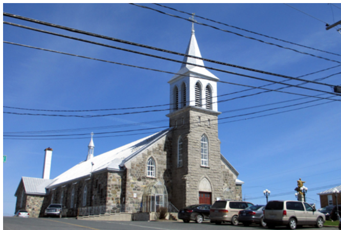
Église de Sainte-Justine, sise au 240, rue Principale

L'ancienne chapelle du monastère de Notre-Dame de la Trappe du Saint-Esprit sert comme premier lieu de culte aux habitants de Sainte-Justine lorsqu'elle est récupérée et déménagée dans le village de Sainte-Justine suite à la fermeture de cette institution en 1872. Devenue trop exigüe avec la croissance de la population, l'agence Ouellet et Lévesque est alors approchée pour concevoir les plans d'une nouvelle église, que l'on souhaite aussi majestueuse que possible. La construction s'amorce en 1912. En 1936, un important incendie la réduit en cendres et en fait autant du presbytère ainsi que de quelques maisons voisines. L'église est rapidement remplacée puisque cette même année, l'architecte Charles-A. Jean conçoit les plans de l'église actuelle d'après un style néogothique. Son intérieur à l'aspect austère lui donne un cachet monastique, adoptant les formes et les idées architecturales de Dom Bellot qui privilégie des matériaux simples et une structure apparente aux arcs paraboliques reposant sur des piliers très écartés qui laissent l'autel visible de partout.