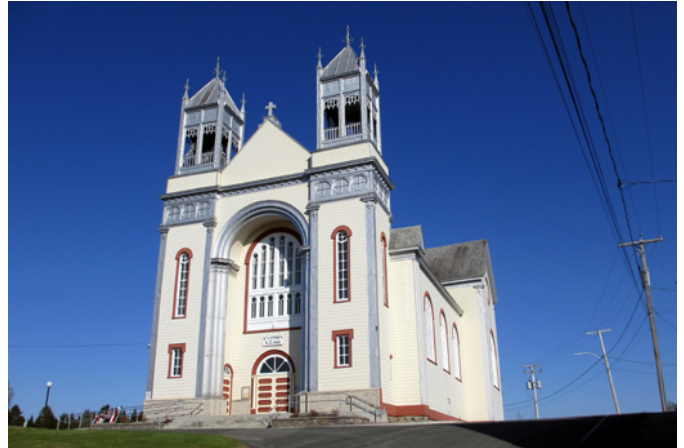
Église de Saint-Cyprien, sise au 409, rue Principale

Depuis son ouverture à la colonisation au début du 20 e siècle, le territoire de Saint-Cyprien accueille un nombre grandissant de défricheurs. Les familles se retrouvent en nombre suffisant dans les années 1910 pour avoir droit à une église. L'architecte Lorenzo Auger signe les plans de cette construction curieusement monumentale pour une région de colonisation encore majoritairement recouverte de forêt. Les travaux de construction se terminent en 1918 mais les clochers actuels ne sont érigés qu'en 1928 par la compagnie Louis Caron & fils Limité selon les plans et devis du notaire-architecte Gérard Morisset. L'église est représentative du courant néo-roman. Ce style s'inspire des formes du Moyen Âge, plus précisément de l'art roman des abbayes françaises construites du 10 e au 12 e siècle. On le reconnaît par l'emploi généralisé de l'arc cintré, des ouvertures à embrasure profonde, des arcades diverses et des colonnes trapues.