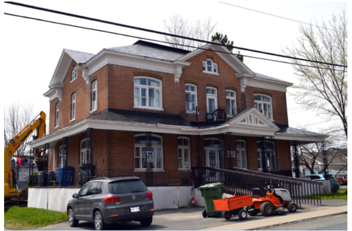
Ancien presbytère de Saint-Camille-de-Lellis, sis au 2, rue de la Fabrique

Le 24 mars 1918, les marguilliers de la paroisse de Saint-Camille-de-Lellis décident de faire construire un nouveau presbytère en brique avec une toiture recouverte de tôle. L'entreprise Elzéar Métivier et Fils de Saint-Damien-de-Buckland (comté de Bellechasse), obtient le contrat de construction. Les plans du bâtiment sont alors semblables, à quelques différences près, à ceux du presbytère de Scott (Beauce) que l'entreprise des Métivier avait auparavant érigé en 1903. Les plans étaient alors signés par l'architecte Joseph-Pierre Ouellet. La nouvelle maison curiale est bénie le 7 septembre 1919. Son architecture est représentative du modèle de la maison cubique ou Four Square House , qui a été créé aux États-Unis en 1891 par l'architecte Frank Kidder. Rapidement diffusé au Canada par les catalogues de plans, ce modèle est très prisé dans la construction des presbytères au Québec durant la première tranche du 20 e siècle. En 1925, le presbytère échappe de justesse au feu qui détruit l'église et une grande partie du village. En 1985, il est vendu et transformé en résidence pour personnes âgées.