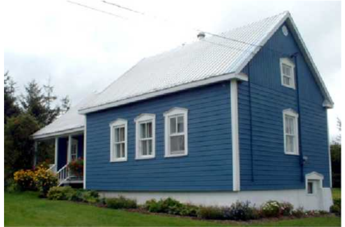
12, rang de Bellechasse