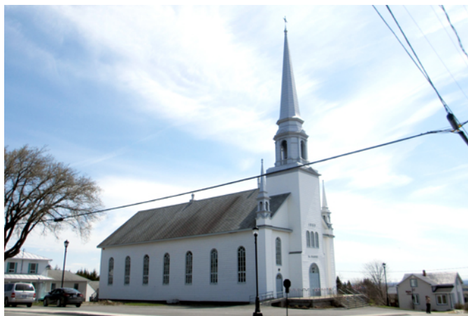
Église de Sainte-Sabine, sise au 88-A, rue Principale

Comme plusieurs églises réalisées par David Ouellet, le style architectural est conventionnel et ne s'écarte pas de la tradition classique. Ce courant est ressenti ici dans la symétrie des ouvertures, l'apport de l'arc cintré pour les portes et les fenêtres, et la sobriété de l'ornementation.