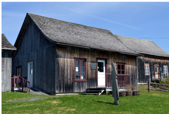
Maison Labbé-Chabot, sise au 700, route 204