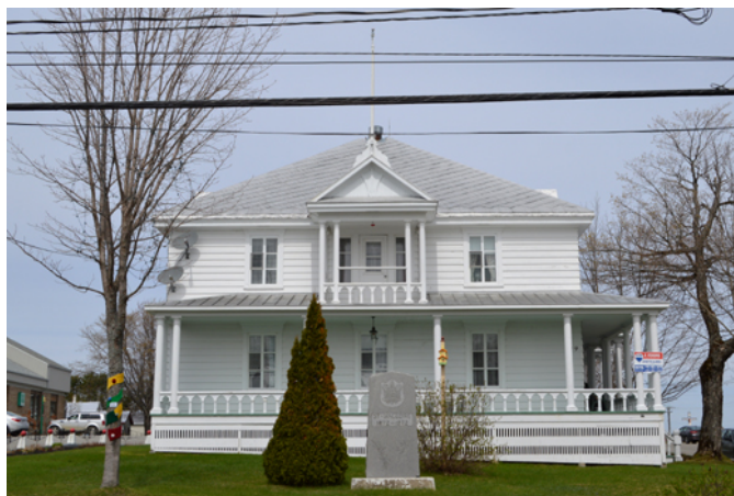
Ancien presbytère de Saint-Magloire, sis au 129, rue Principale

La région montagneuse et boisée qu'est alors Saint-Magloire au milieu du 19 e siècle reçoit ses premiers défricheurs dans les années 1860. Ils sont en nombre suffisant au cours de la décennie suivante pour réclamer leur propre lieu de culte et l'établissement d'un curé. Dès 1904, la première chapelle transformée par la suite en maison curiale ne semble plus convenir au curé en place qui réclame un nouveau logis. L'opposition des paroissiens à cette construction jugée trop luxueuse pour leurs moyens est de courte durée. Dès 1906, le deuxième presbytère est réalisé selon les plans de l'architecte David Ouellet dans un style fidèle à l'œuvre de ce concepteur. Par le passé, Ouellet avait embrassé à plusieurs reprises le courant cubique dans l'élaboration de presbytères ailleurs au Québec. La sobriété du style cubique est ici agrémentée par l'abondance de boiseries décoratives propres au courant victorien alors en vogue à l'époque.