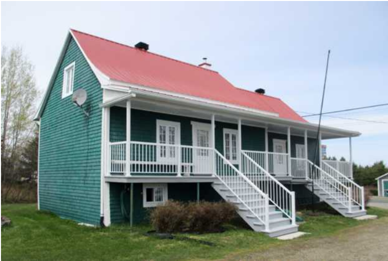
348, route 281, Saint-Magloire