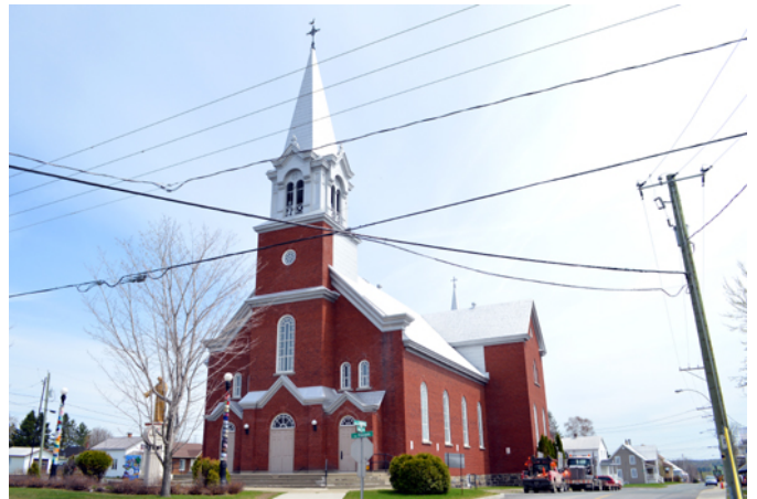
Église de Saint-Camille, sise au 610, rue Principale

L'église actuelle de Saint-Camille est le deuxième lieu de culte à prendre place sur le site. Une première église est construite en 1906 et incendiée en 1925 lors d'un immense incendie qui ravage une grande partie du village. Un an plus tard, une nouvelle église remplace déjà l'édifice incendié en reprenant la même empreinte au sol. Les plans sont réalisés par Héliodore Laberge (1883–1956). L'entreprise Langelier et Plante en assure la construction. Le nouveau temple est représentatif du courant néoclassique. Ce style s'inspire de l'architecture antique grecque et romaine et se caractérise par l'usage d'éléments classiques comme la symétrie des façades, l'emploi des frontons, de corniches à consoles, de clé de voûtes, de chaînage d'angles. L'église de Saint-Camille est la seule de la région des Etchemins qui est revêtue de brique.