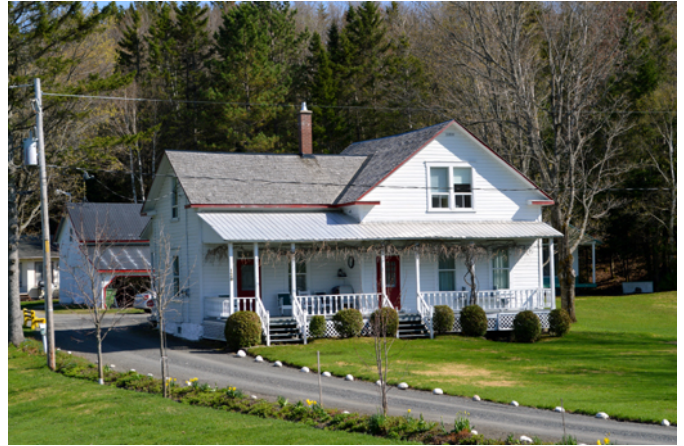
Club Vallon d'Or, 128, 1 er Rang Ouest