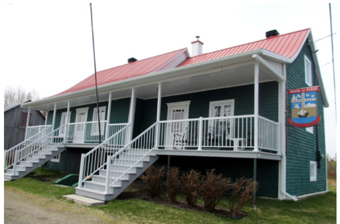
Domaine LaRochelle, sis au 348, route 281