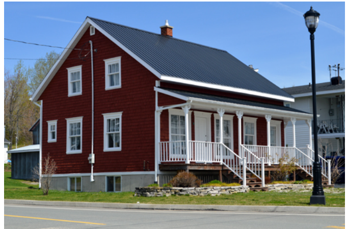
Maison rouge, sise au 1, rue Saint-Charles

Cette demeure érigée vers 1905-1906 est représentative du courant vernaculaire américain. On reconnaît ici ce style par la toiture à deux versants droits et le plan au sol rectangulaire. Les fenêtres à grands carreaux et les portes à panneaux sont anciennes. Le revêtement de bardeau de bois contribue à donner du charme à cette maison centenaire alors que les deux portes en façade rappellent son ancienne vocation commerciale.