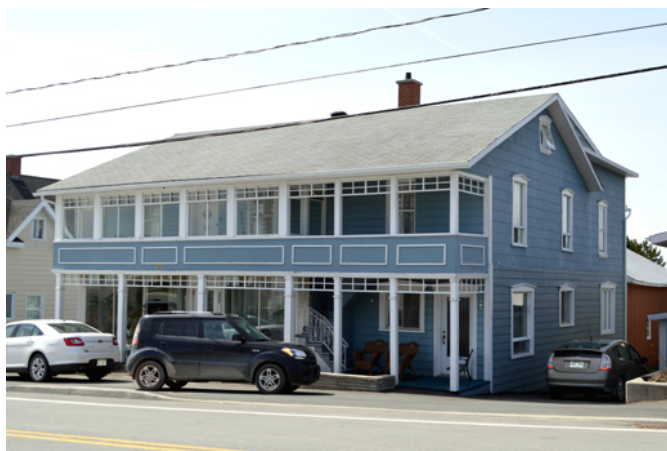
Ancien magasin général, sis au 105, rue Principale

On reconnaît l'influence du courant vernaculaire américain dans ce bâtiment notamment en raison de sa toiture à deux versants droits et de ses dimensions rectangulaires. En dépit des modifications qui lui ont ravies plusieurs de ses composantes d'antan, cet ancien magasin général possède encore son revêtement de planches de bois horizontales.