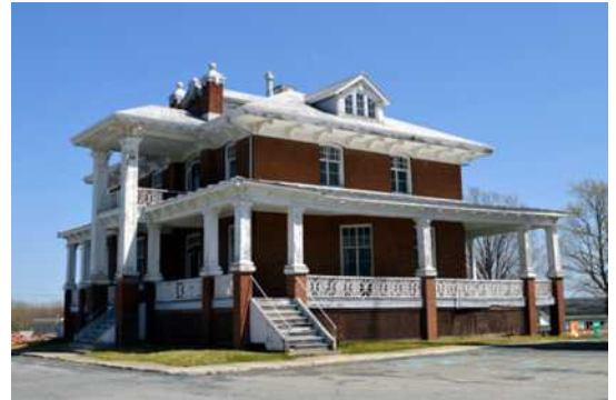
Presbytère, sis au 658, 12 e Avenue, Saint-Zacharie