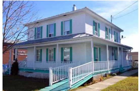
2, rue Saint-Charles, Sainte-Sabine