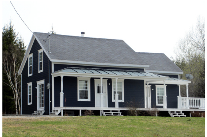
63, rang Saint-Cyrille

Cette maison est construite vers 1908 sur un emplacement différent du site qu'on lui connaît aujourd'hui. Bien qu'elle présente une apparence plutôt contemporaine depuis l'installation de matériaux de facture moderne, elle possède encore quelques caractéristiques associées à l'architecture vernaculaire américaine, dont le plan rectangulaire, la toiture à deux versants droits, la disposition symétrique des ouvertures et une galerie sur la façade avant couverte d'un auvent. Cette architecture originaire des États-Unis a connu un vif engouement au Québec entre la fin du 19 e siècle et la première moitié du 20 e siècle. Elle est très bien représentée dans la région des Etchemins.