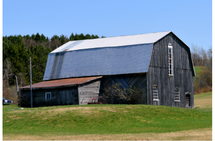
3268, 3 e Rang

Cette grange-étable avec une toiture mansardée occupe une belle présence dans le paysage rural de Saint-Zacharie. Une fenêtre avec imposte en hémicycle provenant de la première église de Saint-Zacharie datant de 1892 est bien visible sur l'un des côtés. Les fondations en pierres sèches et le revêtement de bois fait de planches verticales et obliques affichent l'ancienneté de la construction.