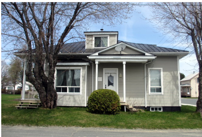
11, rue Carrier

Cette maison construite vers 1926 est caractéristique des premiers bungalows nord-américains d'influence Arts & Crafts. Ce mouvement architectural, d'abord apparu en Angleterre au 19 e siècle, gagne les États-Unis au début du 20 e siècle où il est rapidement popularisé par les catalogues de maisons et les revues de plans distribués à grande échelle à travers l'Amérique du Nord. Les premiers bungalows issus de ce courant sont composés de volumes simples, habituellement revêtus de bardeau de cèdre et sont dotés d'une grande galerie protégée par l'avancée de la toiture à faible pente. Le garage bien conservé de la résidence est un élément qui crée un effet d'ensemble intéressant.