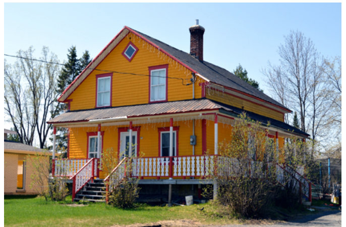
Maison Goudreau, sise au 1750, 20 e Avenue