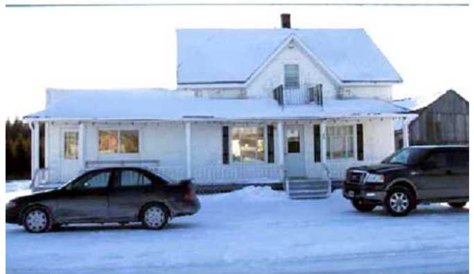
140, route de la Grande Ligne

Cette maison de style vernaculaire américain est érigée vers 1937. Depuis le milieu des années 1940, elle appartient à une même famille : les Veilleux. À proximité se dresse une belle grange-étable à toiture mansardée. Ce type de grange est populaire entre 1900 et 1940. Contrairement à la toiture à deux versants dont l'espace d'entreposage dans l'entre-toit demeure réduite, la forme mansardée de la toiture dégage une superficie maximale et permet ainsi de stocker une plus grande quantité de fourrage. Cette grange se démarque par la préservation de plusieurs de ses composantes en bois.