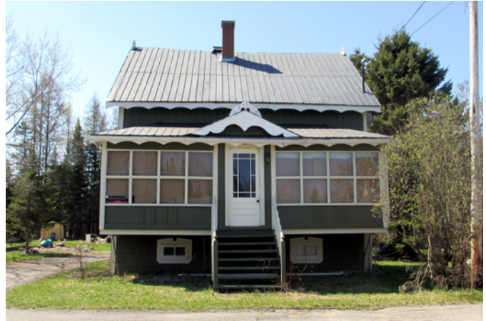
750, 1 ère Rue

Cette maison construite vers 1924 est représentative du cottage vernaculaire américain dont le modèle à deux versants droits remplace progressivement la maison traditionnelle québécoise à partir de la fin du 19 e siècle. La maison a préservé plusieurs composantes caractéristiques de ce courant, dont le revêtement extérieur en bardeau de bois, les chambranles, les planches cornières et une porte à panneaux en bois. Les boiseries décoratives qui soulignent les bordures de la toiture de la maison et de la véranda ajoutent une touche de fantaisie à cette maison habituée à recevoir une ornementation plus limitée.