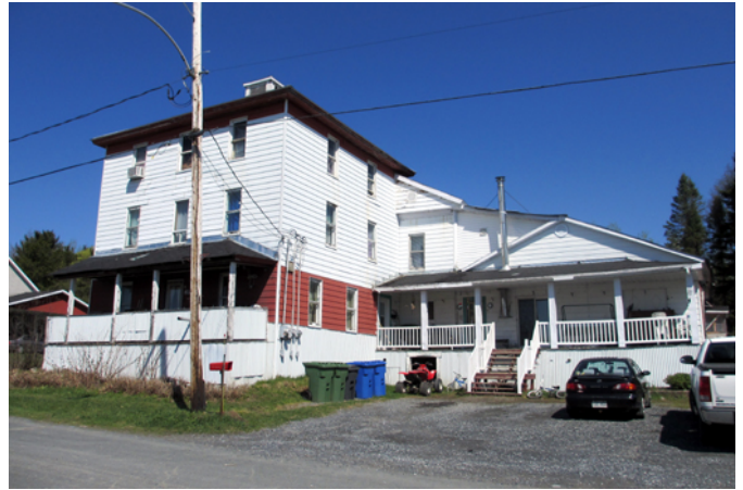
817, rue Lamontagne

Suite à l'inauguration de la ligne de chemin de fer du Québec Railway Station en 1909, la gare de Morisset-Station est construite vers 1912. Afin d'accueillir les voyageurs qui sont nombreux à y transiter, un grand hôtel de trois étages vient prendre place en face de la voie ferrée et à proximité de la gare. L'établissement du chemin de fer et de la gare favorisent la création d'un petit hameau, nommé Morisset-Station, composé également d'un magasin général et de quelques résidences. À l'époque où il est courant de prendre le train, la création d'un noyau villageois près des gares (station) demeure courante au Québec. Dans les années 1960, on ajoute à l'hôtel un bâtiment annexe servant de salle de réception. La gare est quant à elle démolie en 1969.