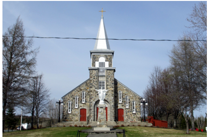
Église de Saint-Luc, sis au 197, rue Principale