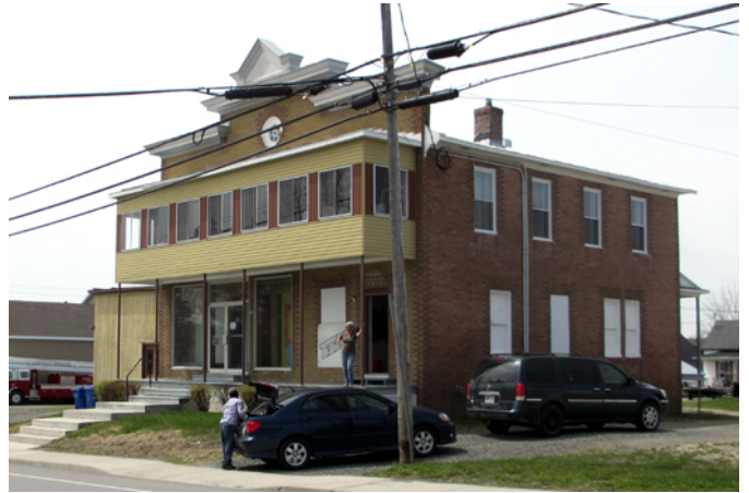
Hôtel Brochu et magasin général, sis au 607, rue Principale

Dans les années 1920, le village de Saint-Camille-de-Lellis grouille d'activités. Le dimanche, les habitants des quatre coins de la campagne s'y déplacent pour assister à la messe et en profitent pour y faire leurs achats. Ils fréquentent notamment ce magasin général. Édifié vers 1925, ce bâtiment sert aussi d'hôtel. Ses hautes vitrines commerciales et ses grandes dimensions pour entreposer la marchandise rappellent sa fonction d'origine. Avec sa toiture plate, son parapet débordant du toit et son plan au sol rectangulaire, il est apparenté au courant architectural Boomtown popularisé dans les villes industrielles américaines vers la fin du 19 e siècle.