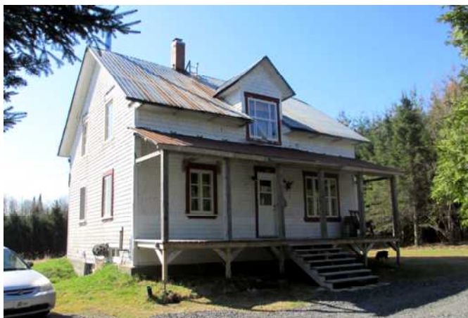
315, 12 e Rang Est

Cette demeure est érigée vers 1920 en bordure d'un rang de campagne. Comme plusieurs résidences de la région des Etchemins, le bardeau de bois recouvre la maison. Lors de sa construction, son constructeur s'est inspiré du courant vernaculaire américain alors en vogue partout au Québec. Ce courant architectural est notamment reconnaissable par la toiture à deux versants droits, un carré rectangulaire, la symétrie des ouvertures et l'emploi de matériaux standardisés comme les fenêtres à battants avec de grands carreaux. Des éléments en saillie sont greffés à la maison afin d'assurer plus de confort à la famille, dont la lucarne centrale et la grande galerie couverte en façade. Si la maison est aujourd'hui ceinturée par la forêt, on peut imaginer qu'elle a évolué pendant des décennies dans un paysage composé de champs cultivés.