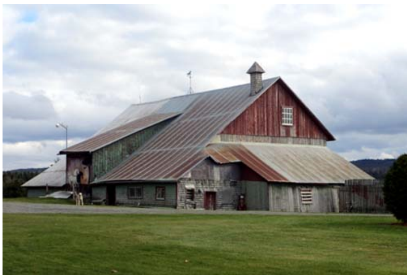
2232, 2 e Rang, Saint-Zacharie