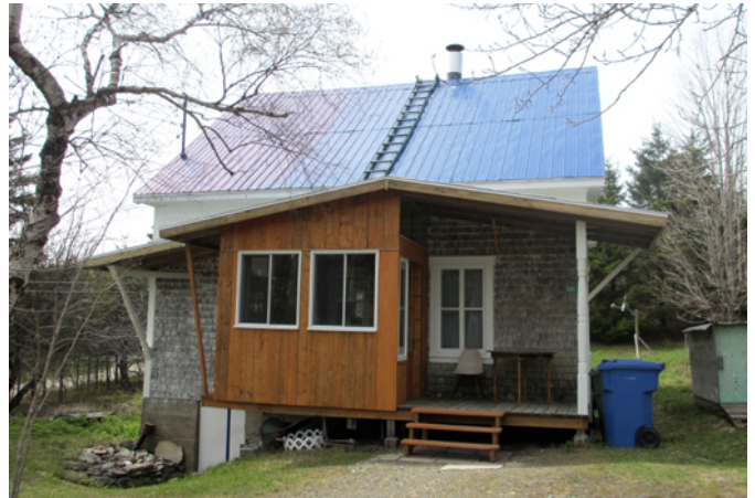
120, route Vachon