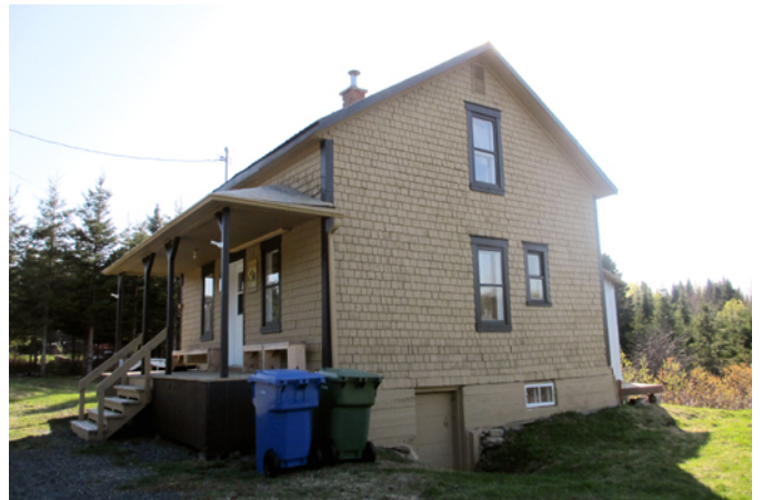
170, rang A

Dans les années 1930, pour favoriser la colonisation de certaines régions éloignées, le gouvernement fournit des plans standardisés de construction aux bâtisseurs. L'allure de cette maison construite vers 1930 est typique de cette maison qui tire ses influences de l'architecture vernaculaire américaine. Carré de bois surélevé du sol, toiture à deux versants droits, dimensions modestes, parement léger, ornementation réduite au maximum, tout est pensé pour simplifier et faciliter la construction d'une première demeure en milieu de colonisation. La propriété sise au 170 Rang A possède plusieurs composantes anciennes qui permettent de bien lire ce style soit le revêtement de bardeau de bois, les fenêtres à guillotine en bois et la conservation de sa volumétrie compacte.