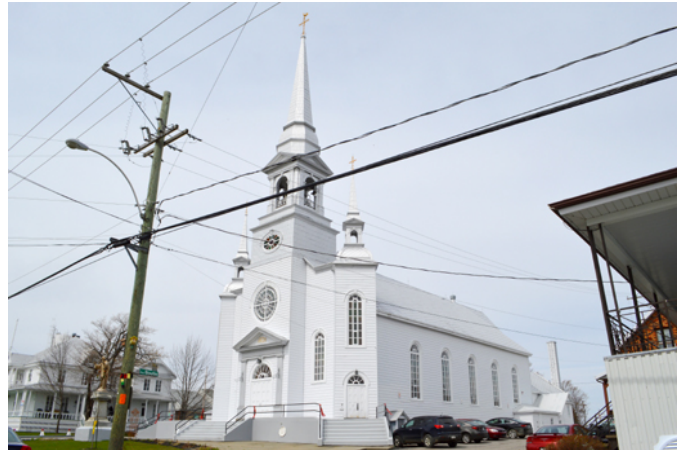
Église de Saint-Magloire, sise au 131, rue Principale