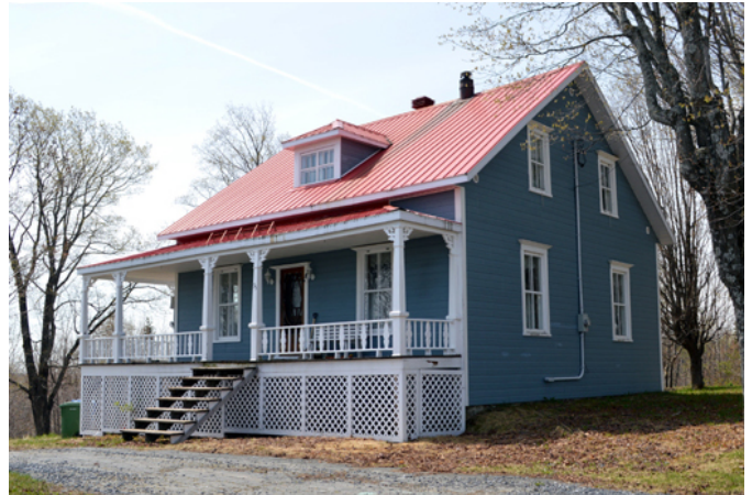
95, rue Principale

Cette demeure est issue du courant vernaculaire américain qui gagne en popularité au Québec dès la fin du 19 e siècle. Les habitants des nouveaux secteurs de colonisation du début du 20 e siècle l'adoptent en masse, surtout ce modèle à deux versants droits au plan rectangulaire. La maison possède un revêtement en planches de bois à feuillure et des fenêtres anciennes à grands carreaux. La galerie couverte avec ses pièces de bois (balustrade, poteaux, aisseliers) ajoute beaucoup d'élégance à cette résidence plus que centenaire.