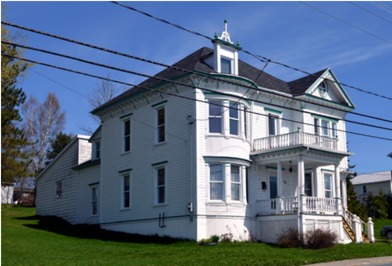
158, rue Principale, Sainte-Justine