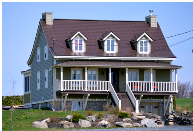
570, route 204

La résidence est de type traditionnel québécois avec sa toiture à deux versants courbés qui se prolongent au-delà des façades et ses ouvertures symétriques. Ce courant architectural est très populaire au Québec pendant tout le 19 e siècle et résulte d'un certain métissage des traditions architecturales françaises, québécoises et britanniques. Ce style architectural est assez bien représenté dans la région des Etchemins.