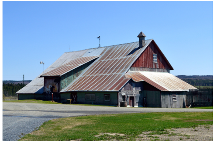
2232, 2 e Rang

La construction de cette grange-étable remonte probablement entre 1880 et 1940. Elle présente un volume intéressant qui est sans doute le produit de quelques agrandissements successifs afin de répondre aux différents besoins de ses propriétaires. Elle possède une architecture unique et fonctionnelle, peu rencontrée dans la région des Etchemins, en plus de s'insérer merveilleusement bien dans la campagne avec son revêtement de bois (planches verticales et bardeau), son lanterneau et sa girouette.