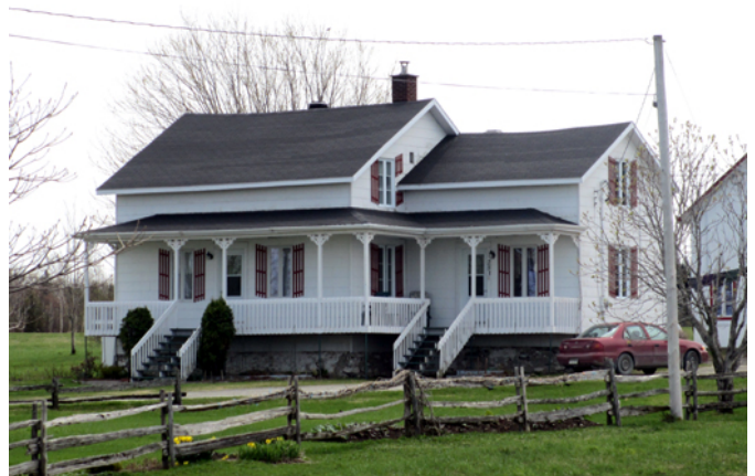
253, route 281