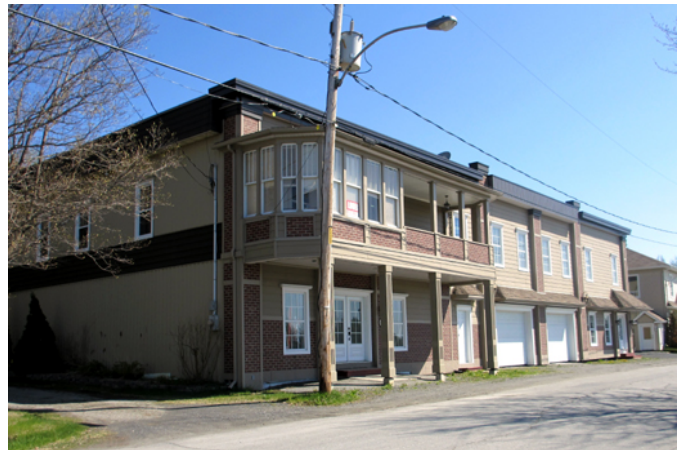
820-821, rue Lamontagne