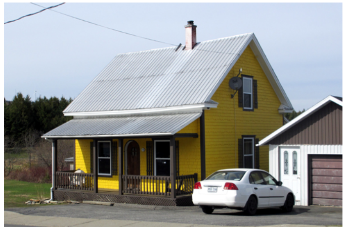
Maison Fortin, sise au 173, rue Principale