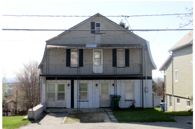
253-255, rue Principale