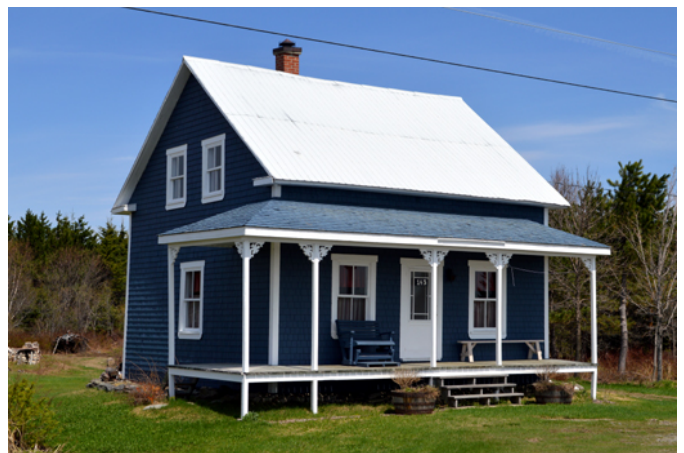
143, rang Saint-Charles