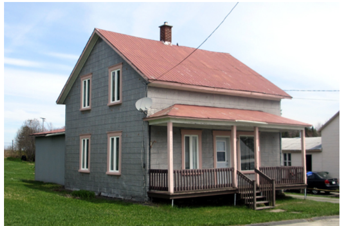
21, rue de la Fabrique

L'une des caractéristiques du paysage bâti de Saint-Camille-de-Lellis est la conservation des parements de tôle embossée sur quelques résidences anciennes. Ce type de revêtement connaît une grande popularité au début du 20 e siècle. Produit en série par des compagnies dans une grande variété de motifs, il peut revêtir autant les murs intérieurs qu'extérieurs. Pour l'extérieur, les motifs embossés reproduisent les matériaux de construction traditionnels. Dans le cas de cette maison construite vers 1918, le revêtement imite l'apparence de la pierre de taille à bossage. Ce revêtement constitue alors une alternative au parement de bois traditionnel. La maison appartient au courant architectural vernaculaire américain en raison de son carré rectangulaire aux dimensions modestes, à sa toiture à deux versants droits, à la symétrie de la façade et à la sobriété de son ornementation.