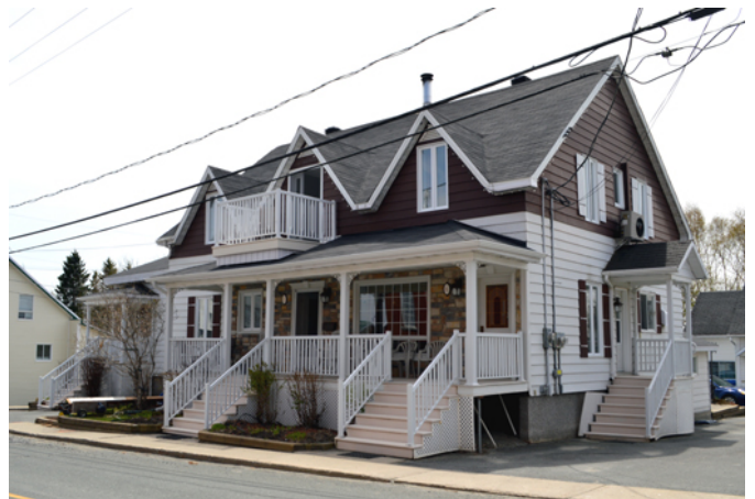
8-10, rue de la Fabrique

La construction de cette demeure remonte à 1899-1900 pour servir de chapelle aux pionniers du territoire de Saint-Camille-de-Lellis. Les offices religieux s'y tiennent tous les mois, animés par des missionnaires de passage. Un agrandissement prolonge le bâtiment vers la gauche en 1902. Avec l'établissement de l'église en 1906, les célébrations cessent d'y être tenues, mais la bâtisse continue de loger le curé jusqu'à l'édification d'un vaste presbytère en 1919. Pendant quelques années, elle accueille une salle publique et la centrale téléphonique pour ensuite être convertie en résidence privée. Son style architectural demeure fidèle au courant vernaculaire américain introduit au Québec vers la fin du 19 e siècle et fortement prisé dans la construction immobilière par les habitants de toutes les classes sociales. On peut admirer ici le modèle avec plan rectangulaire, doté de trois lucarnes triangulaires et d'ouvertures symétriques. À l'origine, un balcon parcourait tout l'étage de la façade principale.