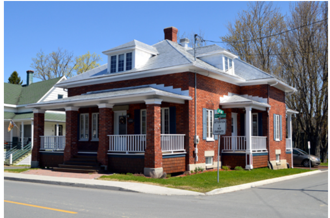
2385, 20 e Avenue