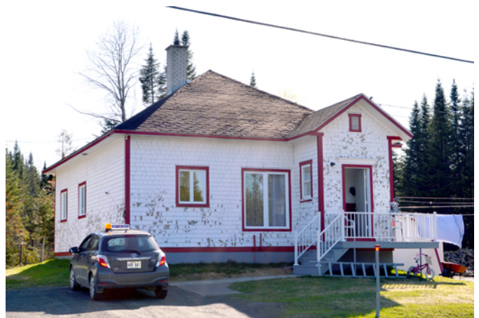
Ancienne école n o 2, sise au 1185, route 204 Est

La petite école avec un toit en pavillon est un modèle répandu en milieu rural entre la fin du 19 e siècle et les premières décennies du 20 e siècle. Elle possède habituellement une fenestration abondante, un revêtement extérieur léger en planches de bois, en bardeaux de bois et parfois en tuiles d'amiante-ciment. Les chambranles et les planches cornières constituent généralement les seuls ornements.