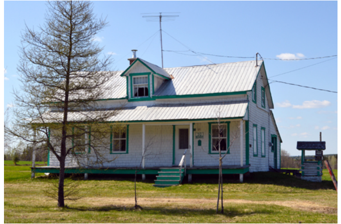
10, 10 e Rang

La résidence située au 10, 10 e Rang est représentative du modèle vernaculaire américain qui remplace progressivement la maison traditionnelle québécoise à partir de la fin du 19 e siècle. La maison bien conservée possède toujours son revêtement de bardeau de cèdre, ses portes et fenêtres traditionnelles en bois ainsi que sa galerie couverte en façade. Son ornementation sobre, composée de planches autour des ouvertures, appelées chambranles, témoigne de la simplicité des formes architecturales typiques de la région des Etchemins.