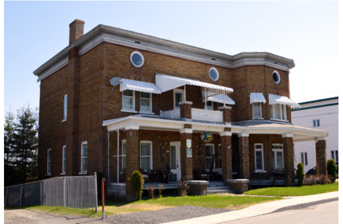
Maison des docteurs, sise au 2715-2719, 20 e Avenue

La maison s'apparente au modèle cubique, mais contrairement au toit à pavillon qu'elle a l'habitude de posséder, celle-ci arbore une toiture plate. Ce type de résidence, appelée Four Square House aux États-Unis où elle est conçue à la fin du 19 e siècle, constitue une véritable révolution dans l'habitation au tournant du 20 e siècle. Elle est spacieuse, économique et facile à construire.