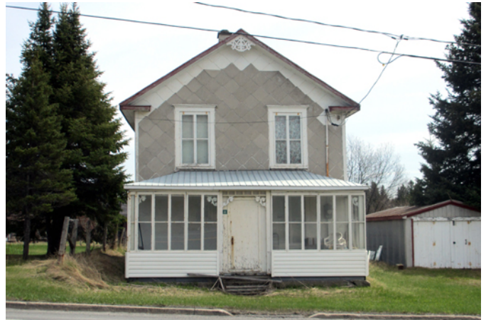
6, route 204 Ouest

Cette maison a probablement été érigée entre 1900 et 1930. Elle attire l'attention par son revêtement d'amiante-ciment en losanges, un revêtement populaire au Québec au cours de cette période. Avec son mur pignon orienté face à la rue, la résidence est typique du modèle de maisons vernaculaires américaines importé des États-Unis vers la fin du 19 e siècle. Les maisons de ce style partagent des caractéristiques similaires : fenêtres, portes et ornements de bois standardisés, plan au sol rectangulaire ou en « L », ouvertures symétriques et toiture à deux versants droits. À noter les beaux chambranles moulurés qui ceinturent les fenêtres.