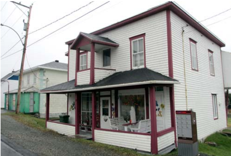
10, route 204 Ouest, Saint-Camille-de-Lellis