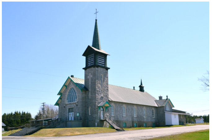
Église de Sainte-Aurélie, sise au 159, chemin des Bois-Francis