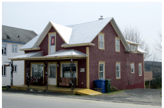
Maison du patrimoine, sise au 132, rue Principale