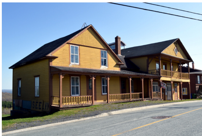
Magasin général, sis au 600-602, rue Principale

L'architecture du magasin général est typique du courant vernaculaire américain. Il se trouve aujourd'hui dans une forme remarquable grâce à la conservation de composantes anciennes qui rappellent sa fonction d'origine comme les vitrines commerciales et les hautes portes à panneaux surmontées d'impostes à carreaux. En outre, il est encore recouvert d'un revêtement en bois et peu de modification ont été apportées qui aurait pu brouiller sa volumétrie et sa composition d'origine.