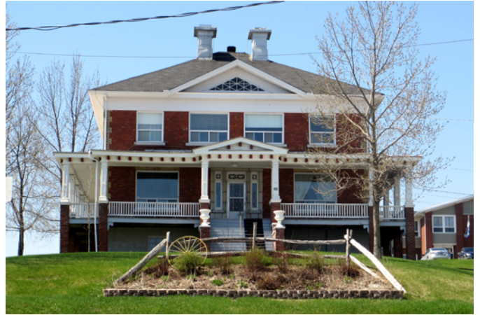
Presbytère de Saint-Prospier, sis au 2950, 19 e Avenue

Au début des années 1910, le vieux presbytère de Saint-Prospier tombe en ruines. Pour mieux loger le curé de la paroisse, personnage des plus respecté dans la communauté locale, une deuxième maison curiale vient le remplacer en 1916–1917. L'architecte Lorenzo Auger conçoit les plans d'une vaste résidence au style cubique remarquable par sa toiture en pavillon et sa grande surface habitable répartie sur deux étages. Au cours de sa carrière, en plus de concevoir un très grand nombre de résidences et une centaine de commerces, il obtient plusieurs contrats pour des églises, des couvents, des écoles et des bâtiments municipaux, principalement dans la région de Lévis et de Québec. Dans la région des Etchemins, il est le concepteur de l'église de Saint-Cyprien. Élément particulier pour l'époque, c'est une éolienne de la compagnie Delco qui fournit l'éclairage électrique au presbytère.