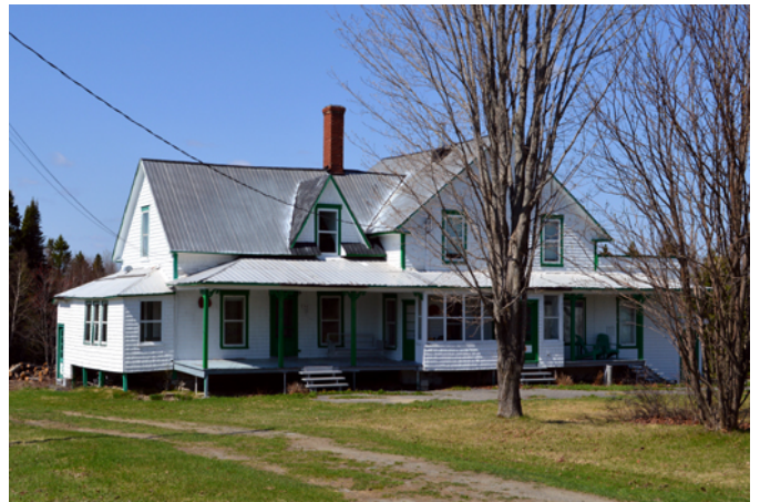
Maison Larivière, 7555, 7 e Rang

Cette maison est construite en 1928 sur la terre de la famille Larivière. Il s'agit d'une version assez élaborée d'un cottage vernaculaire américain. Les agrandissements successifs qui ont modifié l'aspect d'origine de la demeure forment un tout harmonieux en raison du revêtement de bardeau de bois uniforme et des nombreux ornements (aisseliers, chambranles, planches cornières). La grange-étable qui se dresse à proximité est absolument magnifique. Elle possède une architecture particulière rare dans la région des Etchemins. Toute de bardeaux de bois revêtue et coiffée d'un lanternon avec un sommet en pavillon, elle se démarque par ses grandes dimensions et rappelle la vocation agraire du site.