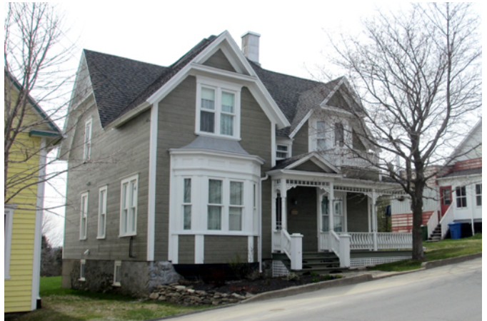
Maison Champagne, sise au 154, rue Principale

Au début du 20 e siècle, la famille Audet, bâtisseurs d'églises à l'époque, entreprend la construction de cinq maisons semblables dans le village de Saint-Magloire. Cette maison et sa voisine sise au 156 rue Principale sont les deux dernières survivantes de cet ensemble. Elle est bâtie par Georges Audet, un personnage important dans l'histoire de Saint-Magloire. Il est notamment maire de la municipalité de 1913 à 1916, en plus de diriger les travaux de construction de plusieurs églises, dont ceux du parachèvement intérieur du lieu de culte du village en 1901, et d'assurer la construction du presbytère de Saint-Magloire en 1906. La résidence est édifée en 1908 et se différencie par l'élégance de ses lignes rattachées au style victorien des maisons voisines à l'allure plus sobre. Dès la fin du 19 e siècle, ce courant architectural développé en Angleterre devient populaire au Québec. Il puise librement dans des styles anciens les éléments les plus divers afin de créer un style nouveau. Le plan asymétrique de la résidence, ses nombreuses saillies, sa galerie couverte et son ornementation abondante, tous des éléments représentatifs de ce courant, sont visibles sur la maison. Entre les années 1930 et 1950, la résidence accueille une succursale de la Banque Canadienne Nationale dirigée par Herménégilde Champagne.