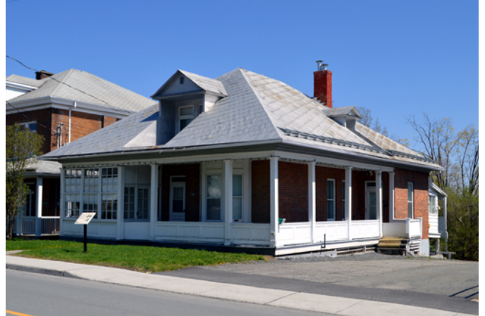
Maison Samson, sise au 2845, 20 e Avenue