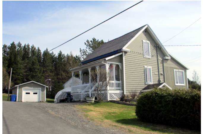
164, rue Principale

Cette maison est bâtie vers 1901 et sert ensuite d'école où enseigne la première institutrice de Saint-Luc-de-Bellechasse. La résidence est représentative du cottage vernaculaire américain dont le modèle à deux versants droits remplace progressivement la maison traditionnelle québécoise à partir de la fin du 19 e siècle. Le cottage vernaculaire américain se distingue de la maison traditionnelle québécoise par un volume qui s'élève généralement sur deux étages, conférant ainsi plus de verticalité à la demeure, ainsi que par une toiture à deux versants droits à 45 degrés, sans larmiers recourbés. On retrouve dans cette architecture le même souci de rigueur quant à la symétrie de la façade et à son ordonnance. Bien que la résidence ait subi bon nombre de modifications architecturales, elle possède toujours un excellent potentiel de mise en valeur.