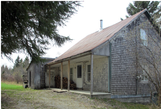
341, route 281

La construction de cette maison remonte au début du 20 e siècle. Sur le plan architectural, elle est représentative du modèle de la maison de colonisation qui apparaît au Québec dans la première moitié du 20 e siècle. Influencée par l'architecture vernaculaire américaine, cette maison de dimensions modestes se caractérise par un carré de bois surélevé du sol et coiffé d'une toiture à deux versants droits. Son revêtement mural traditionnel est en bardeau de cèdre et les ouvertures sont réparties de façon symétrique. Les chambranles et les planches cornières constituent l'ornementation de base de ce modèle qui comprend habituellement une galerie en façade de facture sobre.