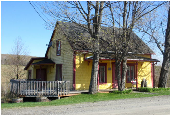
288, 12 e Rang Est

Cette maison est construite vers 1900, à une époque où le territoire de Saint-Benjamin est couvert d'une dense forêt qu'il faut alors défricher. Aujourd'hui encore, elle se dresse dans un rang isolé dominé par des champs et des zones forestières. De petites dimensions et coiffée d'une toiture à deux versants droits, elle s'apparente au type de résidences que les habitants se construisaient dans les milieux nouvellement ouverts à la colonisation. Elle est recouverte de bardeau de bois, matériau alors très disponible et offert à coûts raisonnables. La sobriété de son ornementation évoque notamment les conditions modestes de son constructeur qui vivait probablement du travail de la terre ou de la forêt.