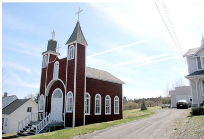
Chapelle Sacré-Cœur, sise au 303, rue Principale