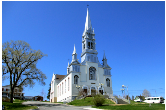
Église de Saint-Prospér, sise au 2850, 19 e Avenue

À la suite de la fondation de la paroisse de Saint-Prospér, l'édification d'une grande église en bois vient remplacer la première chapelle datant de 1887. En mai 1902, Jean Larochelle en débute la construction pour la somme de 10 300 $. Suivant les plans de l'architecte Joseph-Georges Bussières, la charpente fait 150 pieds de longueur sur 60 pieds de largeur et le style est typiquement néoclassique, comme de nombreuses autres églises du Québec à cette époque. En 1907, la firme Lévesque et Ouellet se voit confier la réalisation de plans et devis pour le parachèvement intérieur de l'église. Les travaux sont confiés en 1908 aux entrepreneurs Elzéar Métivier & Fils de Saint-Damien-de-Buckland. Ils ajoutent deux autels latéraux et des gloires à la voûte. Des dorures complètent l'intérieur de l'église. Deux clochetons, transportés de Saint-Damien-de-Buckland par des chevaux, sont érigés de chaque côté du grand clocher. Le 10 août 1919, le cardinal Louis-Nazaire Bégin bénit les grandes orgues fabriquées dans les ateliers Casavant de Saint-Hyacinthe en 1918.