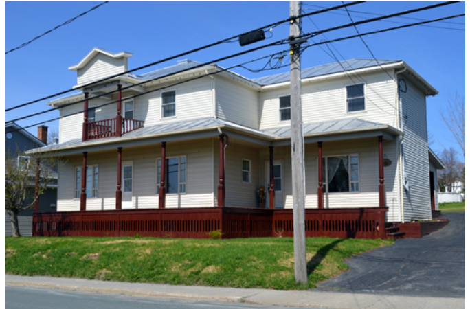
186, rue Principale

Cette maison aurait été construite vers 1910. Son histoire est plutôt méconnue mais elle fait partie des nombreuses maisons cossues qui composent le village de Sainte-Justine. Son architecture particulière est représentative du modèle de la maison cubique ou Four Square House , qui a été créé aux États-Unis à la fin du 19 e siècle. Cette architecture est ensuite rapidement diffusée au Canada par les catalogues de plans et plait particulièrement aux familles nombreuses en raison de son vaste espace habitable. Elle est également souvent adoptée par les notables qui souhaitent affirmer leur statut social par une demeure monumentale et bien décorée. C'est le cas ici de cette maison qui a conservé son toit à quatre versants caractéristique revêtu de tôle pincée. Parfaitement symétrique, la maison est dotée d'une vaste galerie couverte. Le balcon central de l'étage est ici surmonté d'un haut parapet qui permet ici d'affirmer encore plus la résidence sur la rue Principale. Les poteaux tournés de la galerie et du balcon ainsi que la balustrade et la jupe de galerie font partie des autres éléments d'intérêt de cette demeure.