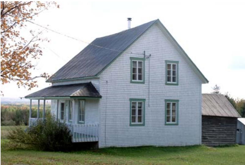
220, 5 e Rang, Sainte-Rose-de-Watford