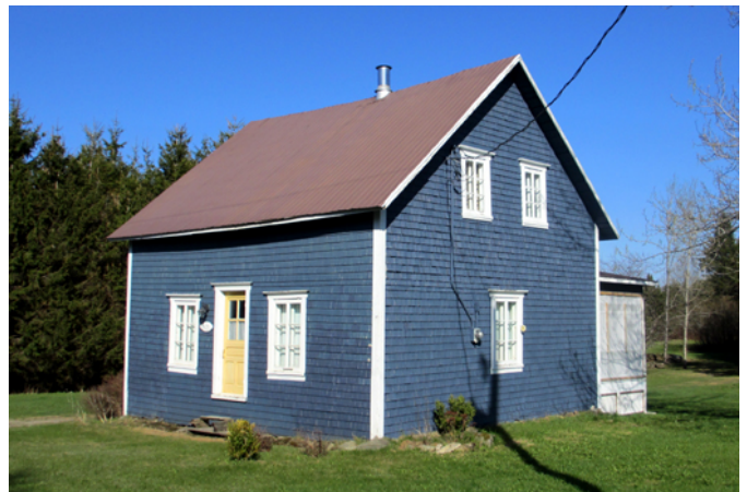
625, rang Sainte-Marie Est