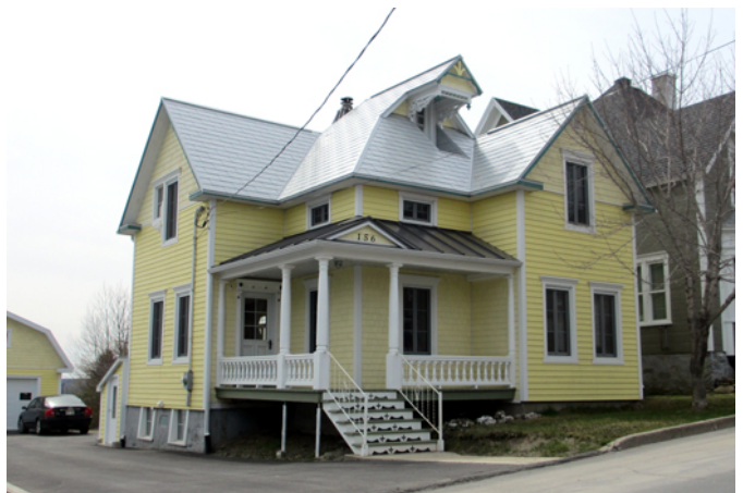
156, rue Principale