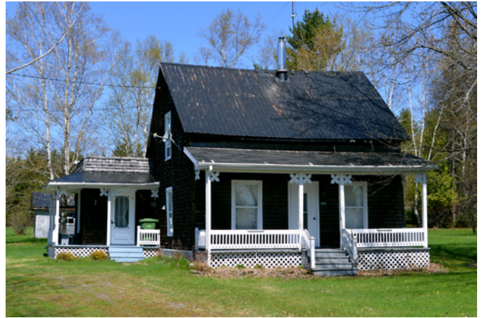
3235, 50 e Rue

La maison est construite en 1915 par Édouard Samson. Elle est représentative du modèle de la maison de colonisation qui apparaît au Québec dans la première moitié du 20 e siècle. Influencée par l'architecture vernaculaire américaine, cette maison de dimensions modestes se caractérise par un carré de bois surélevé du sol et coiffé d'une toiture à deux versants droits. Son revêtement extérieur traditionnel est en bardeau de cèdre et les ouvertures sont réparties de façon symétrique. Les chambranles et les planches cornières constituent l'ornementation de base de ce modèle qui comprend habituellement une galerie en façade de facture sobre. En 2015, la maison est toujours la propriété de la famille Samson.