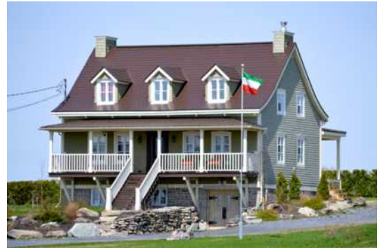
570, route 204, Sainte-Justine