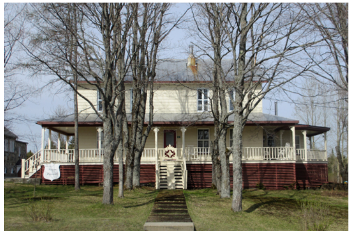
Ancien presbytère de Saint-Luc, sis au 197 rue Principale

La première église de Saint-Luc et sa maison curiale sont emportées par les flammes en 1936. Cette même année, un nouveau temple et un deuxième presbytère viennent les remplacer, tous deux conçus par l'architecte René Blanchet. Le presbytère conserve sa fonction d'origine jusqu'en 1993, année où il est vendu. Il appartient au courant vernaculaire américain reconnaissable à son carré au sol de forme rectangulaire, la simplicité de ses lignes, sa toiture à deux versants droits et la symétrie de ses ouvertures.