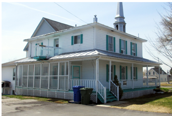
Ancien presbytère, sis au 2, rue Saint-Charles

L'ancien presbytère de Sainte-Sabine possède une structure et un revêtement de bois. Il est un fidèle représentant de la maison cubique imaginée à la fin du 19 e siècle aux États-Unis. Ce type de résidence dotée d'un grand espace habitable est très prisé par le clergé catholique dans la construction des maisons curiales. En effet, ses nombreuses chambres permettent d'accueillir sous le même toit autant les nombreux religieux de passage, les domestiques et le curé.