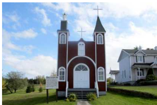
Chapelle du Sacré-Cœur, sise au 303, rue Principale, Sainte-Justine