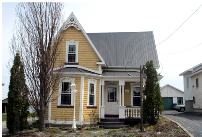
658, rue Principale

Cette magnifique maison est érigée vers 1920. Elle se distingue des autres résidences du village de Saint-Camille-de-Lellis par son architecture plus recherchée et son haut degré d'authenticité octroyé par la préservation de plusieurs composantes anciennes telles que son revêtement en bardeau de bois et son ornementation élaborée. La demeure appartient au courant vernaculaire américain développé aux États-Unis et apparu au Québec vers la fin du 19 e siècle. Plus précisément, elle constitue une variante de ce style dit « pittoresque » qui implique la présence d'une galerie couverte, d'un plan en « L » et d'une avancée coiffée d'un pignon à pente aigue. Pour contribuer à son opulence et à son ouverture sur la nature, une fenêtre en saillie ( bow-window ) perce joliment l'avancée.