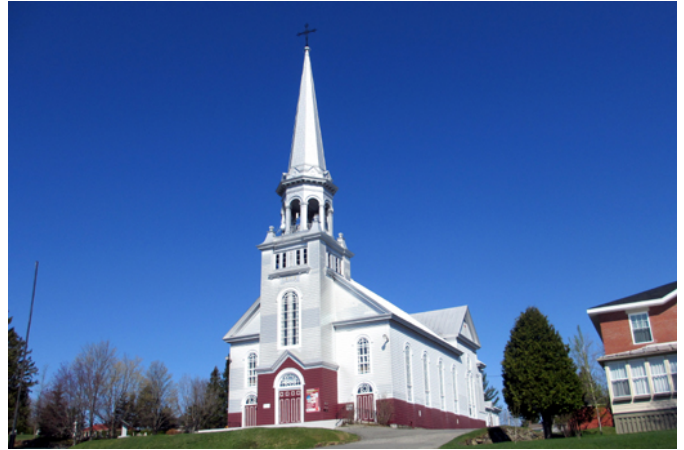
Église de Saint-Benjamin, sise au 252, rue Principale.

Comme la majorité des églises de la région des Etchemins, l'église de Saint-Benjamin est issue du courant néoclassique. On le reconnaît ici au souci accordé à la symétrie des ouvertures et à leur forme cintrée ainsi qu'au programme décoratif composé d'une corniche moulurée, de frontons et de chambranles. Ce style est conféré au bâtiment par les architectes David Ouellet et Pierre Lévesque, chargés de la conception des plans du bâtiment en 1906, et auteurs d'une multitude d'autres projets d'architecture ailleurs au Québec au tournant du 19 e siècle. Les travaux de construction se terminent en 1907, alors que le décor intérieur, signé Pierre Lévesque, est finalisé en 1916. Les cloches, en provenance de Morisset et Frères, sont hissées dans les clochers dès 1908. Cette église remplace la chapelle-école de 1895, devenue trop petite suite à la croissance de la population du secteur.