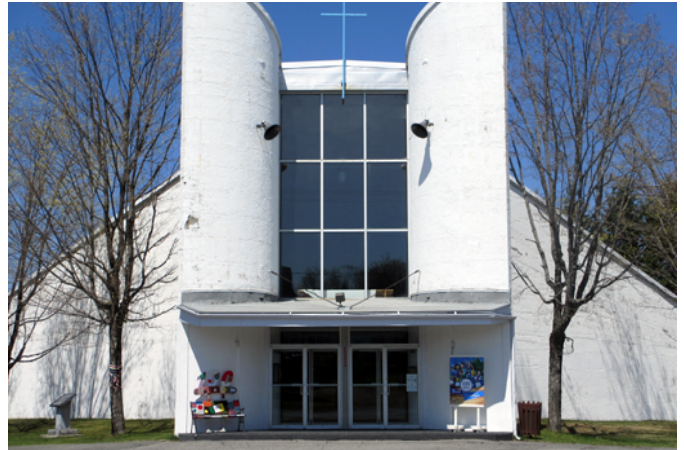
Église de Saint-Louis-de-Gonzague, sise au 111, rang de l'Église