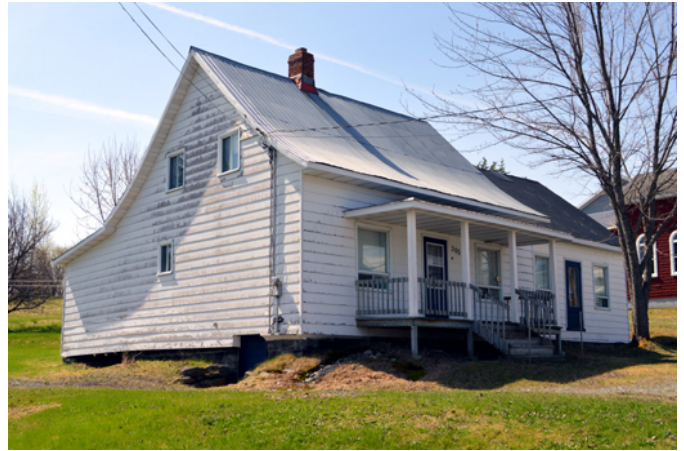
305, rue Principale

Probablement construite dans la seconde moitié du 19 e siècle par un dénommé Fortier, cette maison traditionnelle québécoise demeure muette quant à son histoire. L'une de ses principales caractéristiques est sa volumétrie formée d'un corps rectangulaire et d'un toit à deux versants galbé qui lui donne une certaine élégance. La symétrie parfaite de son corps principal est également typique des maisons québécoises. La résidence a été agrandie du côté droit en reprenant le modèle de la cuisine d'été traditionnelle qui est souvent associée aux maisons anciennes. Bien que la résidence ait subi bon nombre de modifications architecturales, elle possède toujours un excellent potentiel de mise en valeur.