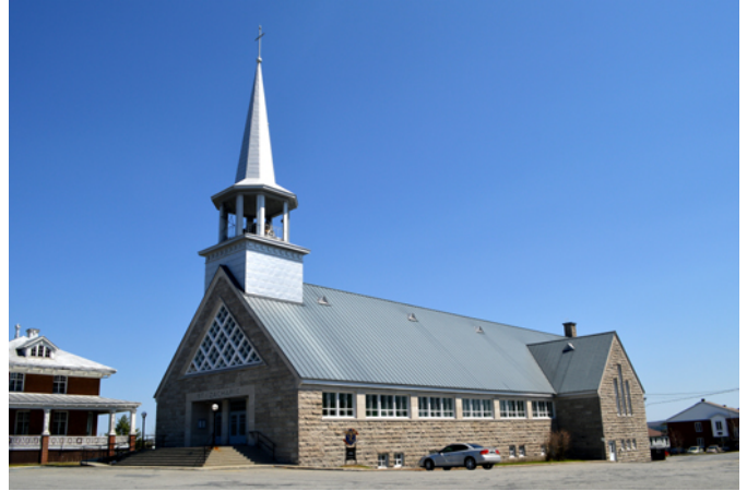
Église Saint-Zacharie, sise au 750, 15 e Rue

Le style de la nouvelle bâtisse s'inscrit dans la modernité. La façade principale est percée d'une grande ouverture triangulaire, caractéristique commune à plusieurs églises construites au Québec dans les années 1940 et 1950. Le revêtement en pierre présente des façades dépouillées d'ornementation, propres au style moderne alors qu'une série de fenêtres rectangulaires, aux lignes fonctionnelles, laissent pénétrer la lumière naturelle.