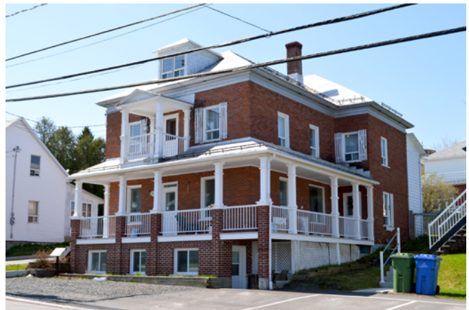
Maison Reny, sise au 2692, 20 e Avenue

La maison possède encore plusieurs composantes d'origine parmi lesquelles la tôle à la canadienne de la toiture, les poteaux en bois qui soutiennent les auvents, les portes en bois et la belle corniche de tôle moulurée.