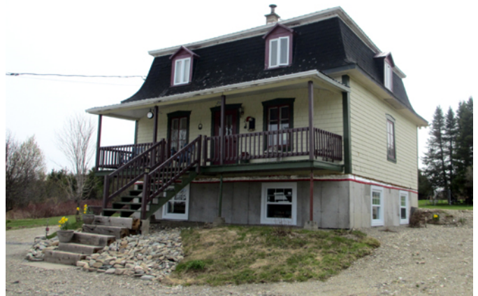
216, route 281

Cette résidence est édiflée vers 1890 pour loger une famille de cultivateurs. La fonction agricole du site est d'ailleurs confirmée par la présence d'une grange ancienne en bois bien conservée. La demeure principale est représentative du modèle de la maison à mansarde très prisé au Québec en milieu rural entre 1870 et 1920. La caractéristique principale de ce courant demeure la toiture que l'on dit mansardée dont la forme particulière permet de dégager complètement l'espace des combles et de procurer un second étage entièrement habitable. Si le modèle à deux versants est généralement plus courant au Québec, des modèles à quatre versants trouvent aussi preneurs au cours de cette période, comme dans ce cas-ci. À noter que la région des Etchemins possède peu d'exemple de ce style architectural et que cette maison-ci possède encore quelques composantes anciennes permettant d'apprécier son apparence d'origine.