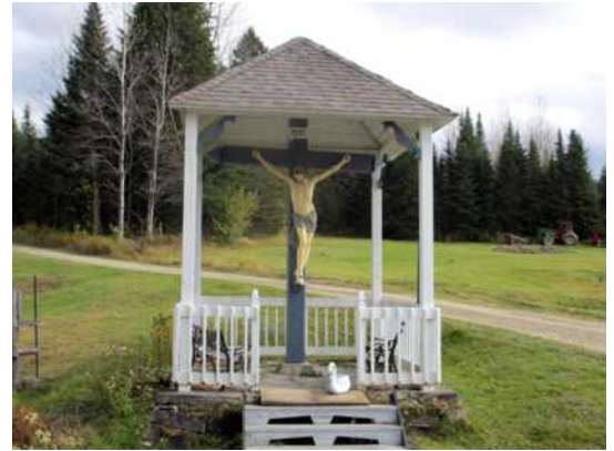
Calvaire, chemin Saint-Abdon, Saint-Luc-de-Bellechasse