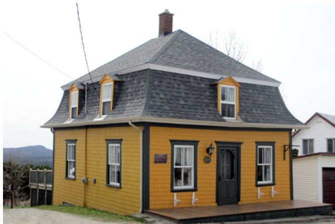
Maison Chabot, sise au 124, rue Principale