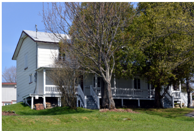
156, rue Principale