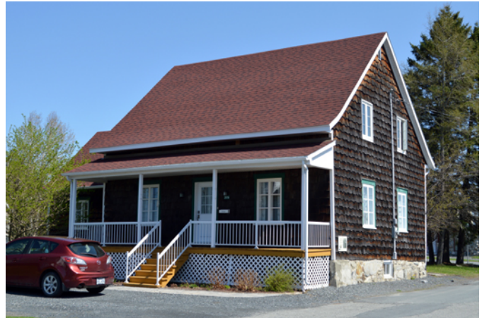
Maison Parent, sise au 2175, 22 e Rue

Cette maison est représentative de la maison traditionnelle québécoise avec ses deux larmiers recourbés, sa galerie en façade, son plan au sol rectangulaire et ses ouvertures symétriques. Les fenêtres à battants à grands carreaux, encore visibles sur la demeure, étaient le mode d'ouverture le plus populaire sur ce type de résidence. Pendant plusieurs décennies du 19 e siècle, les habitants des campagnes ont choisi ce style dans la construction de leur demeure.