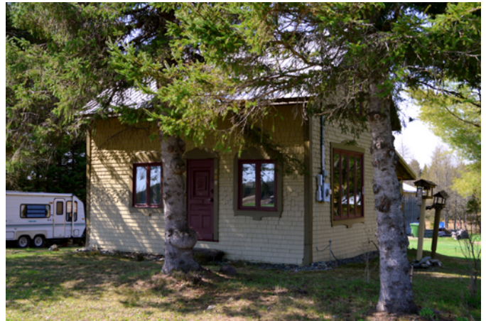
571, rang Saint-Pierre

Cette maison du rang Saint-Pierre aurait été construite vers 1900 par des Fortier. Elle aurait accueilli pendant un temps la sœur de Paul Rose. Ce sont les seules informations historiques connues sur cette maison de colonisation qui a été admirablement bien restaurée en 2014. Elle se démarque par son revêtement de bardeau de bois dont l'assemblage forme des motifs décoratifs sur ses façades. Les chambranles entourant les ouvertures et les planches cornières aux angles du bâtiment, peints de couleur contrastante, complète l'ornementation sobre de cette petite résidence rurale.