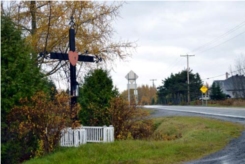
Croix de chemin, 3 e -et-4 e Rangs, Saint-Louis-de-Gonzague