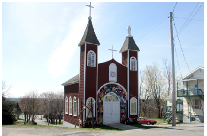
Chapelle Sainte-Anne, qui s'élève aux abords de la rue Principale