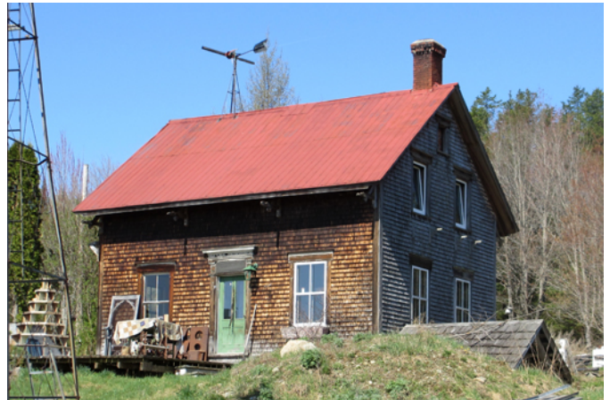
769, rang Watford

Vers 1920, cette petite demeure est bâtie pour abriter une famille de cultivateurs. Elle est d'ailleurs encerclée de bâtiments secondaires anciens qui rappellent le passé agricole des lieux. Cette maison bien préservée est typique de la maison de colonisation qui se caractérise par un volume modeste revêtu de bardeaux de cèdre, d'une ornementation sobre composée de planches de bois autour des ouvertures, nommées chambranles, et de planches cornières, ainsi que de fenêtres à guillotine avec de grands carreaux. Un élément unique est à souligner : le beau portail néoclassique au-dessus de l'entrée principale.