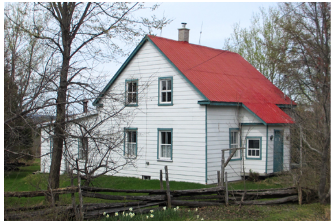
39, rang de Bellechasse