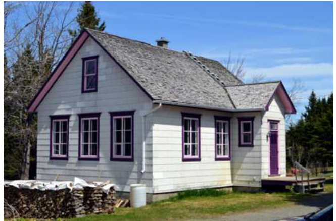
L'ancienne école du P'tit Nord, sise au 49, rang Saint-Georges

À l'époque de sa construction, le Département de l'instruction publique fournit des plans standardisés pour la conception des petites écoles de rang. Le plan est rectangulaire, la toiture est composée de deux versants droits, la fenestration est abondante et la façade est dotée d'un tambour en bois pour protéger l'intérieur du froid. Encore aujourd'hui, la majorité des composantes ont été préservées grâce auxquelles on reconnaît facilement l'ancienne vocation scolaire du bâtiment.