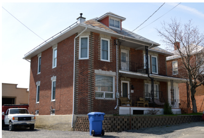
255, rue Principale