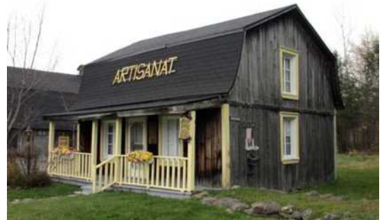
3821, 8 e Rue, Saint-Prosper