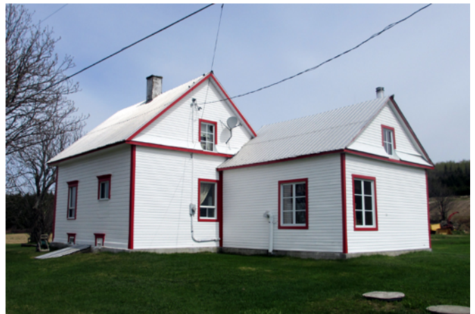
75, rang Saint-Cyrille

Cette maison est bâtie vers 1900. Ce type de cottage vernaculaire a été développé aux États-Unis puis introduit au Canada à la fin du 19 e siècle. Ce courant est caractérisé par la simplicité de l'accès aux plans et aux matériaux de même que par sa construction à faible coût. Cette architecture originaire des États-Unis a connu un vif engouement au Québec entre la fin du 19 e siècle et la première moitié du 20 e siècle. Elle est très bien représentée dans la région des Etchemins. Il peut paraître étrange aujourd'hui de voir une maison qui fait dos à la voie publique. La porte principale peut avoir été changée de place ou c'est le chemin qui a été déplacé au fil des années. La maison pourrait aussi avoir été déménagée.