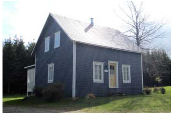
625, rang Sainte-Marie Est, Saint-Cyprien