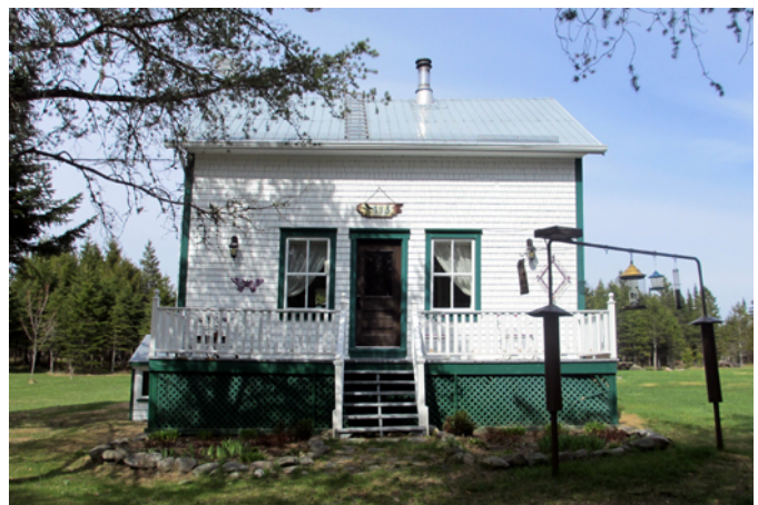
193, chemin du Lac-à-Bœuf

Cette maison a probablement été construite dans les années 1930. Elle prend place sur une terre qui appartient, avant 1924, à la compagnie de bois Henry Atkinson propriétaire d'un important moulin à scie à Saint-Romuald. Ce lot fait alors partie des milliers d'âres de concessions forestières utilisées par l'entreprise pour fournir le bois à ses scieries. La maison est typique des habitations construites dans les milieux de colonisation dans les premières décennies du 20 e siècle, aussi a-t-elle probablement été édifée au cours de cette période. Elle possède plusieurs éléments anciens qui contribuent à lui octroyer intérêt et valeur patrimoniale tels que son revêtement en bardeau de bois, ses fenêtres et porte anciennes et la conservation de ses ornements (chambranles et planches cornières). L'ensemble est complété d'une remise et d'un hangar de bois avec portes et fenestration anciennes.