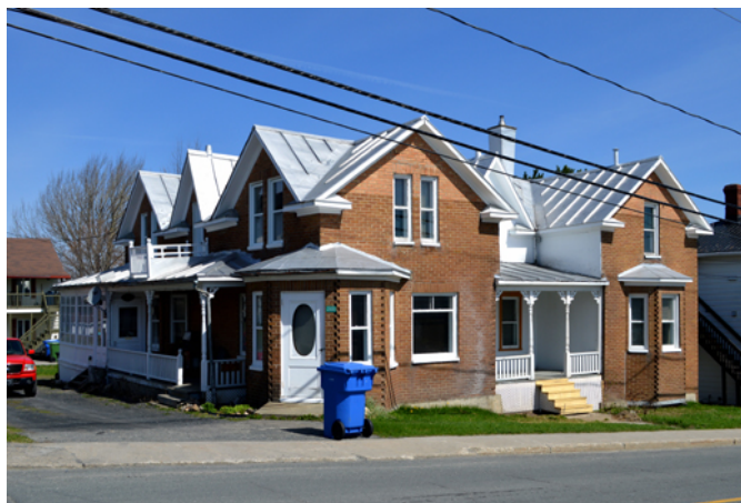
260-262, rue Principale

Cette maison particulière, aurait été construite vers 1900 et agrandie en 1923. Pendant plusieurs années, elle a abrité un bureau de notaire, d'où son caractère cossu habituellement réservé aux maisons de notables et son entrée sur le coin qui servait probablement à recevoir les clients de façon distincte de l'entrée principale de la résidence. Issue du courant vernaculaire américain, la maison en brique possède une architecture particulièrement élaborée. Son toit revêtu de tôle pincée possède de nombreux pignons qui lui donnent une silhouette distinctive. De plus, son ornementation est des plus développées, rappelant même certaines résidences victoriennes : corniches, poteaux de galerie tournés, aisseliers décoratifs et fenêtre en saillie à trois pans appelée oriel.