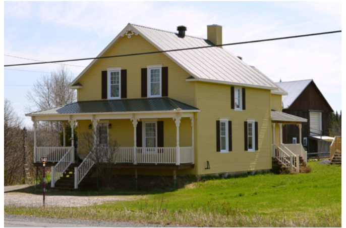
1401, route 204