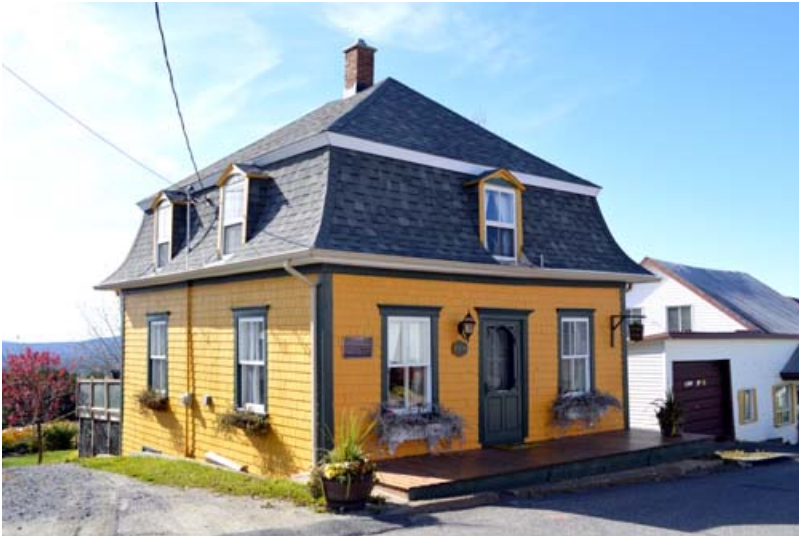
54, rue Principale, Saint-Magloire