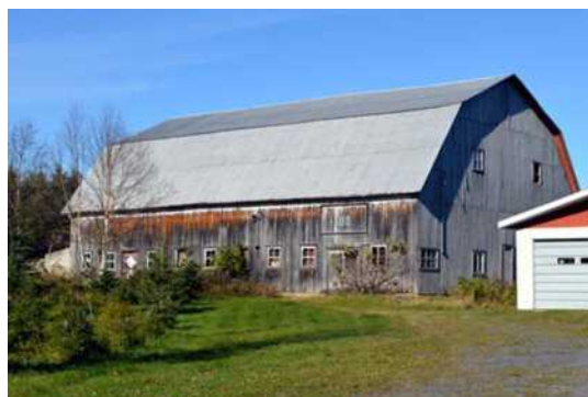
181, rang Saint-Charles, Sainte-Sabine