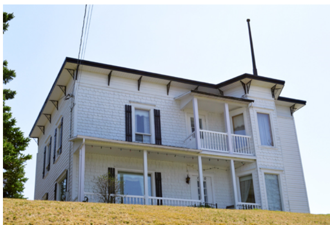
610, 15 e Rue

Érigée vers 1912, cette maison issue de l'éclectisme victorien, un style qui vise d'abord à produire des effets inédits et pittoresques. Cette pratique artistique est fondée sur l'exploitation et la conciliation des styles du passé. L'éclectisme permet ainsi la combinaison de plusieurs styles ou éléments appartenant à des époques et des pays différents afin de créer des compositions très élaborées et souvent marquées par une surcharge décorative. La maison possède une toiture plate et un volume rectangulaire égayés par la présence d'un oriel et d'une ornementation élaborée. Celle-ci se compose d'une belle corniche à consoles, d'un mat, d'un revêtement en bardeau découpé, de planches cornières et de chambranles.