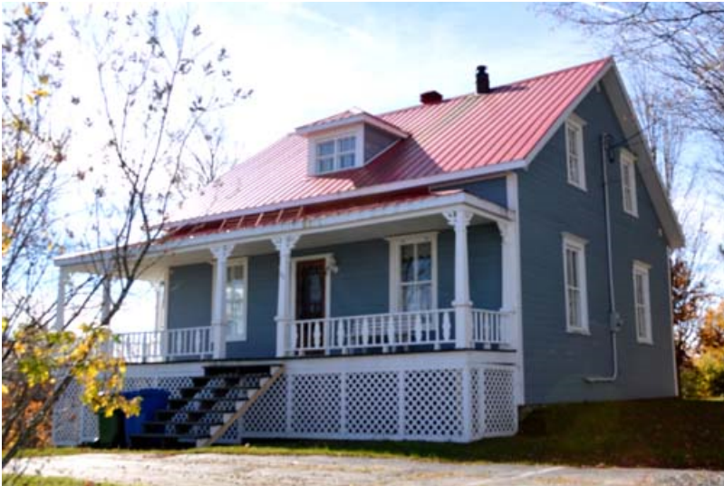
95, rue Principale, Sainte-Sabine