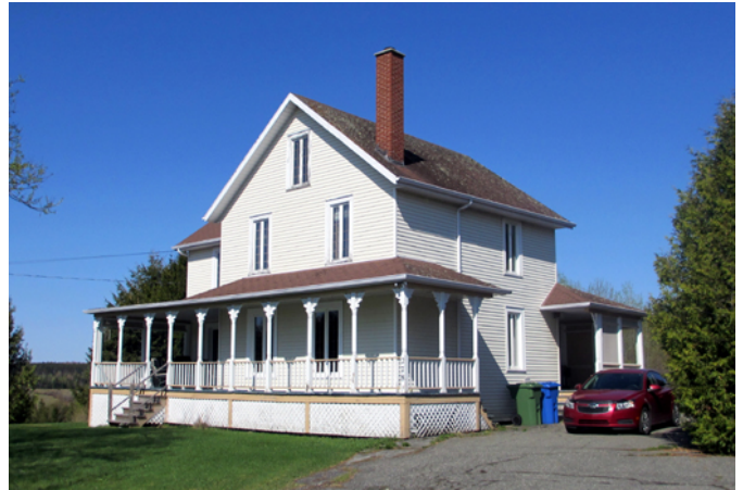
278, avenue Principale

Cette maison a probablement été construite vers 1900. Il s'agit d'un modèle populaire de maisons importé des États-Unis à la fin du 19 e siècle qui se distingue par son carré rectangulaire ou en « L », ses ouvertures symétriques et sa toiture à deux versants droits. Initialement, la demeure possède un revêtement en bois ou en amiante-ciment et une ornementation sobre principalement composée de chambranles autour des fenêtres, de planches cornières pour souligner la fin des façades et d'un garde-corps de bois.