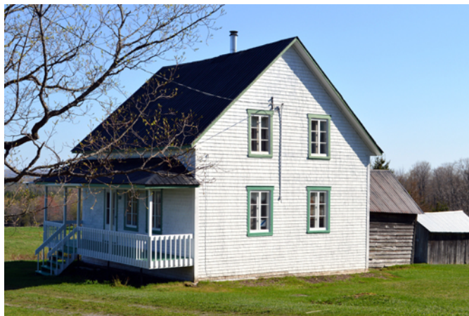
Maison Dallaire, sise au 220, 5 e Rang

Cette petite maison possède un revêtement en bardeau de bois fort bien entretenu et peint en blanc. Les chambranles sont mis en valeur grâce à une peinture contrastante de couleur verte. Les fenêtres anciennes à battants avec de grands carreaux ont été conservées. Cette habitation est typique de la maison construite en milieu de colonisation à la fin du 19 e siècle. Avec son volume modeste, son plan rectangulaire, sa toiture à deux versants droits et son ornementation peu présente, on l'associe facilement à la maison de colonisation. Des bâtiments secondaires anciens, revêtus de bois, entourent la maison principale et témoignent des activités agricoles du site.