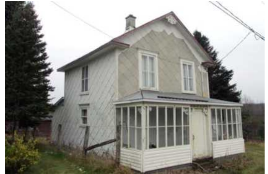
6, route 204 Ouest, Saint-Camille-de-Lellis