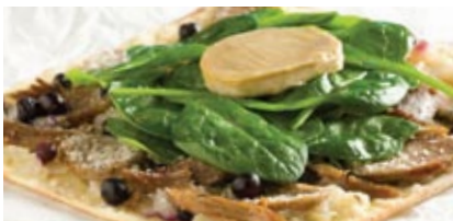
Pizza au canard confit et foie gras

Vive la diversité sexuelle ! St-Valentin: fête de l'amour hétéro ?