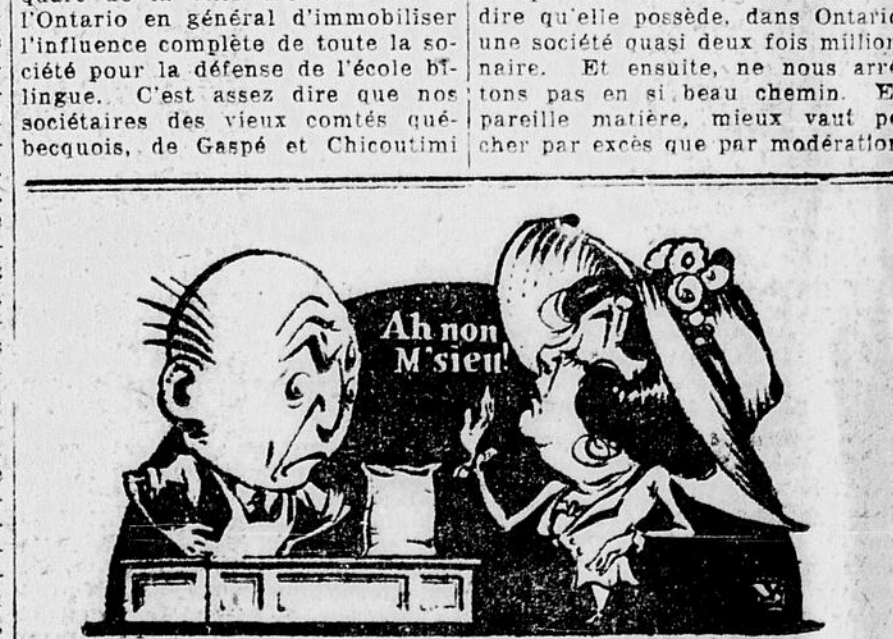
C'est extraordinaire! J'en suis toute étonnée! Même les petits enfants sentent la différence! Il n'y a que la délicieuse LANTIC pour les satisfaire. Il me la faut pour avoir la paix à la maison. Voyez, monsieur l'épicer, donnez-moi, sans faute, la Cassonade LANTIC.

Pour infuser un regain de vie aux conseils locaux, il faut aviser aux moyens d'établir un contact plus serré entre eux et le bureau central. Ce devrait être la tâche du prochain Exécutif de suivre de près les conseils, par visites et correspondance, pour les protéger contre l'apathie et la léthargie. Il faut tenir des assemblées pour stimuler l'ardeur, organiser des soirées ou parties de cartes, se servir de l'agréable pour arriver à l'utile et au nécessaire. Il faut surtout intéresser la jeunesse à la mutualité franco-catholique, avant qu'elle ait pris le chemin des lieux d'amusements d'où on ne sort pas sans