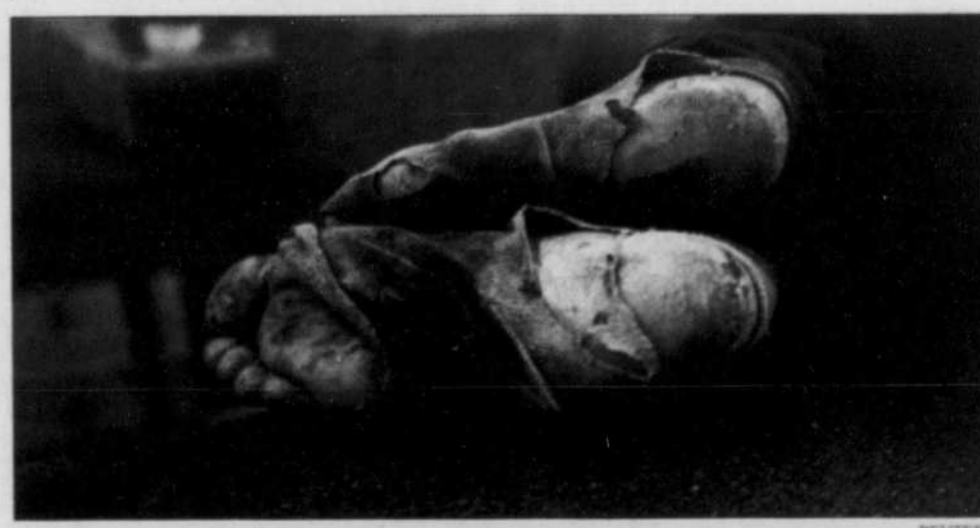
REUTERS Selon une étude de l'ONU, un patrimoine personnel de 2200 dollars ou plus permet de faire partie des 50 % des personnes les plus riches au monde.